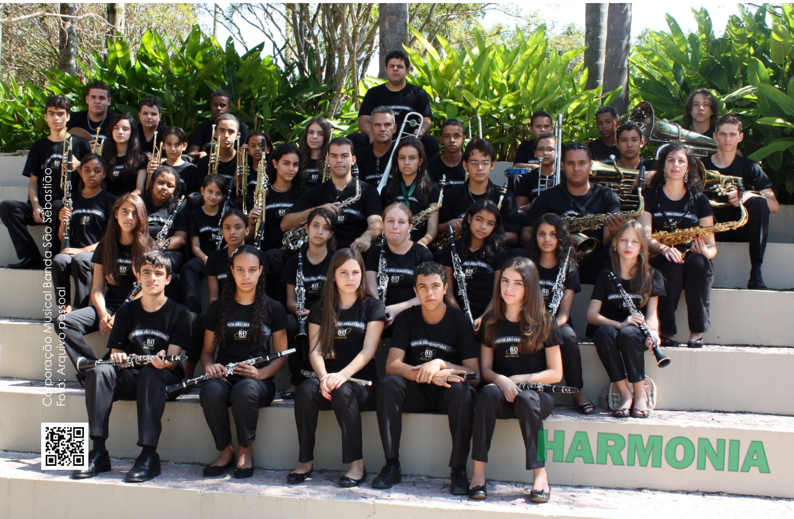
Corporação Musical Banda São Sebastião