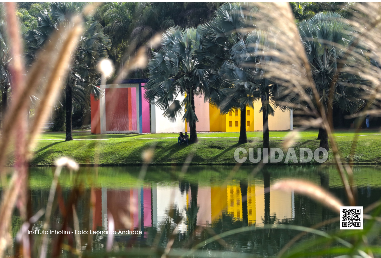
Instituto Inhotim