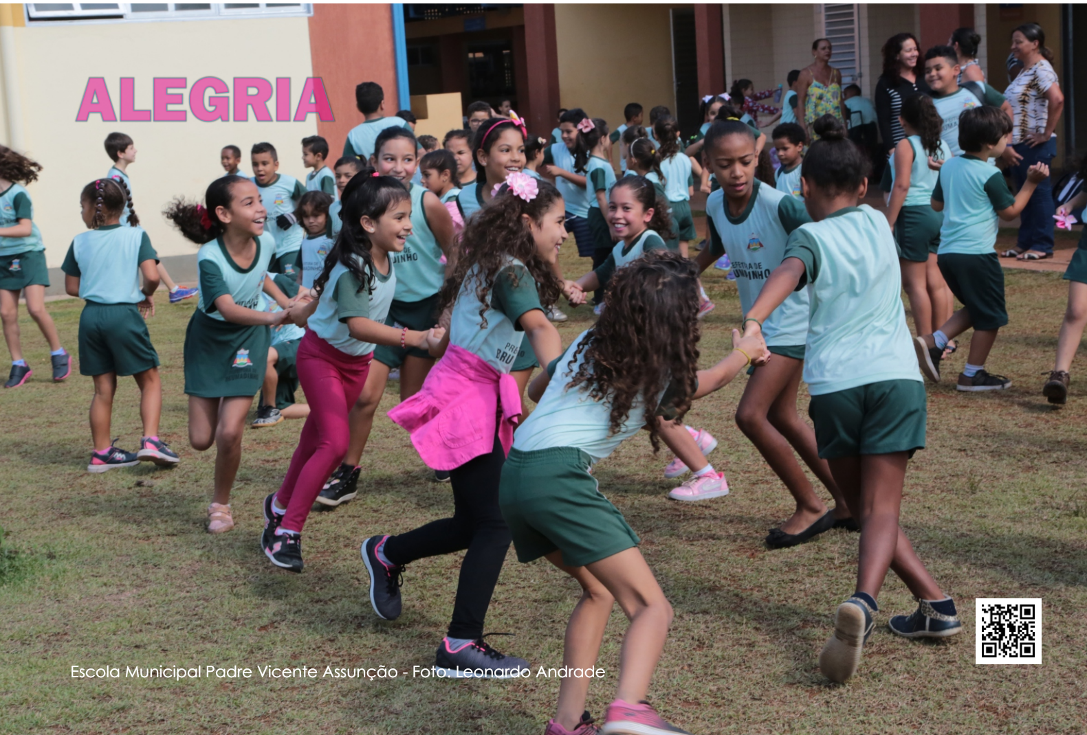
Escola Municipal Padre Vicente Assunção