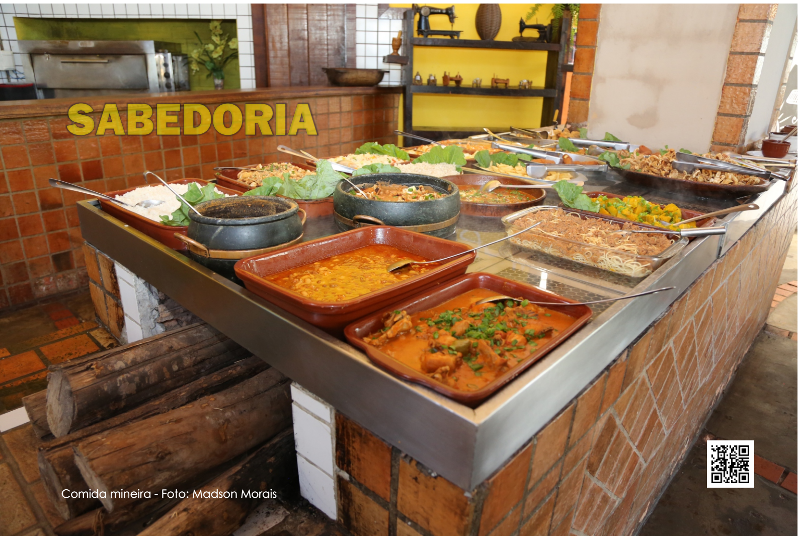
Comida mineira - Foto: Madson Morais