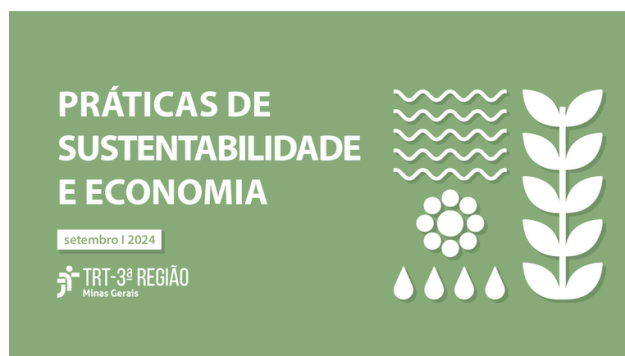
Figura 9 - Cartilha de Sustentabilidade

O TRT3 também promove outras ações no âmbito da sustentabilidade, participando de eventos temáticos, como a Semana do Servidor “Por uma Vida Sustentável”, promovida em 2024, incluindo atividades que fomentam a economia circular e a interação entre servidores, bem como a inclusão da temática em iniciativas institucionais, como o calendário de 2026, contribuindo para a formação de uma cultura organizacional ambientalmente responsável.