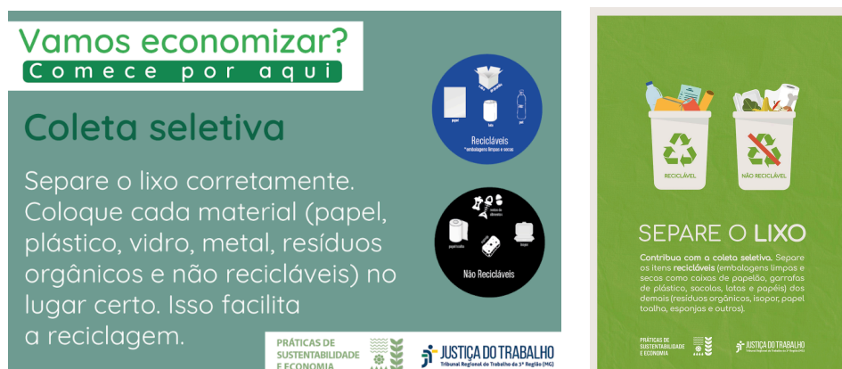
Figura 7 - Cartazes informativos sobre separação de resíduos

Além disso, são divulgados cartazes informativos abordando questões ambientais, incluindo separação de resíduos, economia de recursos e hábitos sustentáveis, com o objetivo de reforçar continuamente as orientações e boas práticas junto aos servidores e colaboradores.