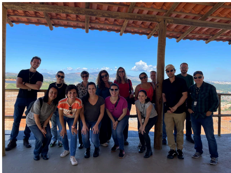
Figura 6 - Foto da primeira visita do TRT-MG à CTR Macaúbas

Além disso, são divulgados cartazes informativos abordando questões ambientais, incluindo separação de resíduos, economia de recursos e hábitos sustentáveis, com o objetivo de reforçar continuamente as orientações e boas práticas junto aos servidores e colaboradores.