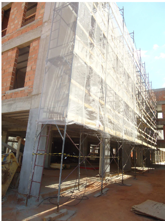
ANDAIMES E TELA DATA: OUTUBRO/2016