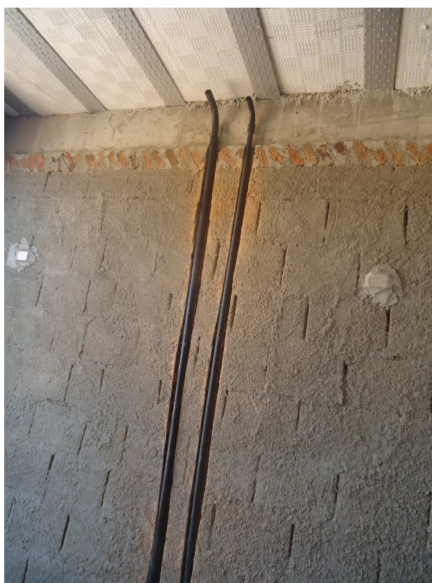
ELETRODUTOS DATA: OUTUBRO/2016