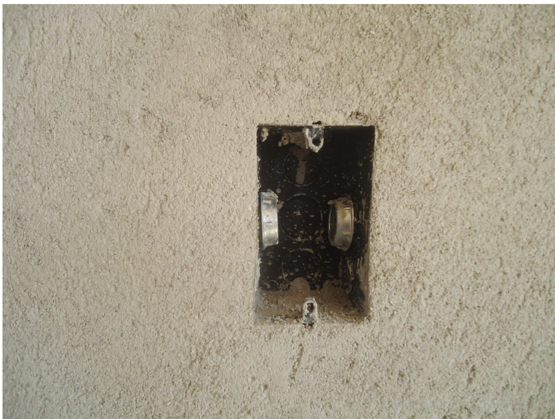
CAIXA PVC DATA: OUTUBRO/2016