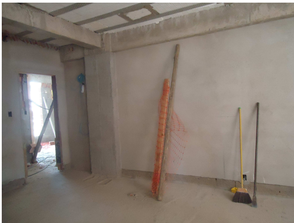
EMBOÇO INTERNO DATA: OUTUBRO/2016