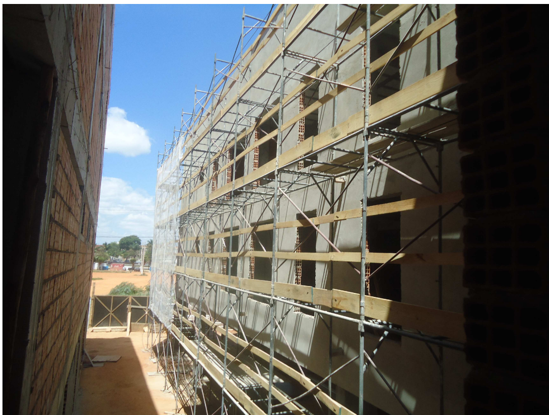
EMBOÇO EXTERNO DATA: OUTUBRO/2016