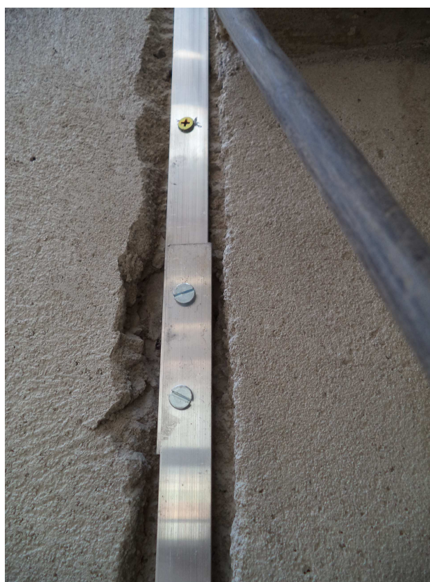
MALHA SPDA (EMBUTIDO REVESTIMENTO EXTERNO) DATA: OUTUBRO/2016