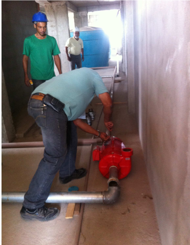
ELETROBOMBA DATA: OUTUBRO/2016