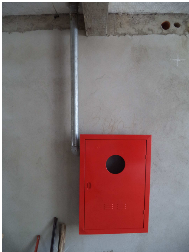
ABRIGO PARA HIDRANTE DATA: OUTUBRO/2016