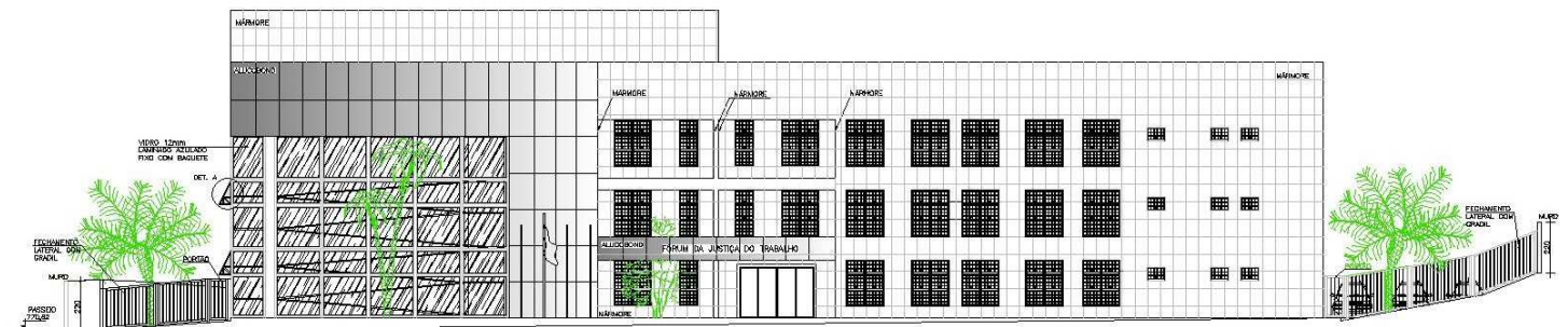
Fachada Principal Alameda Ismael Martins