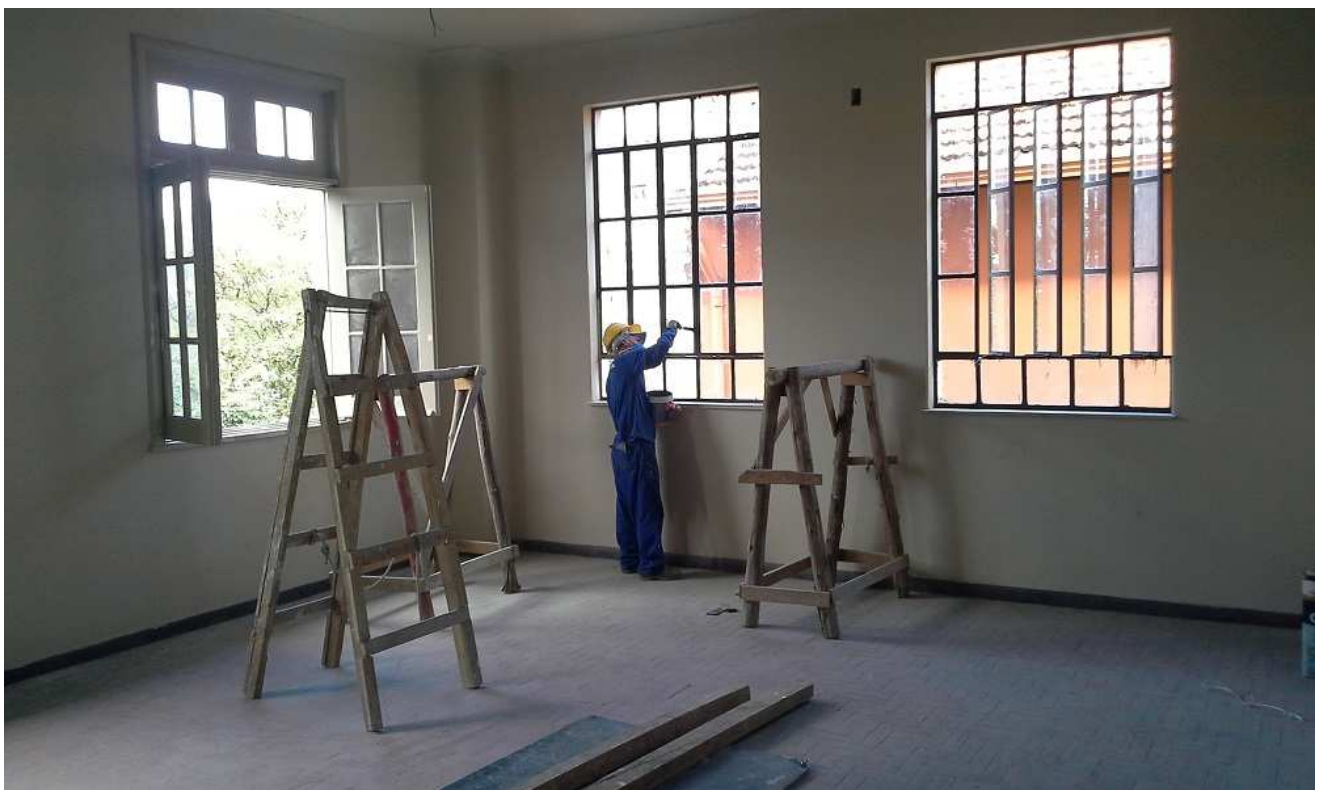
6. Pintura – Esquadrias de ferro - Edifício Mário Werneck