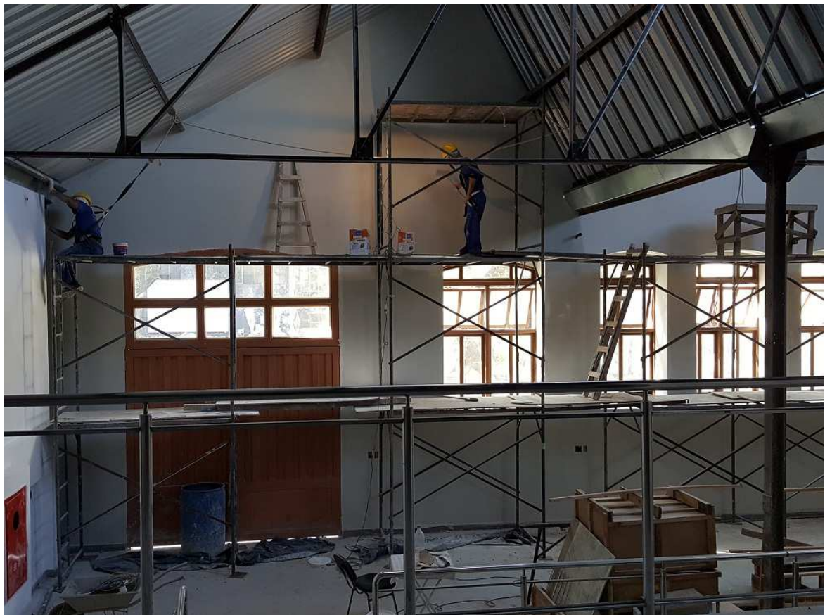
8. Pintura – Paredes e esquadrias de madeira - Piso 2 da Oficina Christiano Ottoni