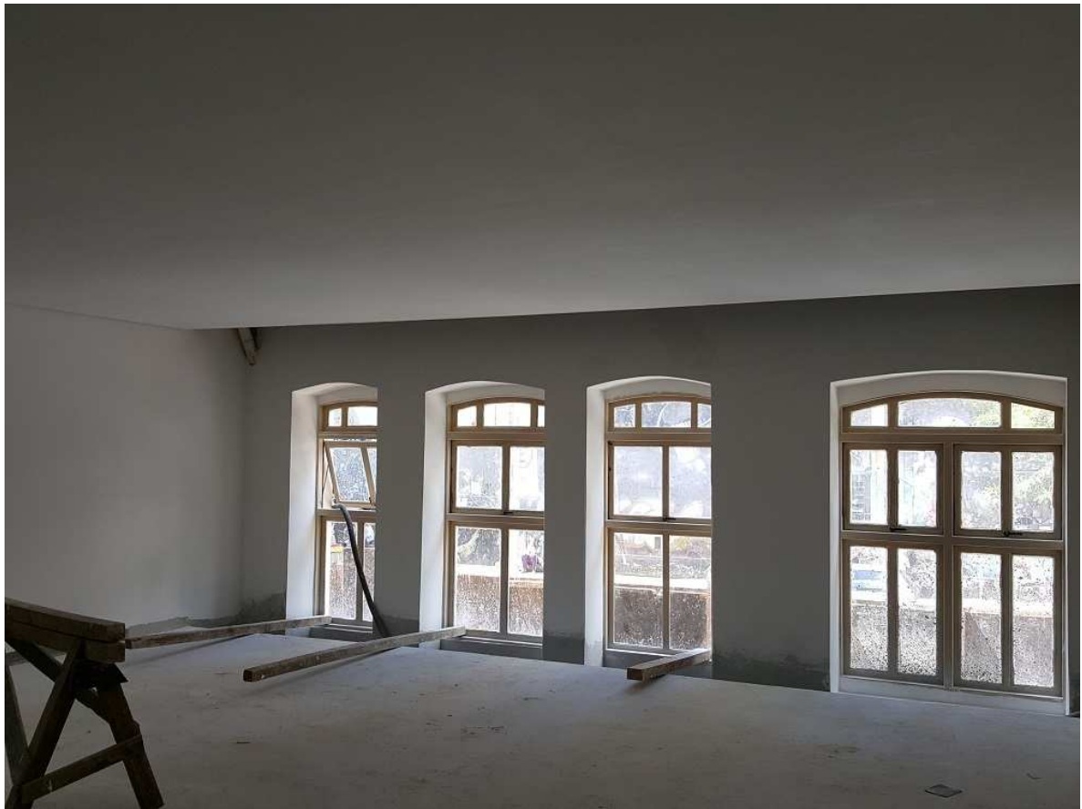
7. Pintura – Paredes, forro e esquadrias de madeira – Piso 3 da Oficina Christiano Ottoni