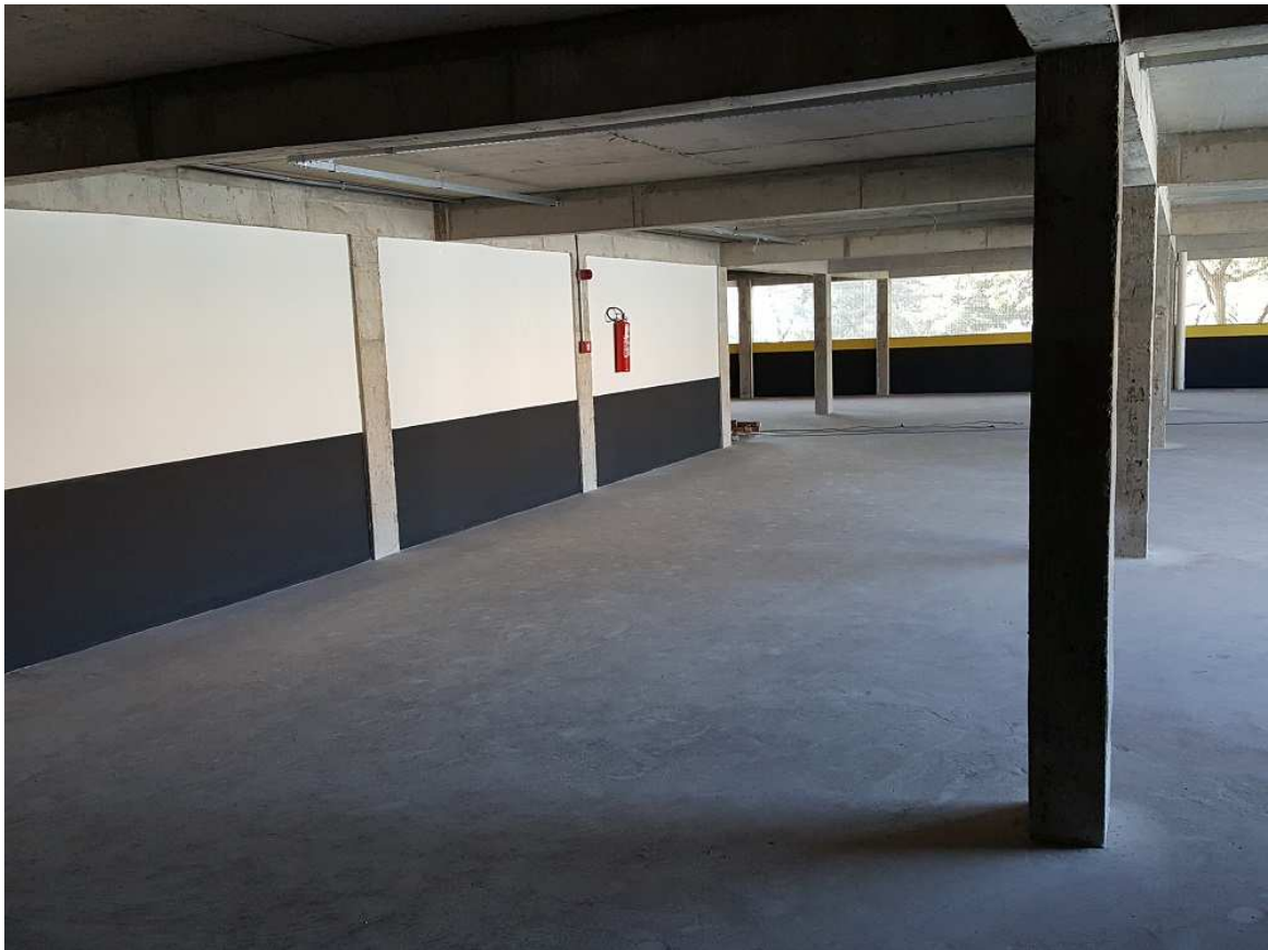
9. Pintura interna – estacionamento