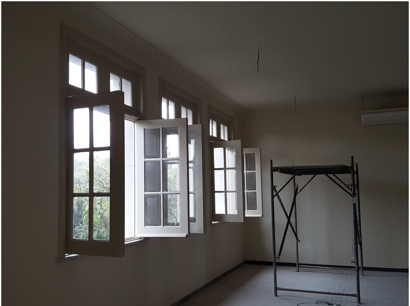
5. Pintura – Esquadrias de madeira - Edifício Mário Werneck