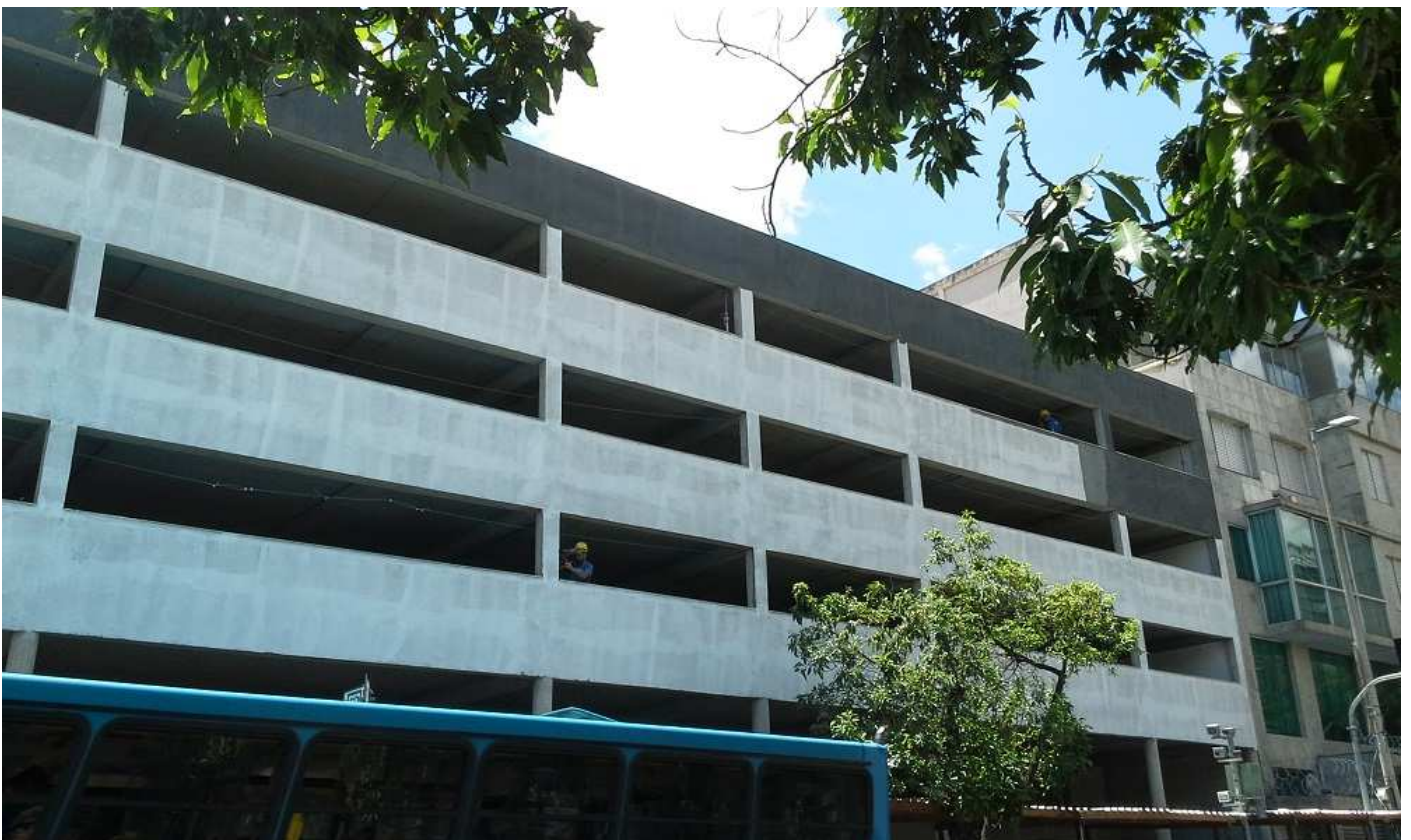
2. Pintura externa – Fachada rua Espírito Santo