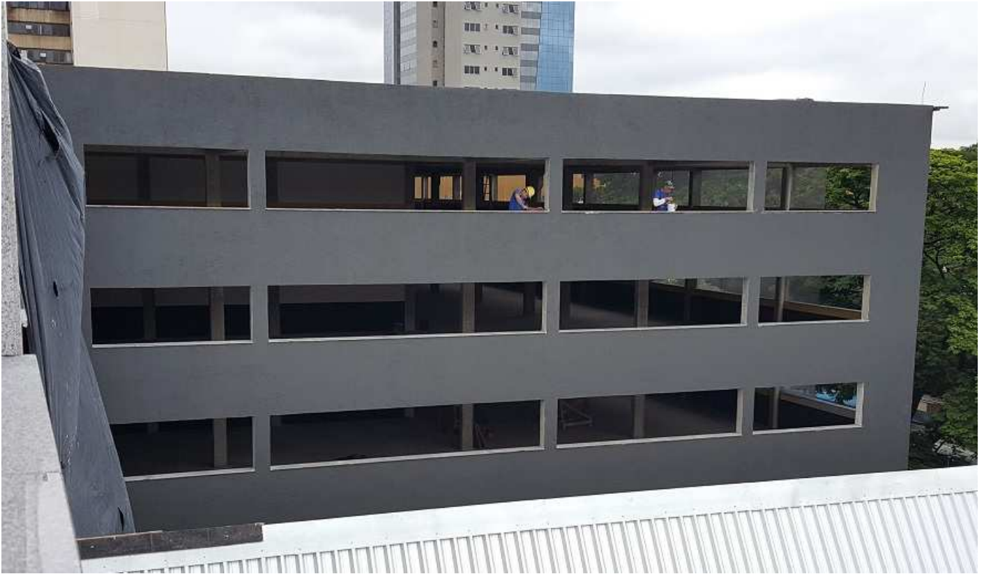
1. Pintura externa – Fachada lateral esquerda estacionamento