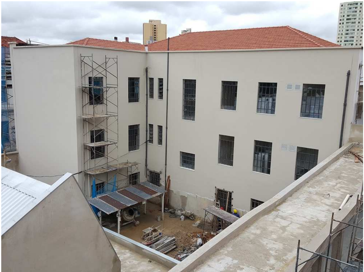
3. Pintura externa – Fachada lateral Edifício Mário Werneck