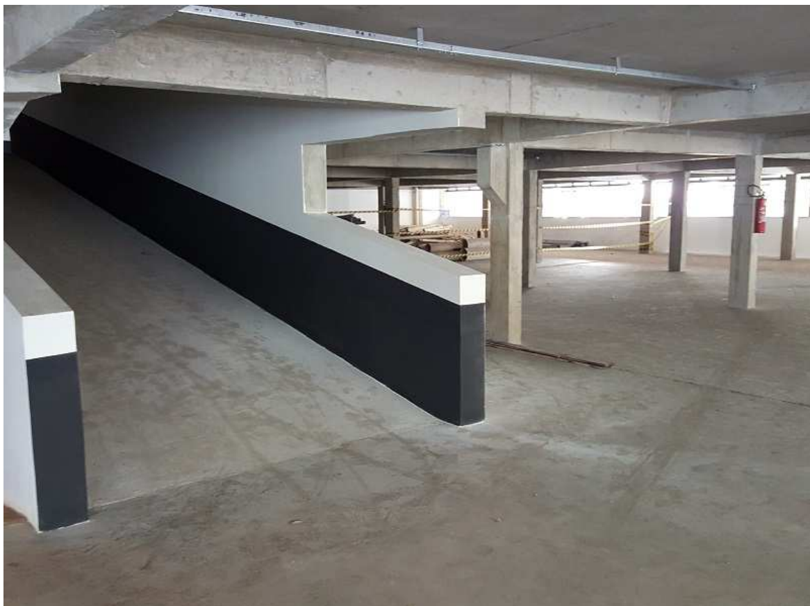
10. Pintura interna – rampa do estacionamento