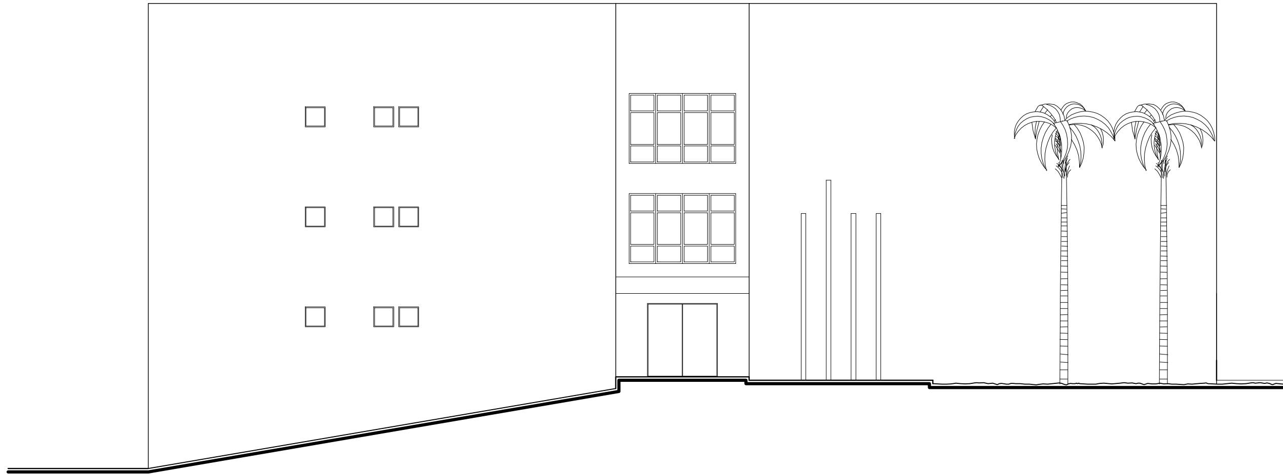
FACHADA RUA ANTÔNIO JOSÉ DOS SANTOS ESC. 1:100