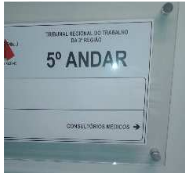
Item 9 - Porta-cartazes de duas superfícies planas