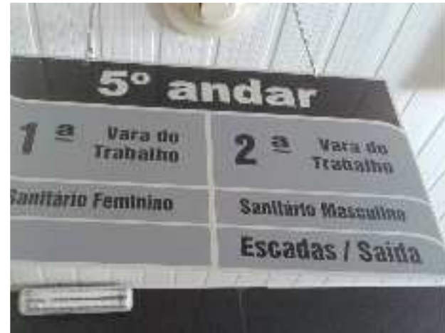
Item 2 - Placas em alumínio escovado