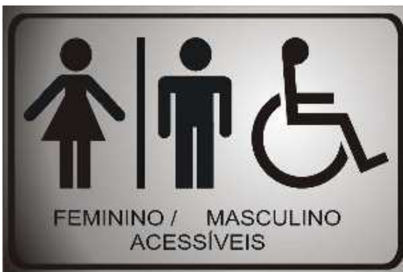
Item 3 - Placas em aço escovado