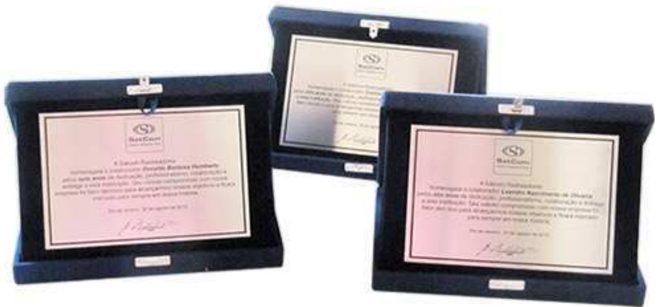
Item 6 - Placas destinadas a homenagens, em aço escovado