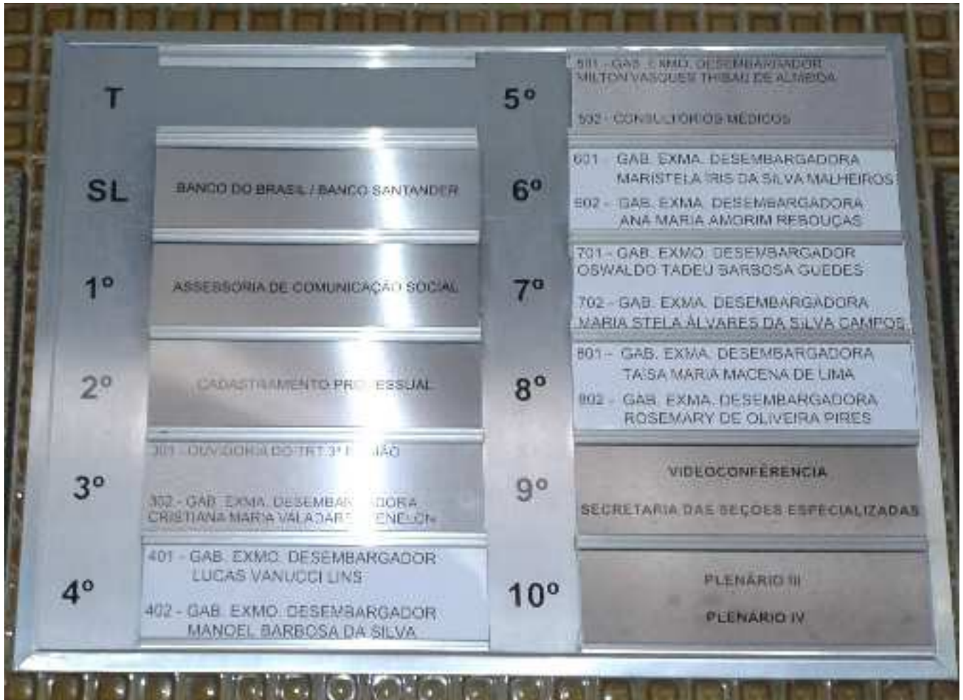
Item 8 - Painéis em alumínio escovado ou aço escovado para encaixe de placas do tipo 2 ou 3.