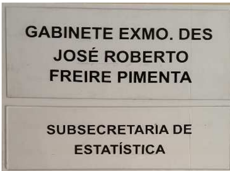
Item 1 - Placas em acrílico cristal transparente

Faz-se necessário observar os modelos existentes neste Regional para que seja possível a continuidade da sinalização visual já padronizada nas unidades deste TRT. As dimensões dos bens solicitados serão indicadas pelo CONTRATANTE. Para os bens que requerem a impressão de textos, o CONTRATANTE deverá indicar a fonte e seu tamanho, o uso eventual de estilos (negrito, itálico, sublinhado), o uso do maiúsculo / minúsculo, o alinhamento, o espaçamento, e outros eventuais atributos inerentes à formatação textual que sejam de seu interesse; Os layouts para a confecção das peças serão encaminhado pela Secretaria de Comunicação Visual (SECOM) ou Secretaria de Engenharia (SENG), sob demanda, de forma parcelada, durante o período de vigência do contrato. As imagens abaixo são meramente exemplificativas e ilustrativas, apenas para melhor entendimento dos itens licitados, contendo um rol não taxativo.