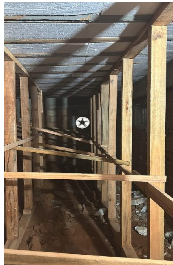
Ambiente já contemplando a instalação de escoramento provisório para estabilização estrutural.