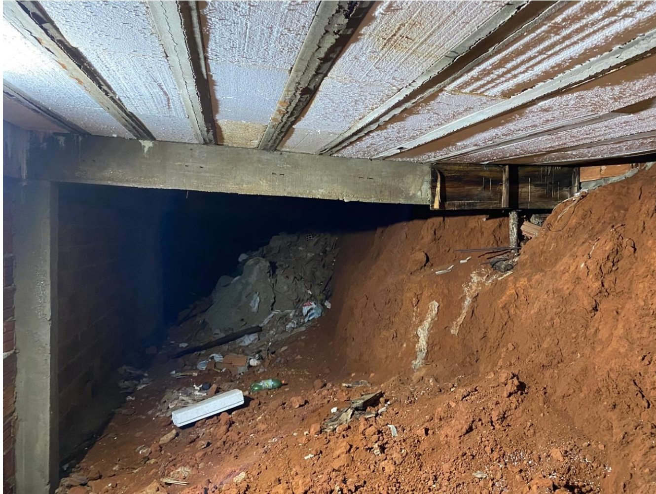
Trecho interno da estrutura – situação anterior à instalação do escoramento