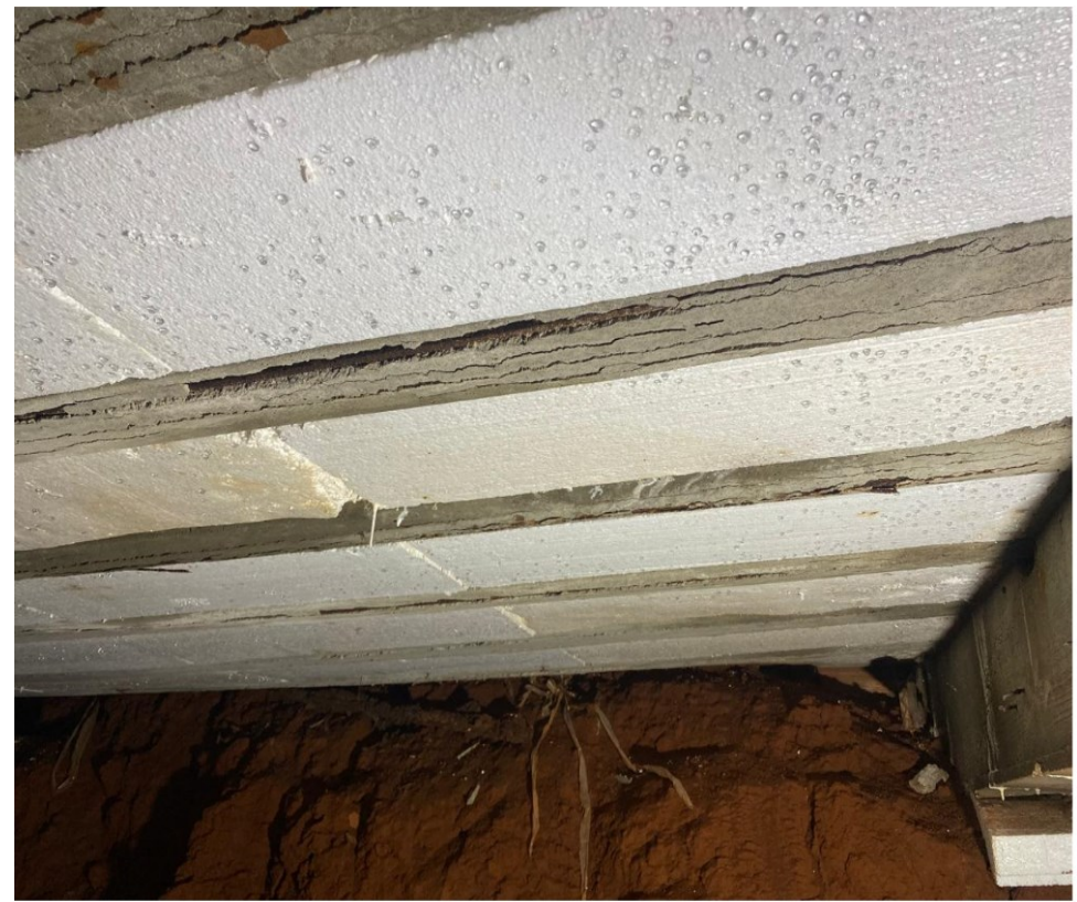
Presença de manifestações patológicas e inconformidades estruturais identificadas no ambiente.