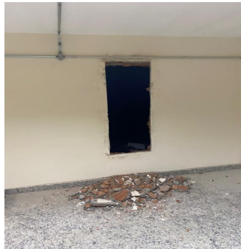
Acesso à área objeto da contratação, realizado por meio da abertura indicada. Atualmente existe uma porta instalada no local