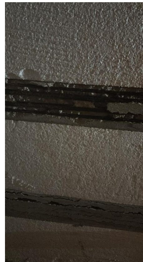
Presença de manifestações patológicas e inconformidades estruturais identificadas no ambiente.