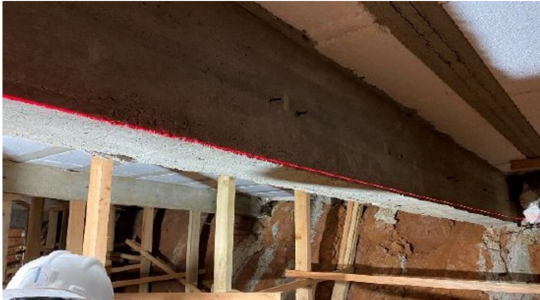
Verificação de flechas nas lajes para avaliação de deformações estruturais.