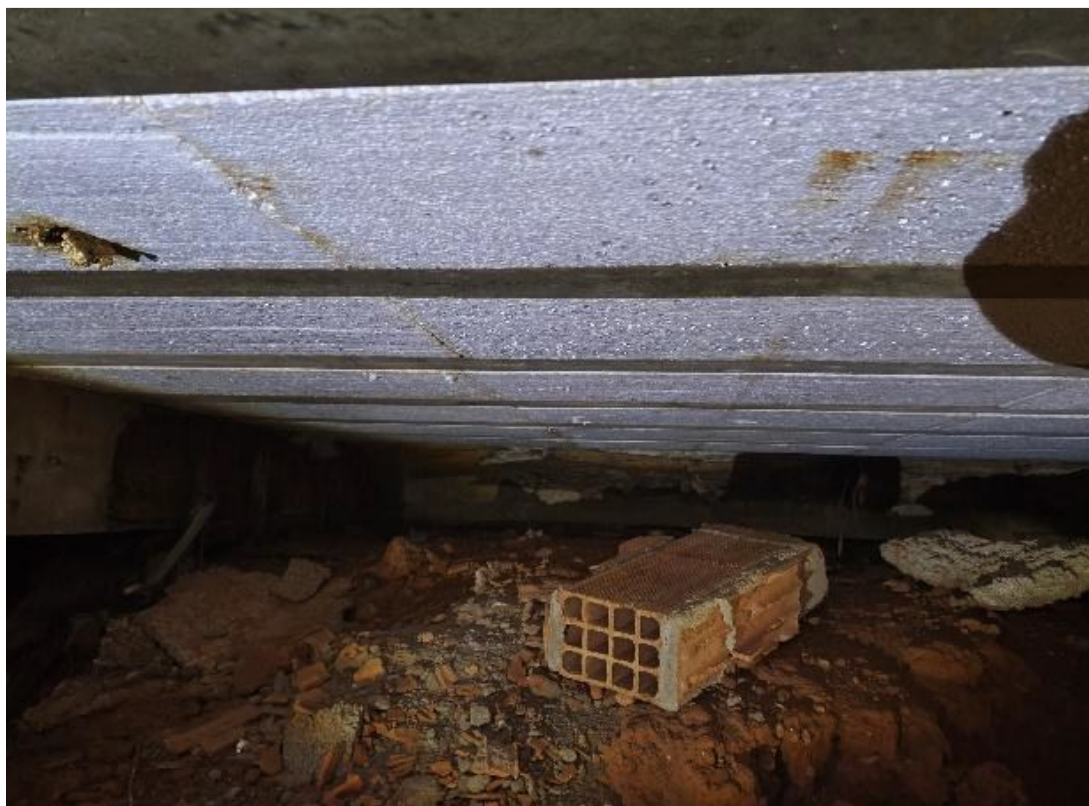
Presença de manifestações patológicas e inconformidades estruturais identificadas no ambiente.