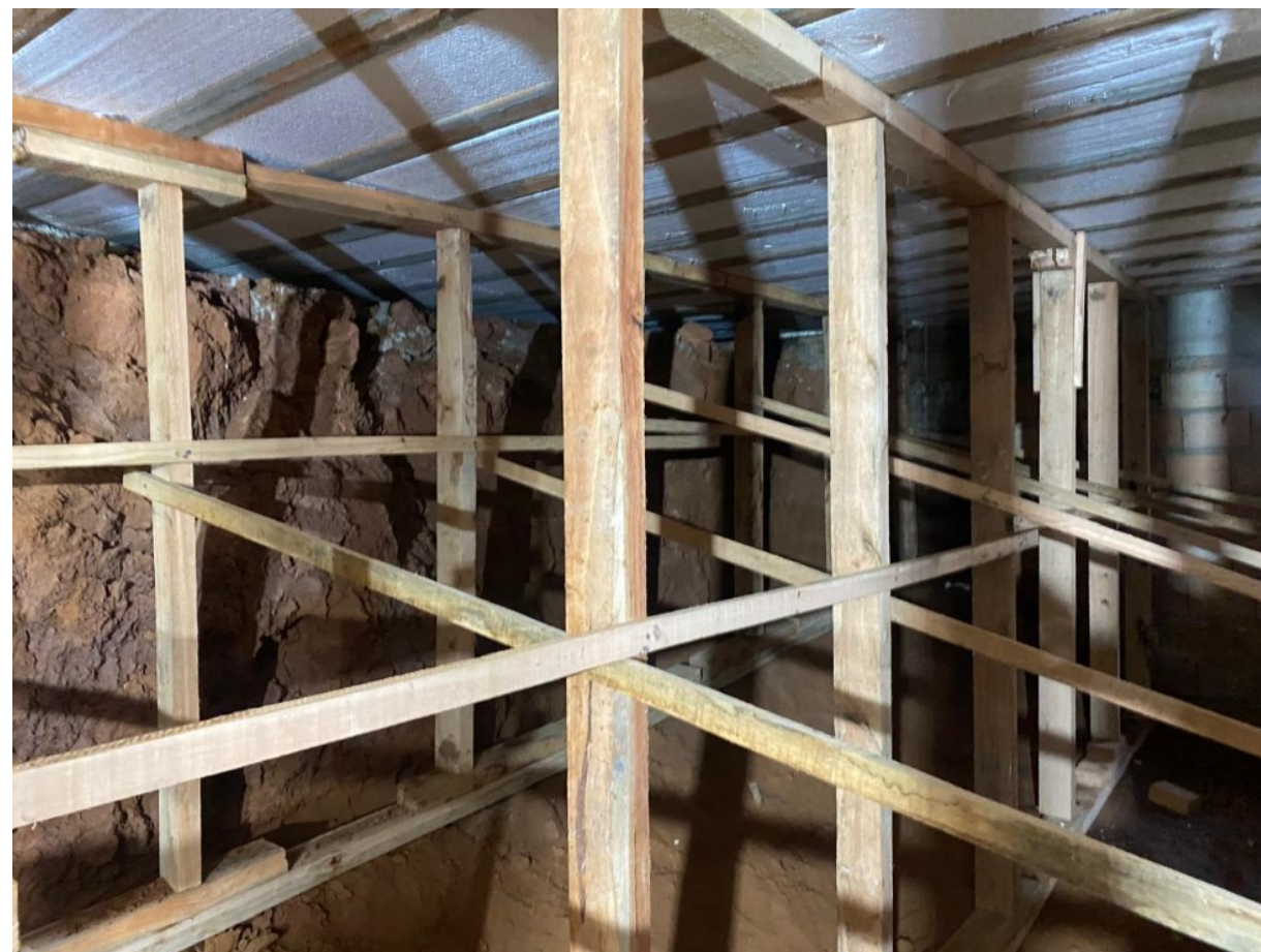
Vista geral do ambiente com sistema de escoramento provisório instalado.