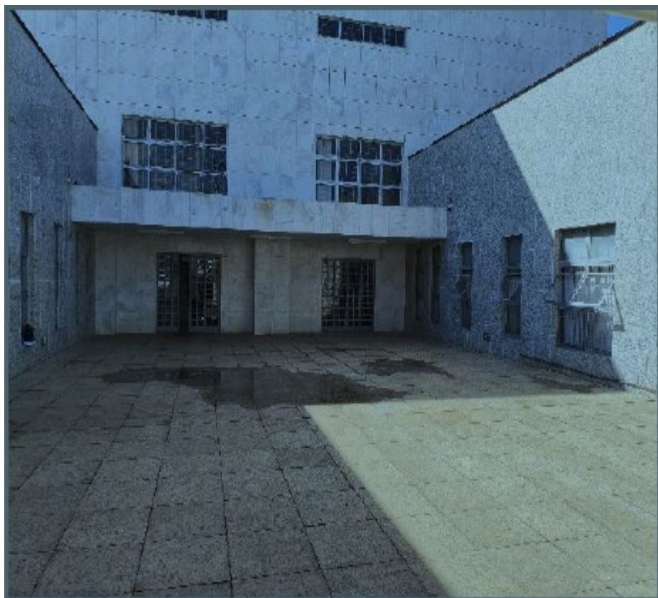
Entrada principal do Fórum – trecho sob o qual se localiza parcialmente a área objeto da contratação.