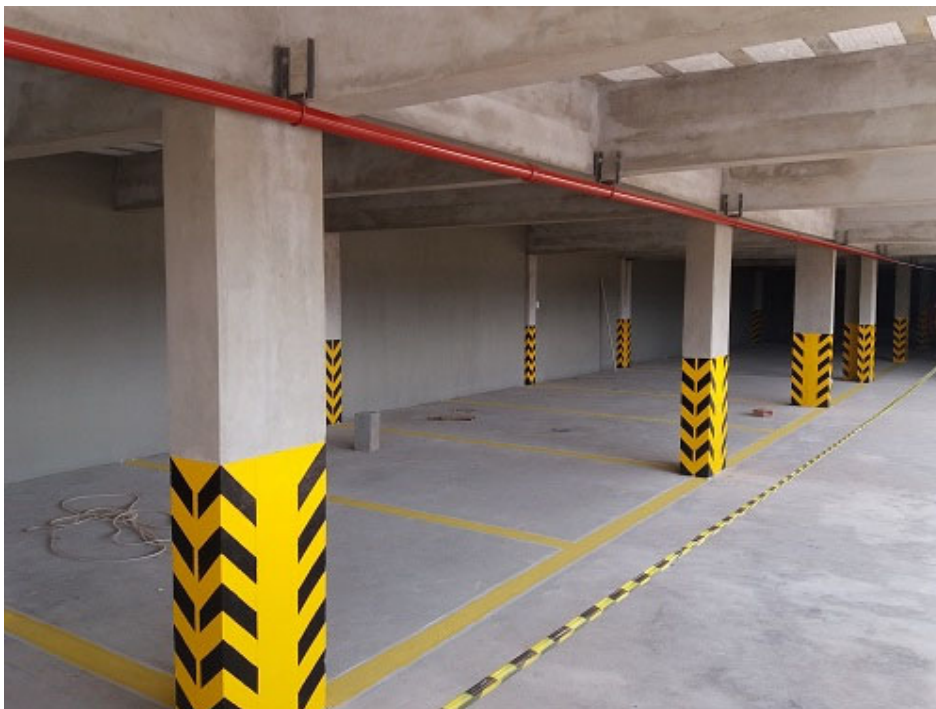
Instalações de prevenção e combate a incêndio, pintura, pavimentação.