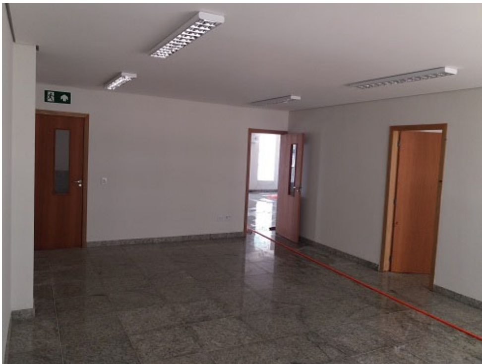
Elétrica e SPDA, cabeamento estruturado, limpeza de obra, esquadrias, forro, rodapés e pintura.