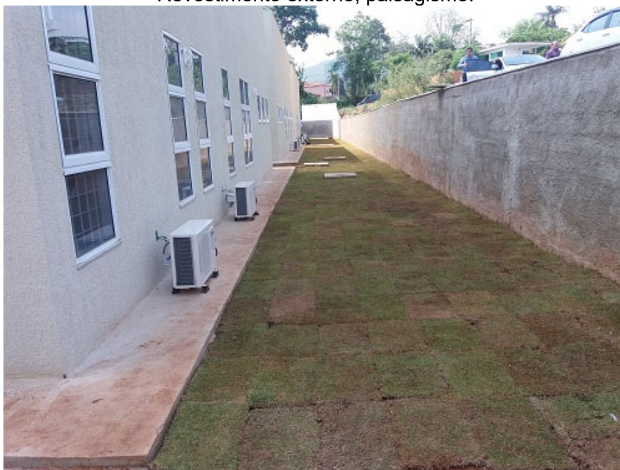
Esquadrias, vidros, equipamentos e acessórios, revestimento externo, paisagismo.