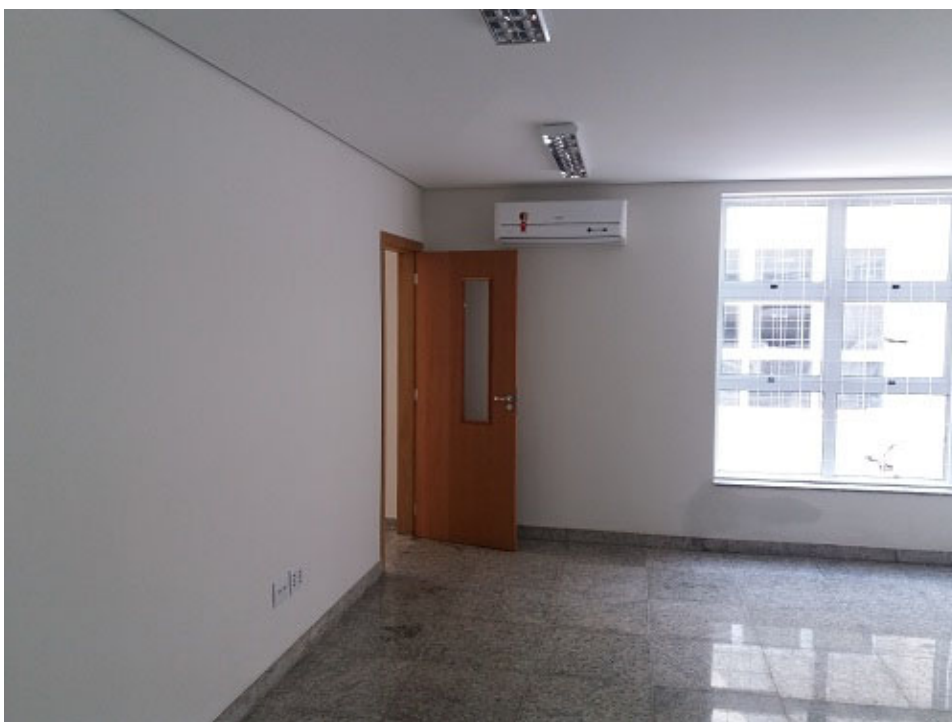
Elétrica e SPDA, cabeamento estruturado, limpeza de obra, esquadrias, equipamentos e acessórios, forro, rodapés e pintura.