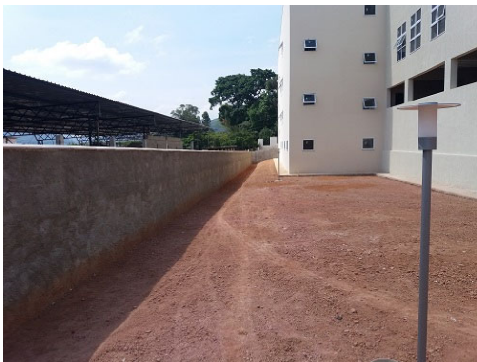
Vista parcial, afastamento lateral direito