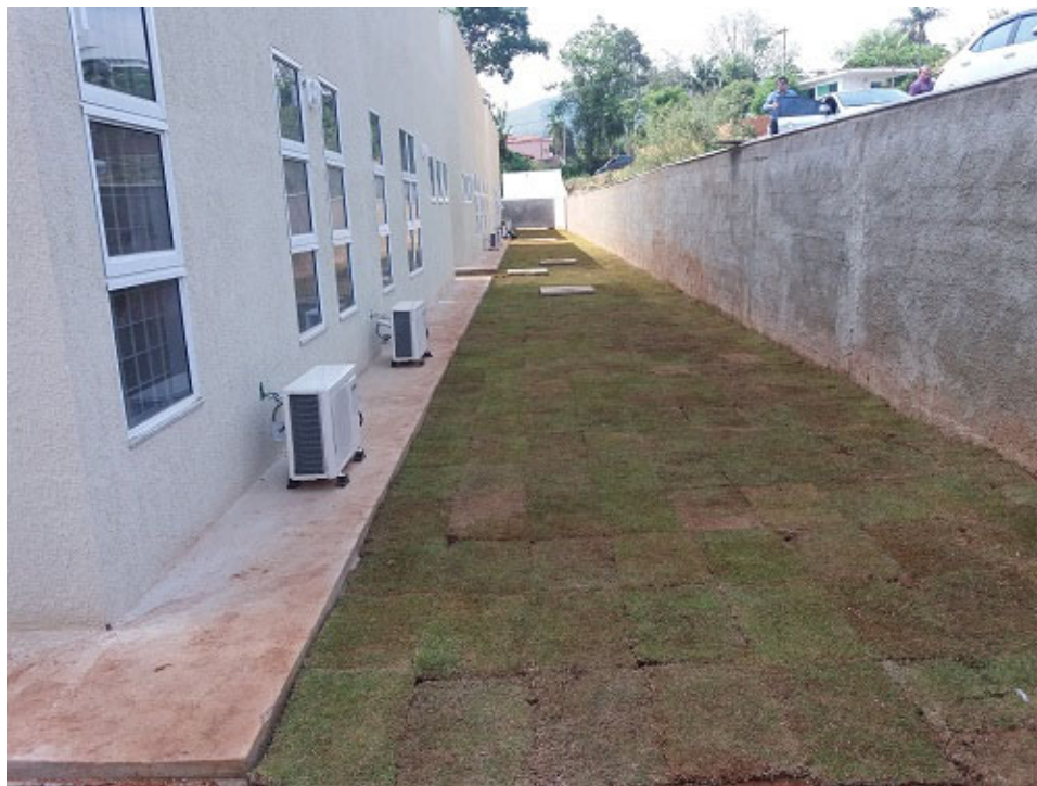
Vista parcial, afastamento lateral esquerdo