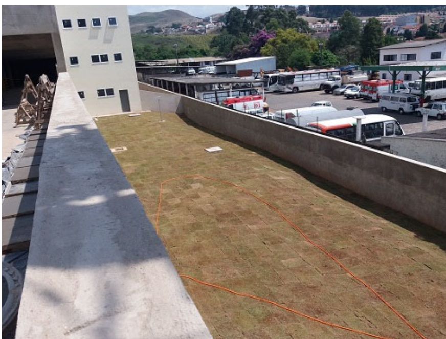
Revestimento externo, paisagismo.

Cadastramento fotográfico em 24/10/2017.