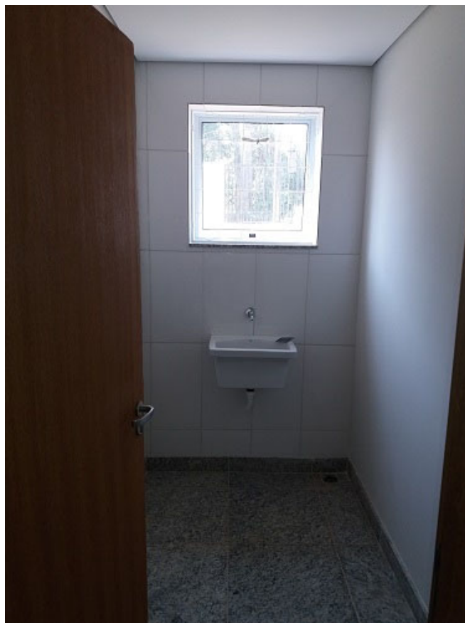
Vidros e espelhos, instalações hidráulicas, esquadrias, pavimentação, rodapés.