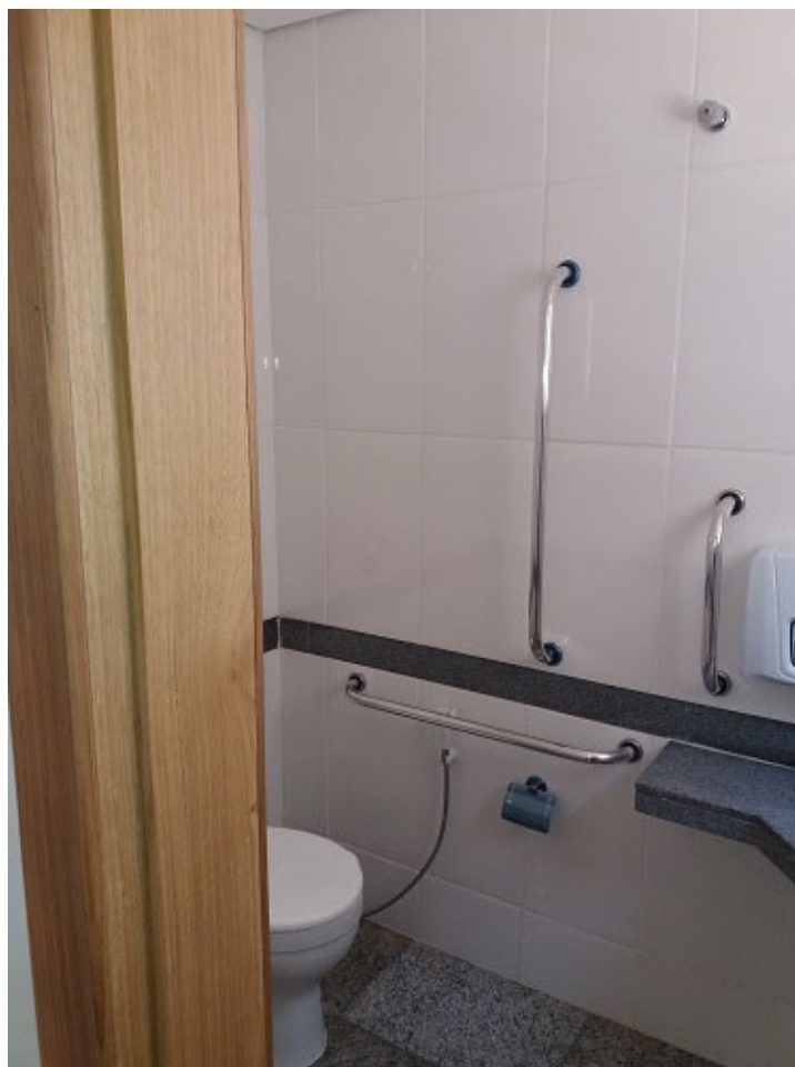
Instalações hidráulicas e sanitárias.