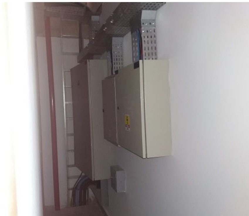
Elétrica e SPDA.