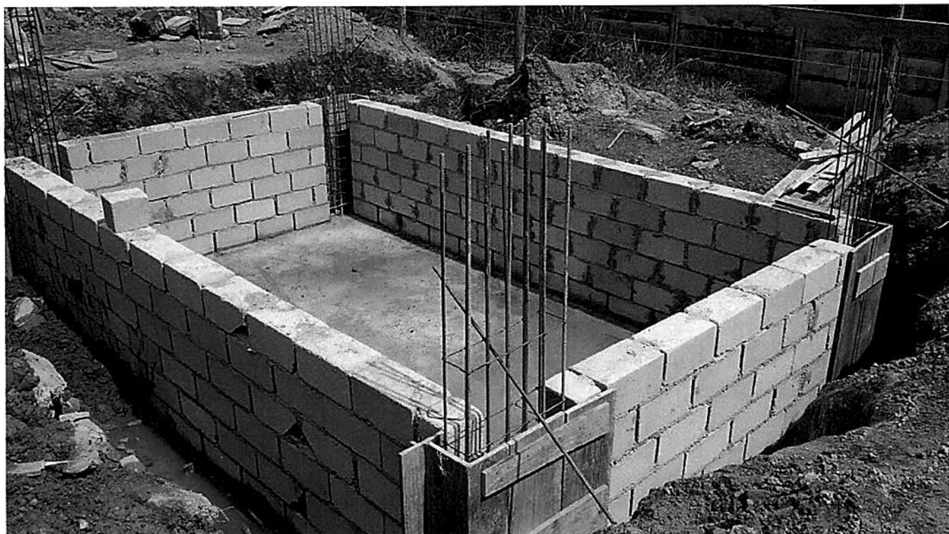
POÇO do Elevador