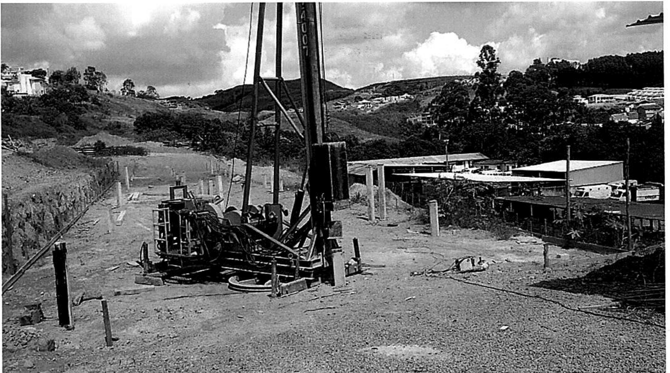
CRANCAO DE ESTACAS PLANO 1