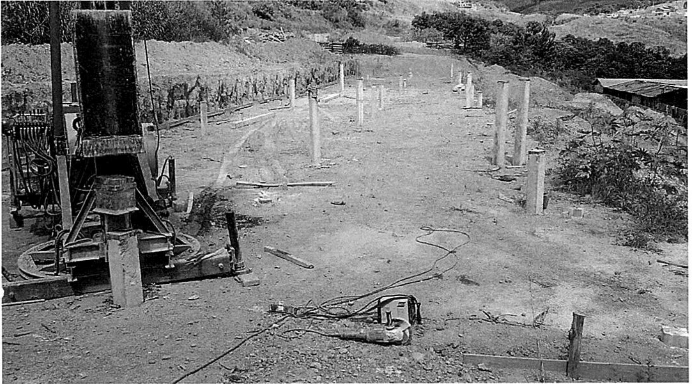
CRANÇÃO DAS ESTACAS PLÔTÔ 1