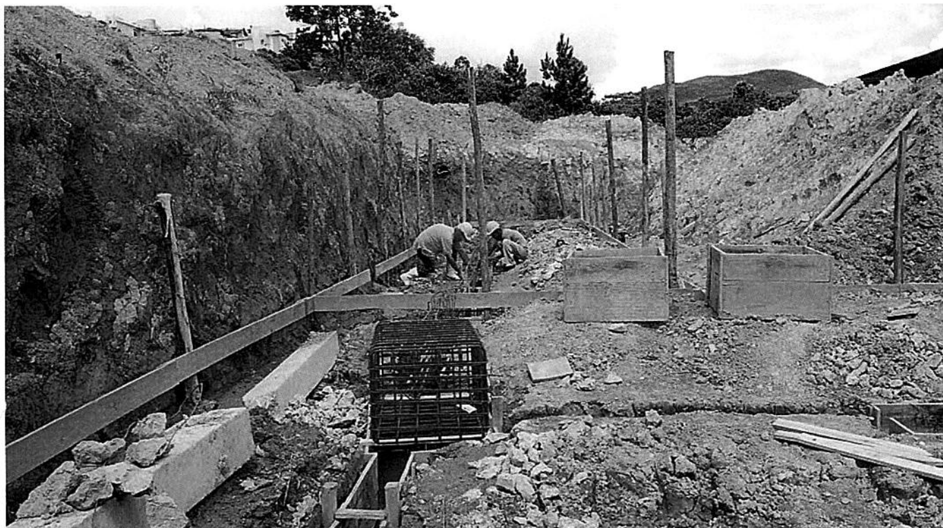
ARMAÇÃO dos blocos e GABARITO