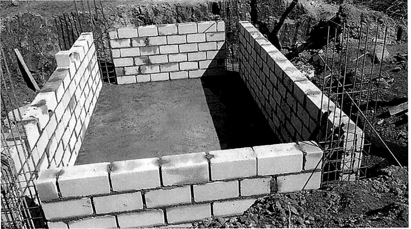
ALVENARIA POÇO DO ELEVADOR