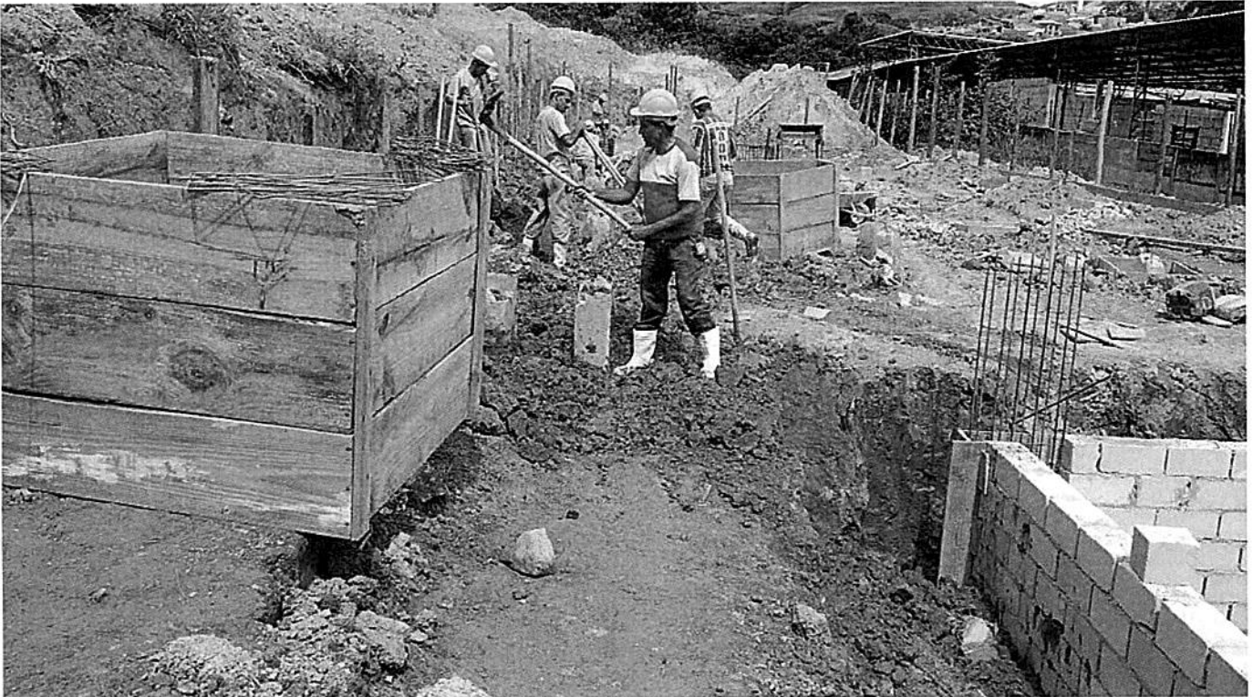
Forma dos blocos e cintas