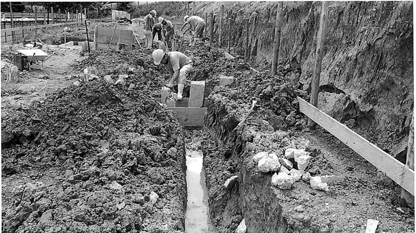
ABERTURA DO CANTO-TO