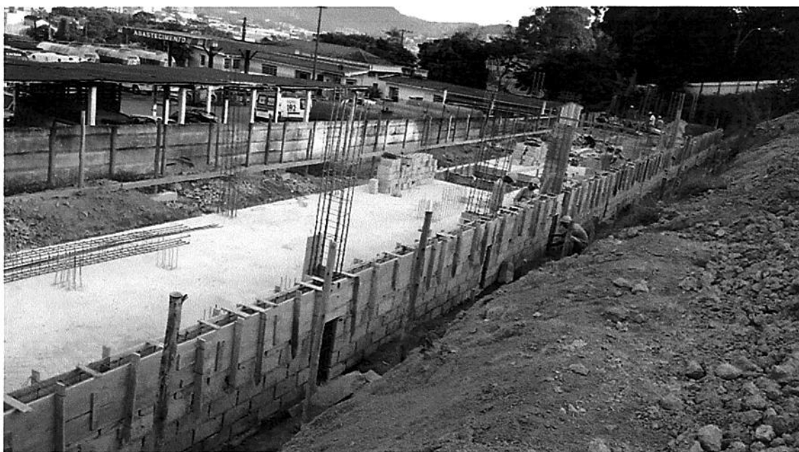
FORMA E ARMADURA ARRIMO