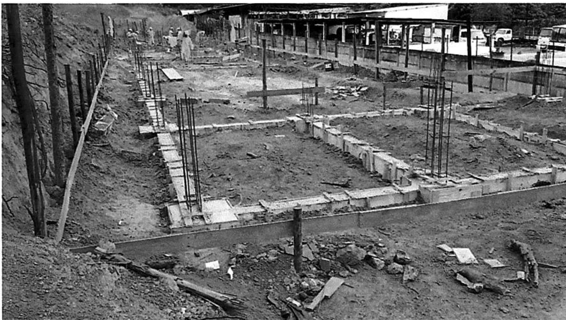
CONCRETAGEM CINTAS E BLOCOS