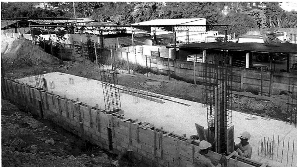
FORMA E ARMADURA ARRIMO