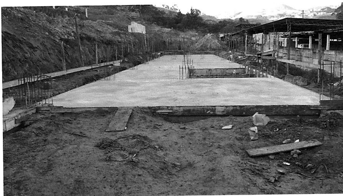
FUNDAÇÃO ANIMO 6 CONCRETAÇÃO PTSO