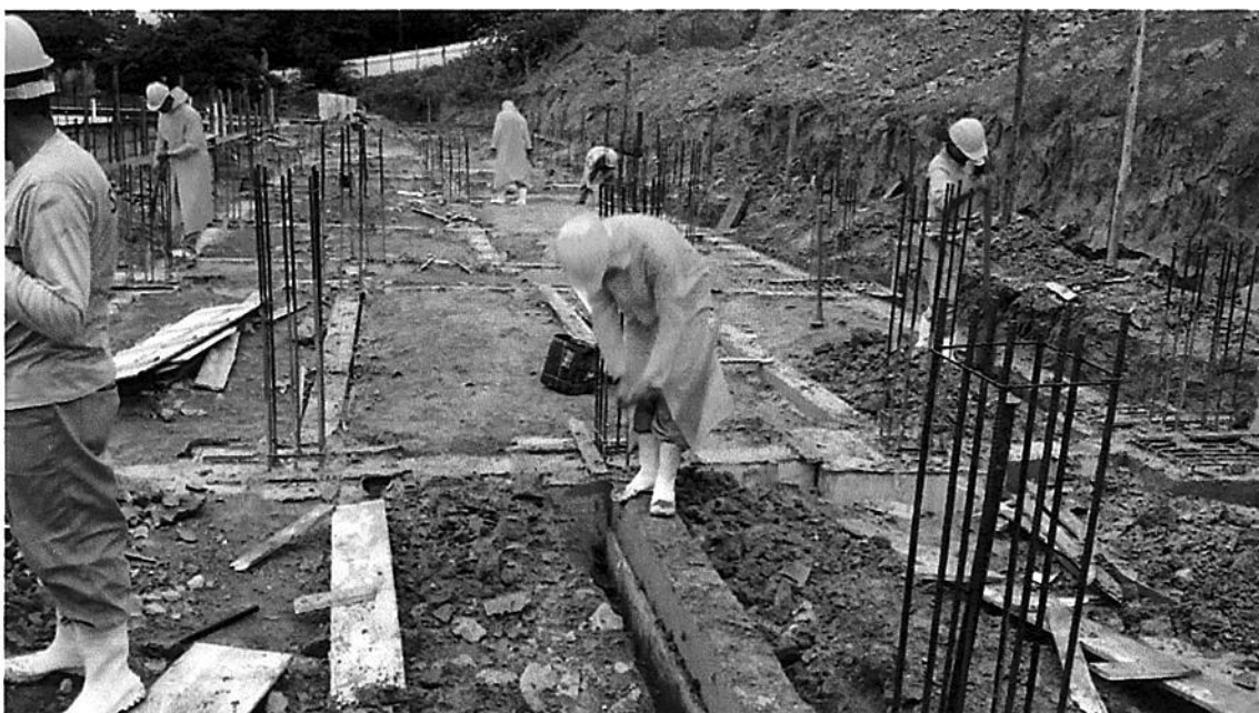
CONCRETAGEM CINTAS E BLOCOS DESFORMA E ADEQUAÇÃO