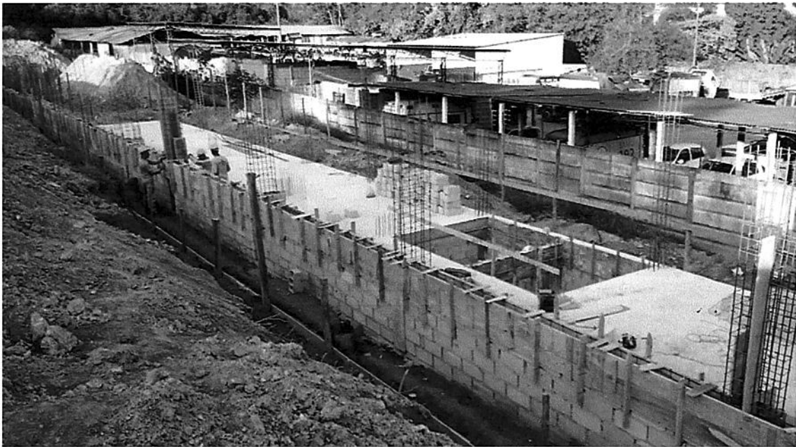
FORMAS CINTAMENTO ANAIMO