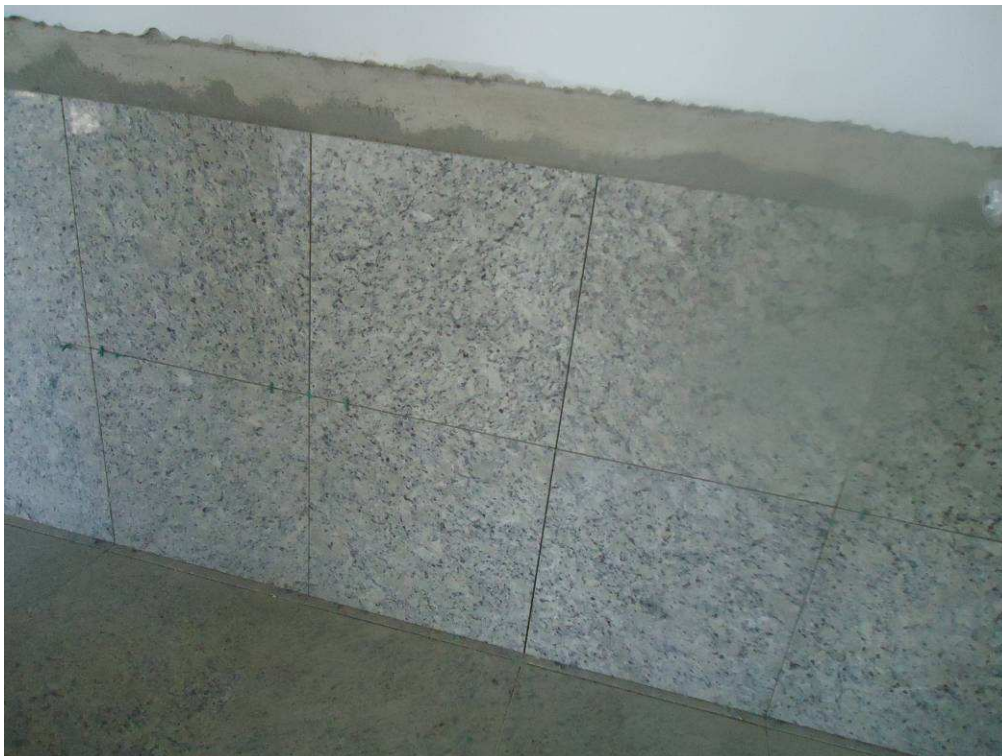
GRANITO HALL ELEVADORES