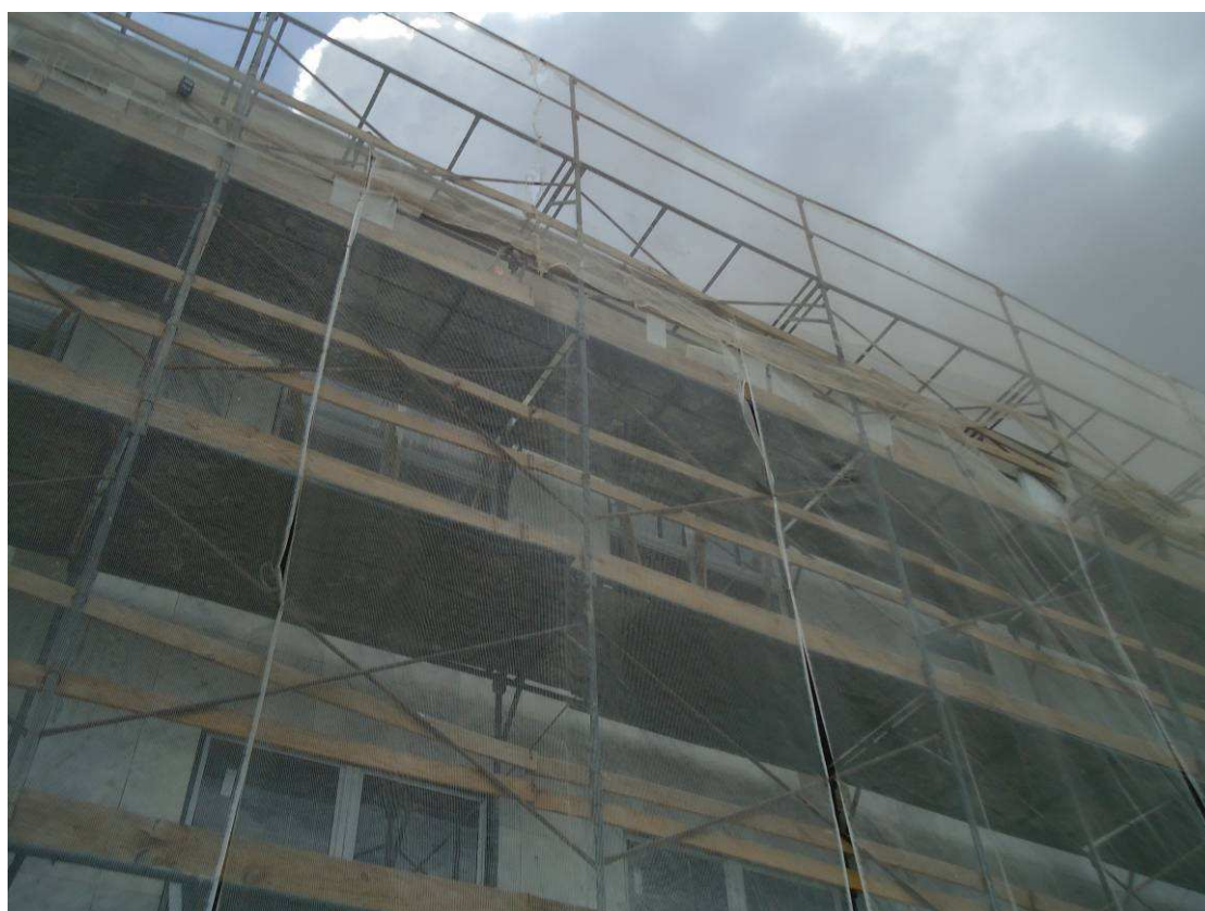
MÁRMORE DATA: ABRIL/2017