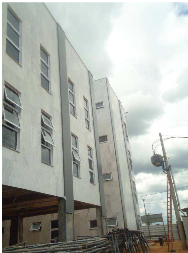
ALUCONBOND, MÁRMORE, JANELAS, PEITORIS DATA: ABRIL/2017