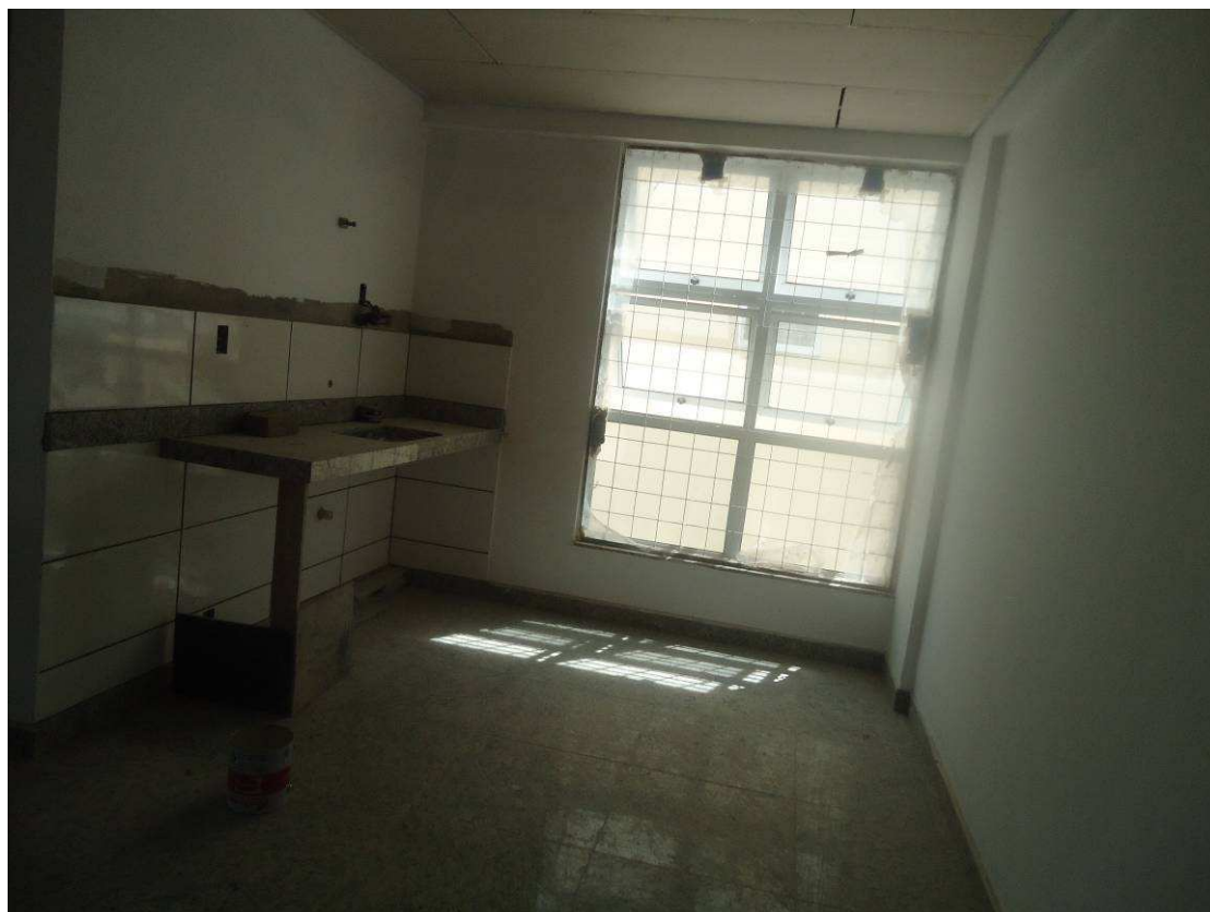
AZULEJOS, FAIXA, PISO GRANITO, RODAPÉ, EMASSAMENTO DATA: ABRIL/2017