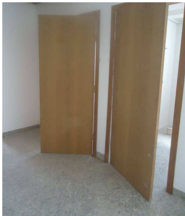
PORTAS, PISO EM GRANITO, RODAPÉ