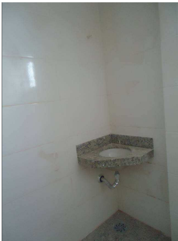
AZULEJOS, CUBA DATA: ABRIL/2017