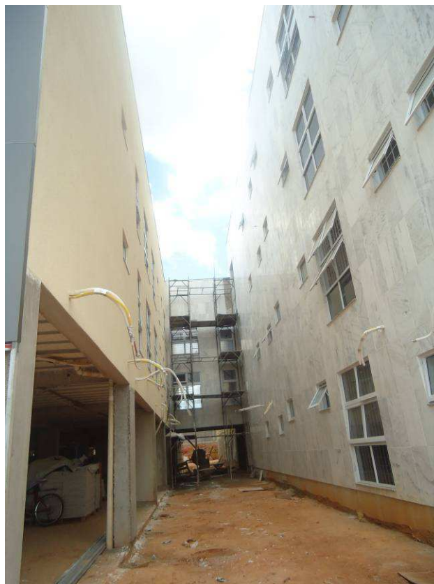
TEXTURA EXTERNA, MÁRMORE, JANELAS, PEITORIS DATA: ABRIL/2017