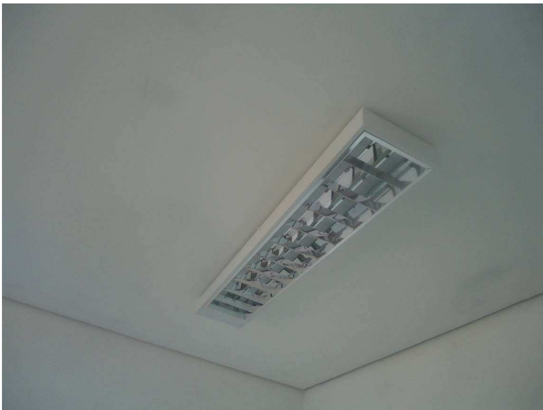
LUMINÁRIAS, PINTURA FORRO DATA: ABRIL/2017