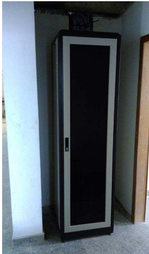
RACK DATA: ABRIL/2017