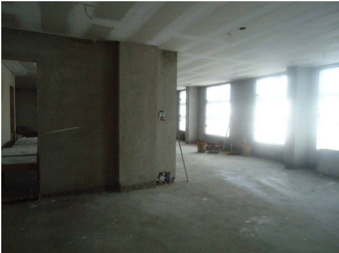
FORRO, CONTRAPISO DATA: ABRIL/2017