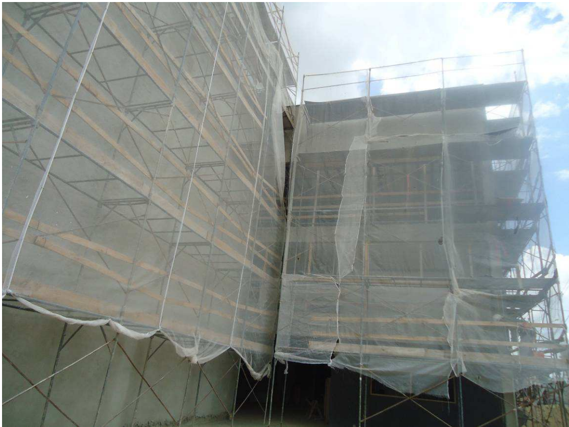
REBOCO EXTERNO DATA: ABRIL/2017