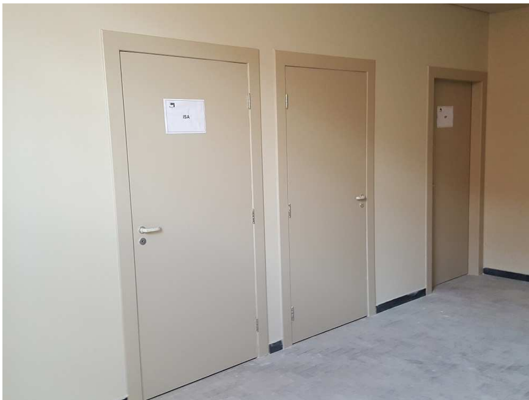
1. Esquadrias - Portas dos sanitários - P4 e P4a - Ed. Mário Werneck