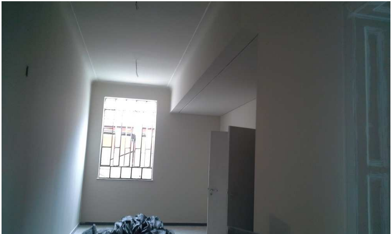
3 . Revestimento de teto - 3º pavimento ed. Mário Werneck