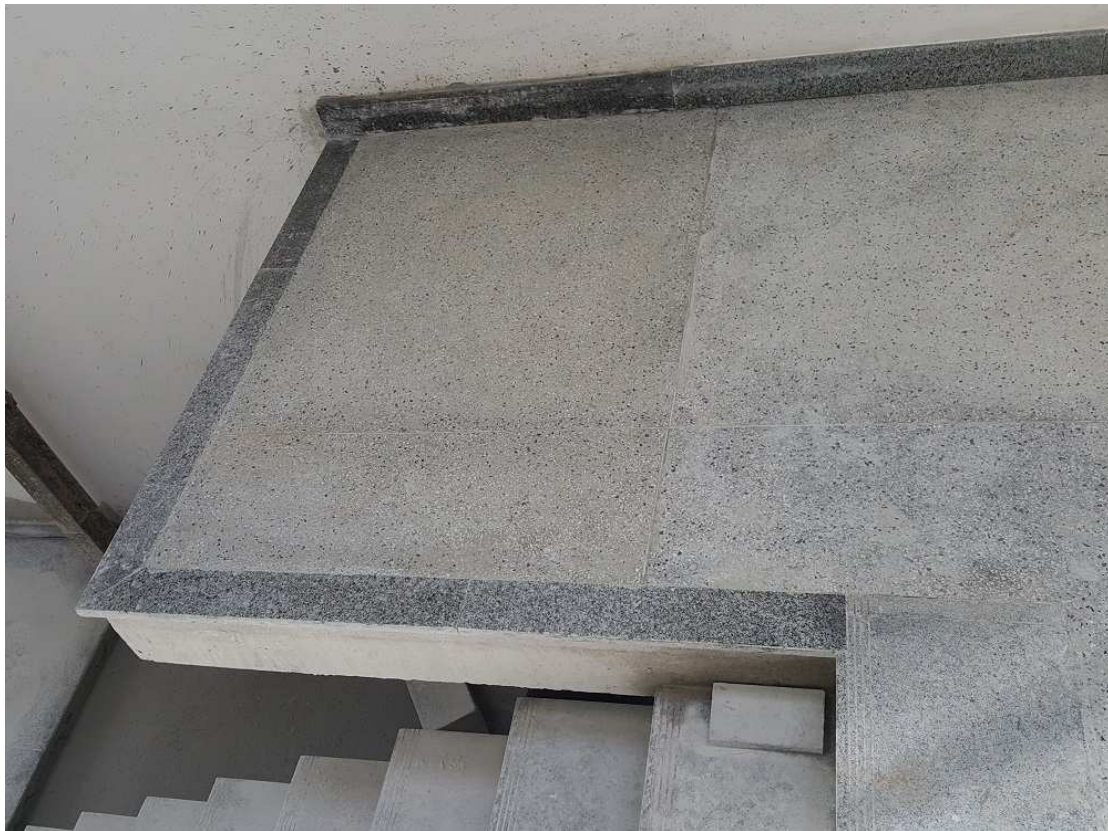
6. Pavimentação - Piso 3 - Ed. Christiano ottoni - Piso em granilite, soleira e rodapé em granito polido e piso da escada em granito levigado.