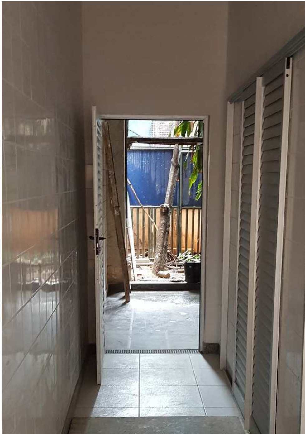
8. Pavimentação - Piso em cerâmica - ARS ed. Mário werneck.