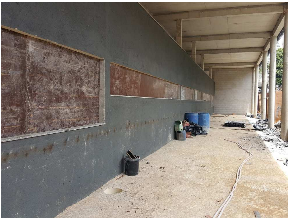
7. Pavimentação - Passeio rua Espírito Santo