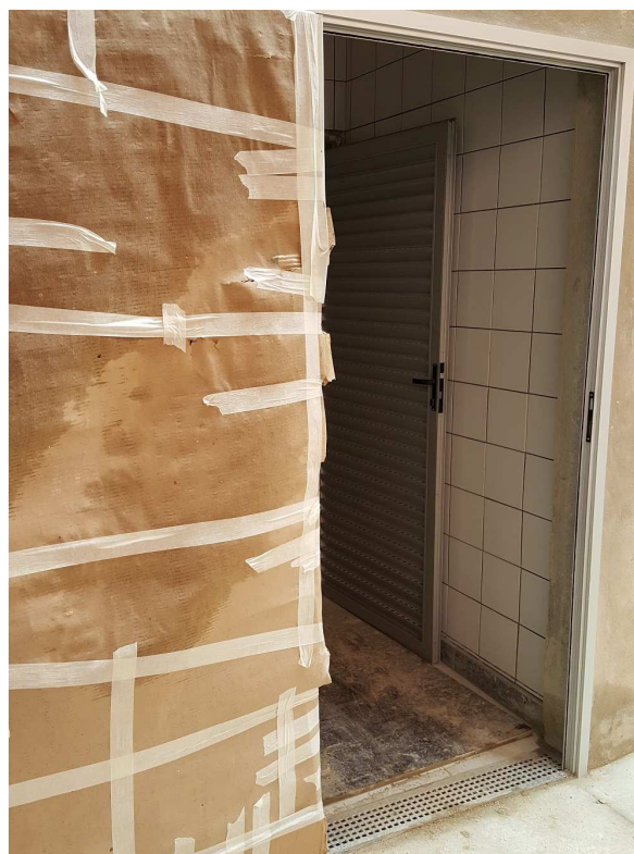
2. Esquadria - Fechadura Vest. Masculino do estacionamento e Porta P4b (veneziana em alumínio) do Bloco 4.