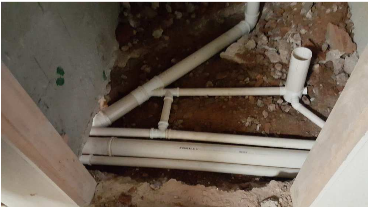
16 - Edifício Mário Werneck - I.S. Acessível (saída de esgoto 1º pavimento).