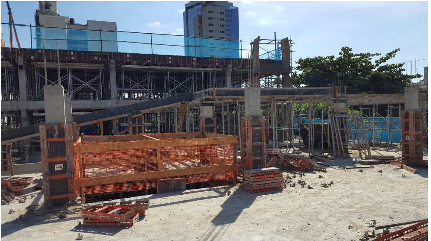
03 - Bloco 2 (pilares do piso 5 e forma da rampa).