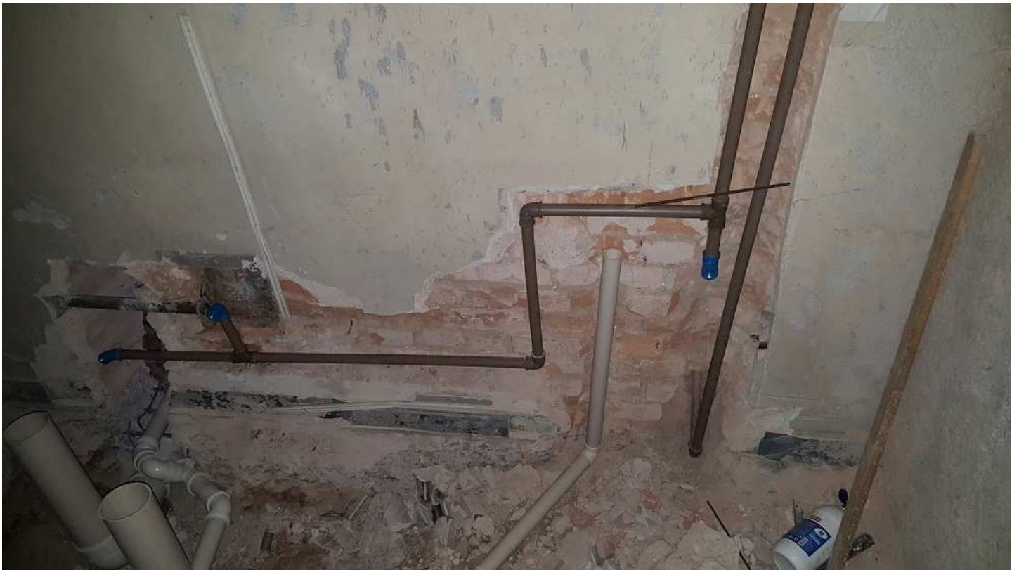
15 - Edifício Mário Werneck - I.S. Diretor (instalações hidrossanitárias).