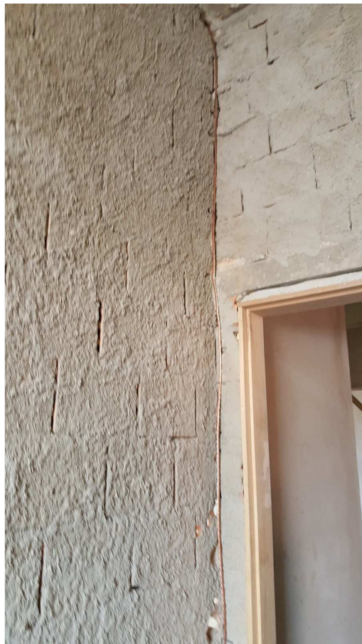
12 - Edifício Mário Werneck (Elétrica/ cabeamento estruturado/ SPDA).