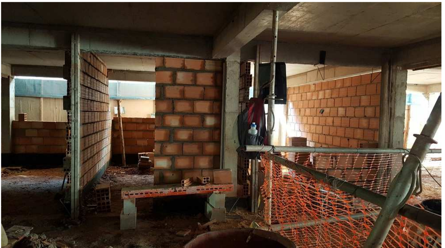
08 - Bloco 2 (alvenaria dos vestiários no 1º pvto)