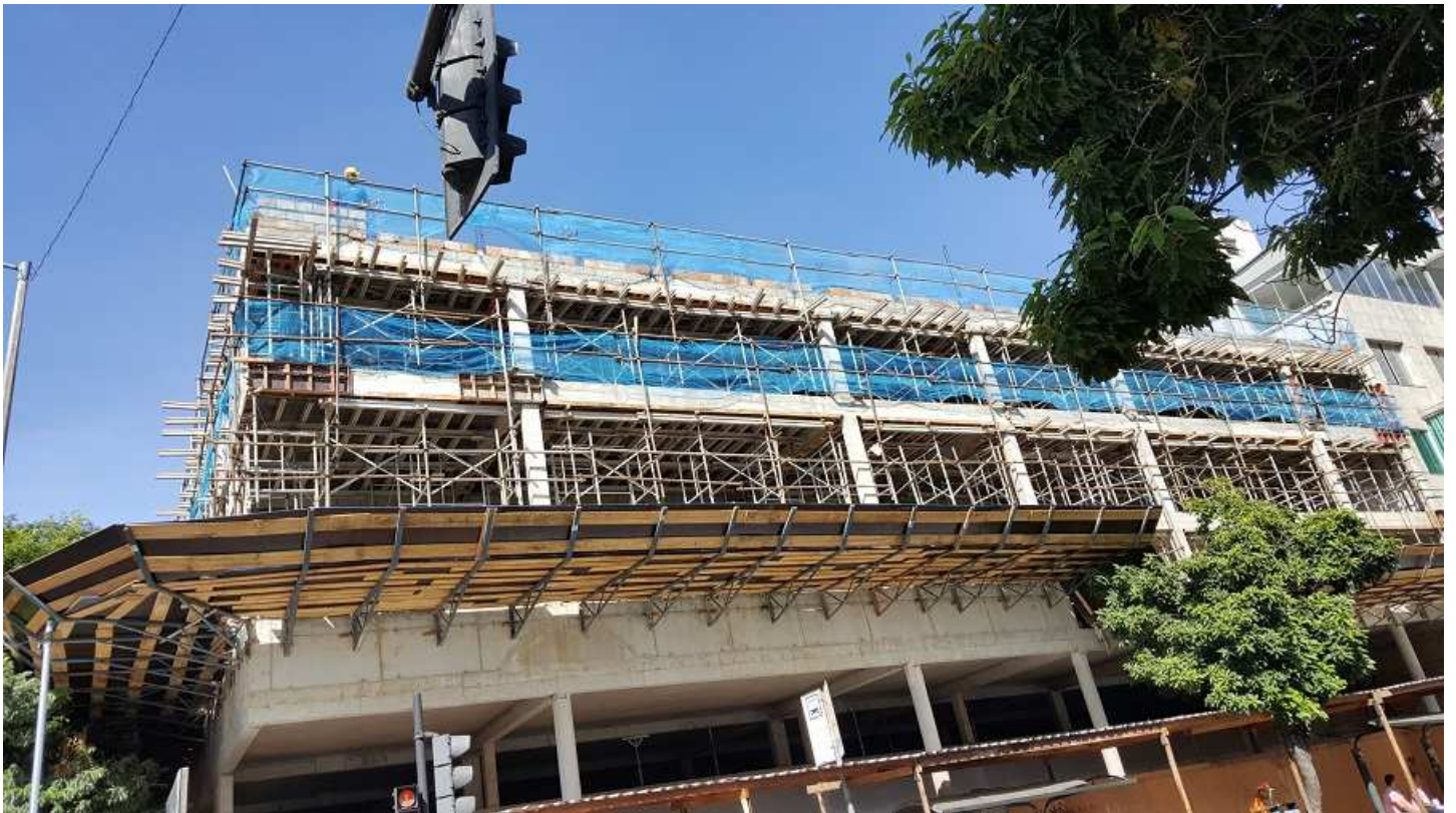
20 - Vista a partir da Rua Espírito Santo (execução de platibanda do Bloco 1).