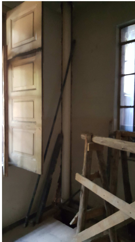
17 - Edifício Mário Werneck - Instalações de combate à incêndio.