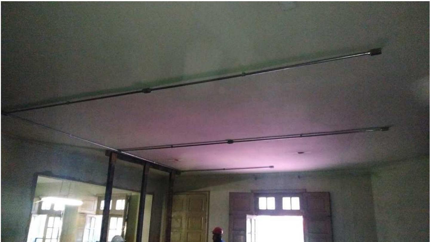
11 - Edifício Mário Werneck (Elétrica/ cabeamento estruturado).