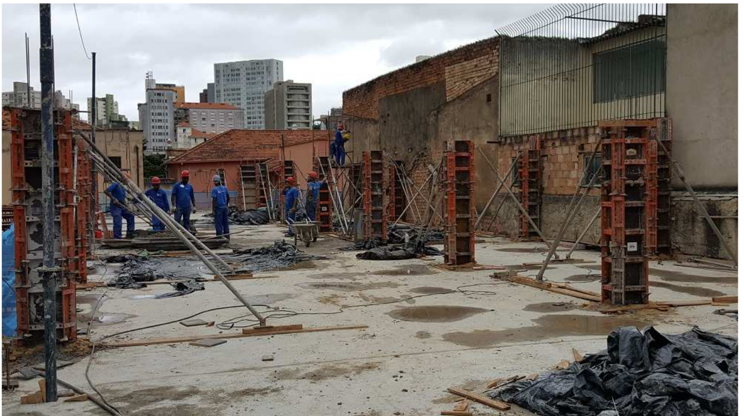
04 - Bloco 3 (forma dos pilares do piso 5).