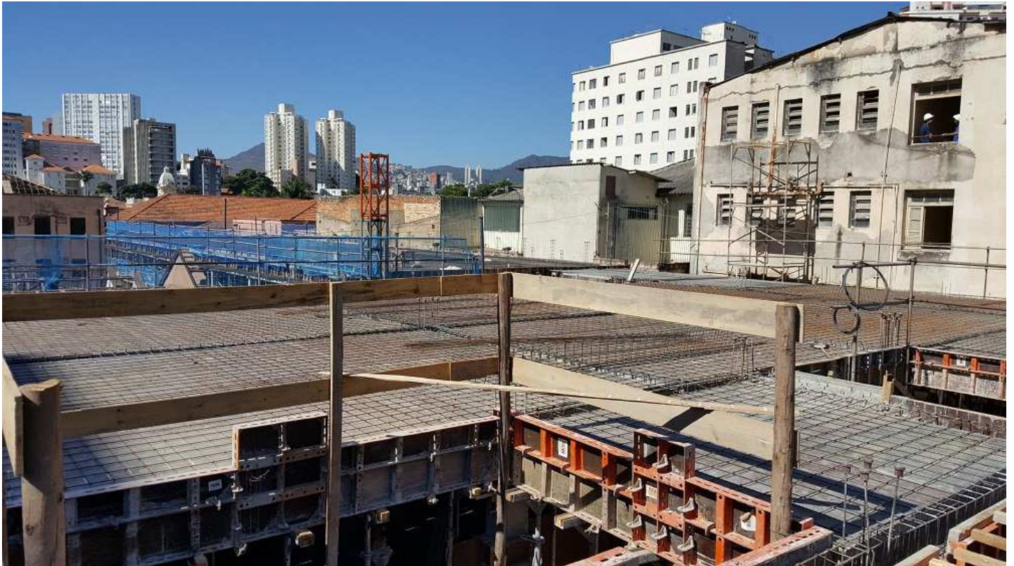
05 - Blocos 2 e 3 (forma e armação vigas e laje do piso 5).