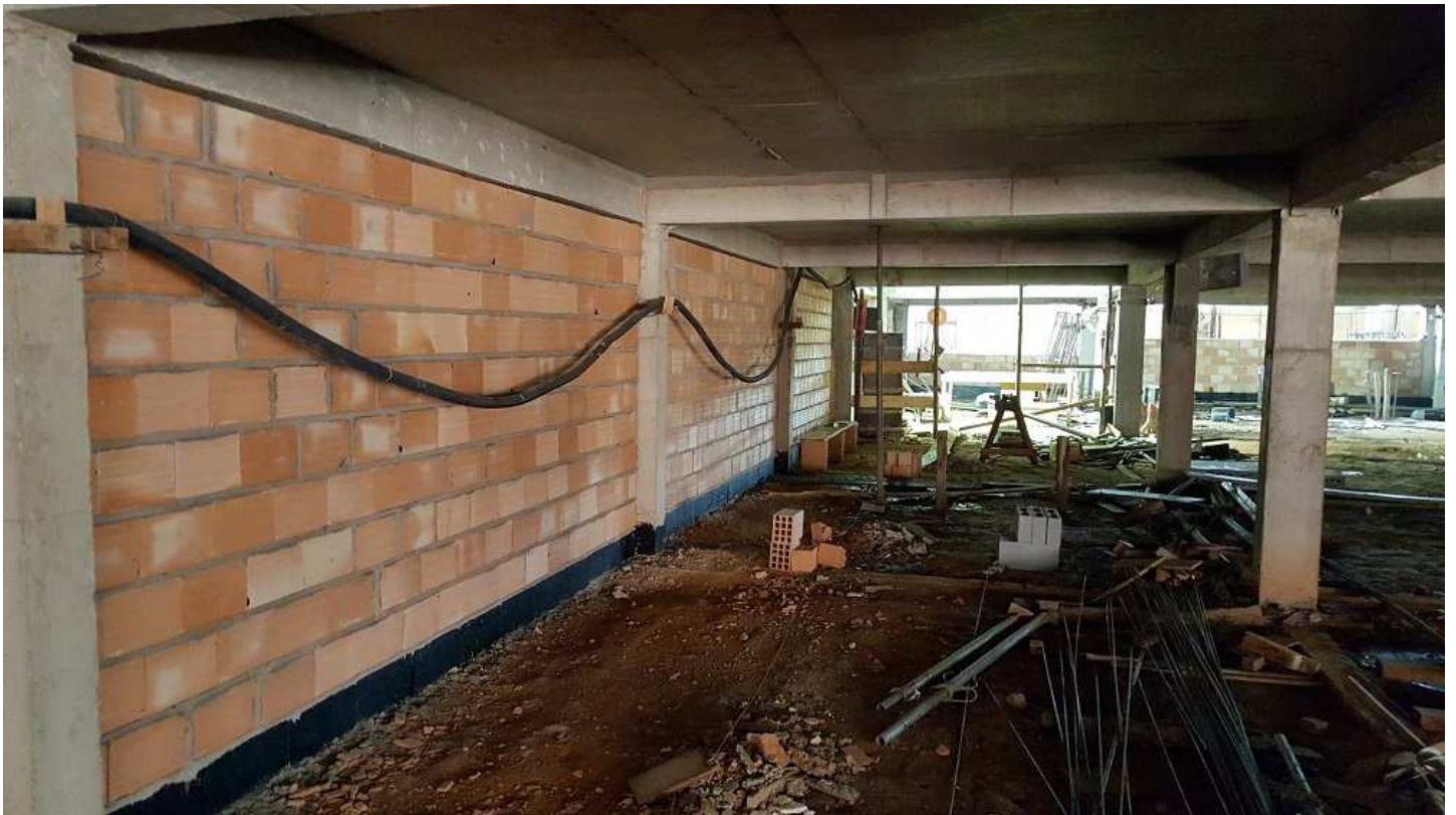
07 - Blocos 1 e 2 (alvenaria na divisa de fundos no 1º pvto)