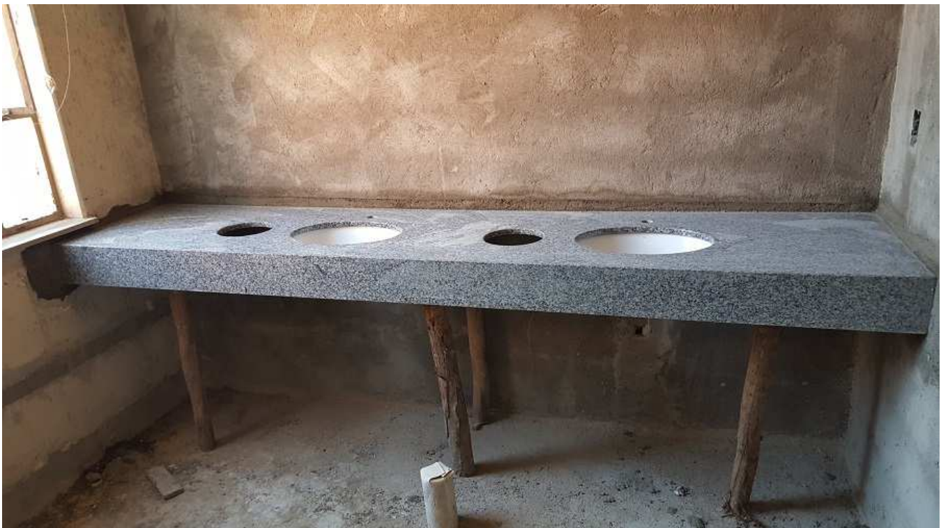
14 - Edifício Mário Werneck - I.S (bancada em granito e cuba de embutir).