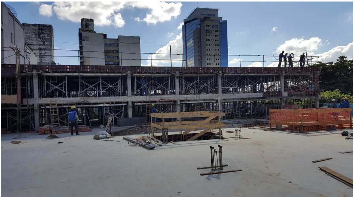
02 - Bloco 1 (estrutura dos pisos 5 e 6) e Bloco 2 (laje do piso 4).