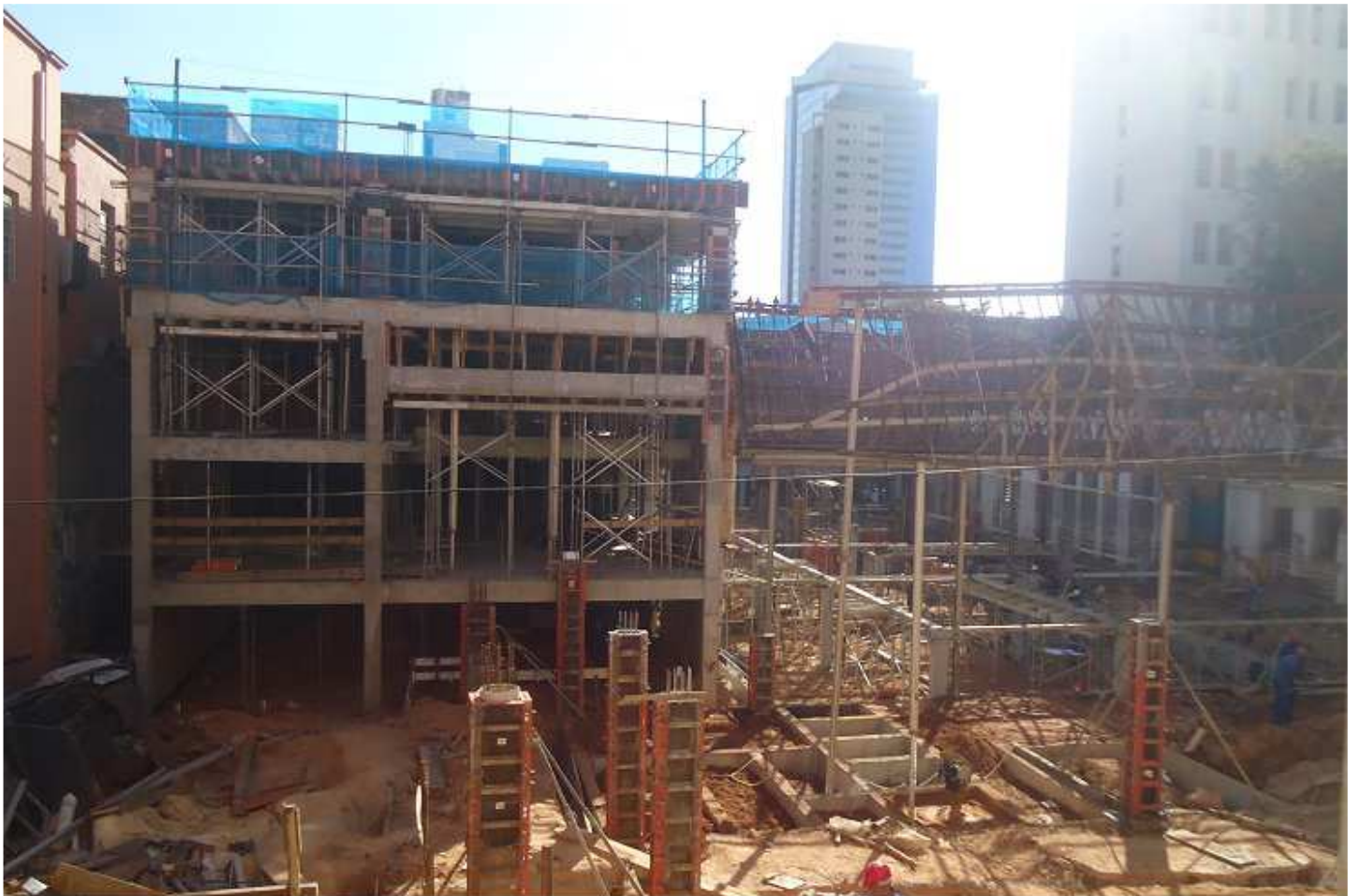
21 - Vista a partir do Edifício Mário Werneck.