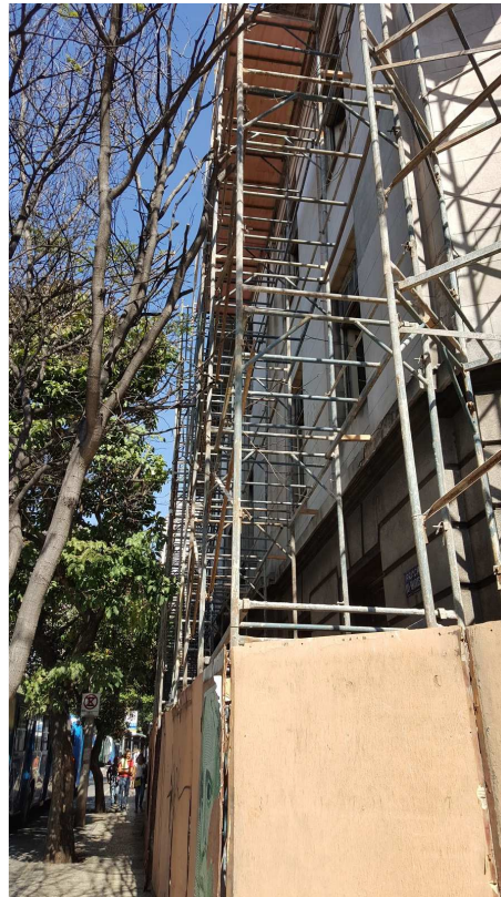
01 - Ed. Mário Werneck - Andaime tipo fachadeiro - Rua Espírito Santo e Rua da Bahia.