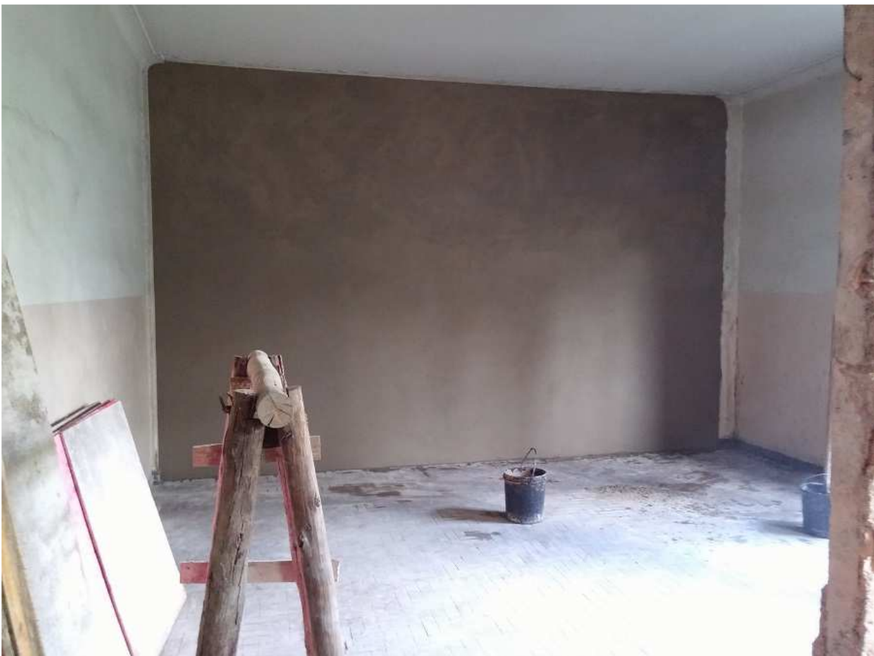
10 - Edifício Mário Werneck (Revestimento interno nas alvenarias novas).