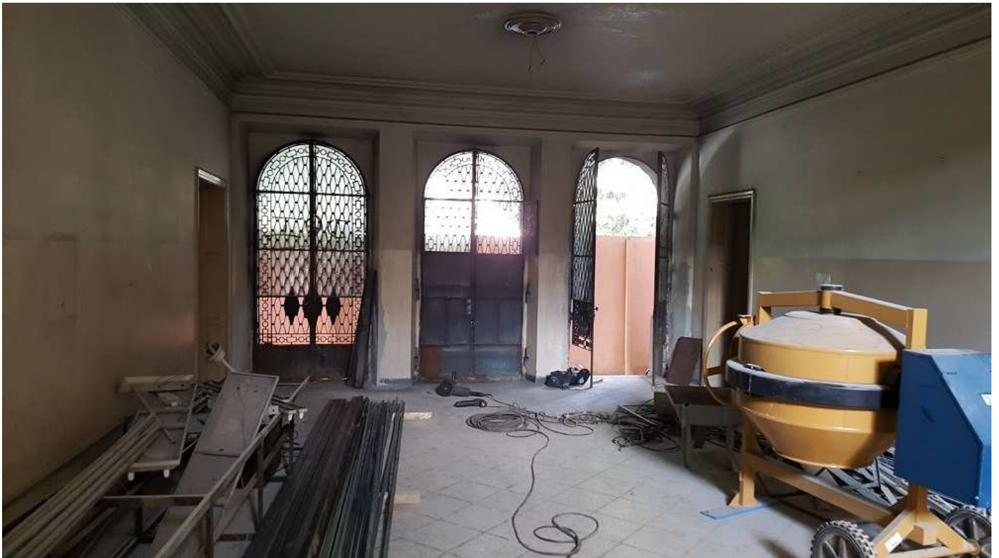
09 - Edifício Mário Werneck (Recuperação das portas da rua da Bahia).