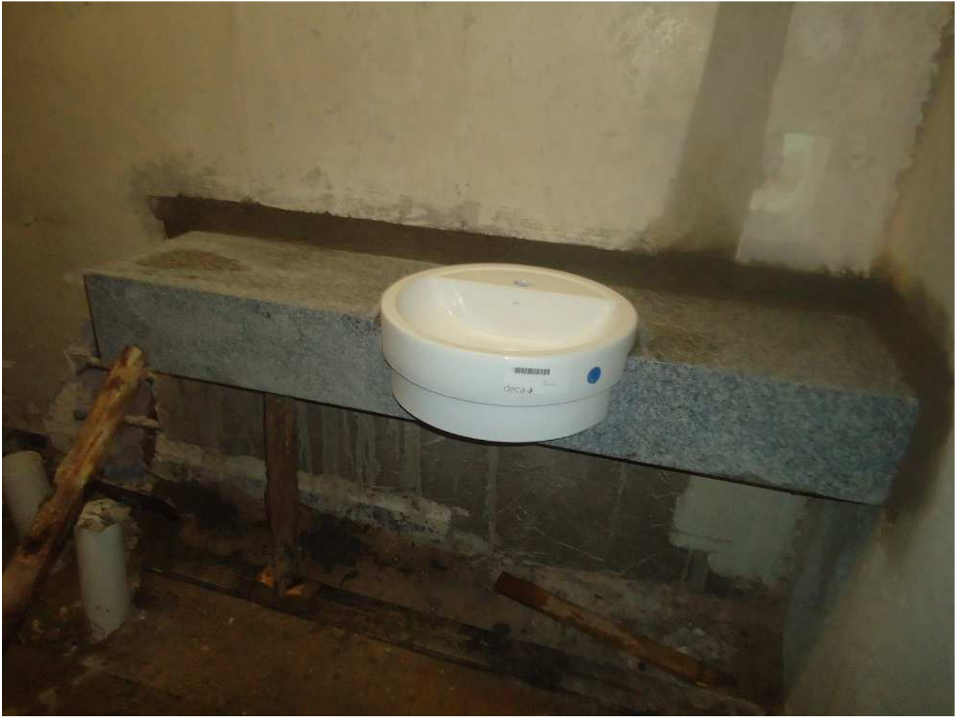
13 - Edifício Mário Werneck - I.S. Diretor (bancada em granito e cuba de semi-encaixe).