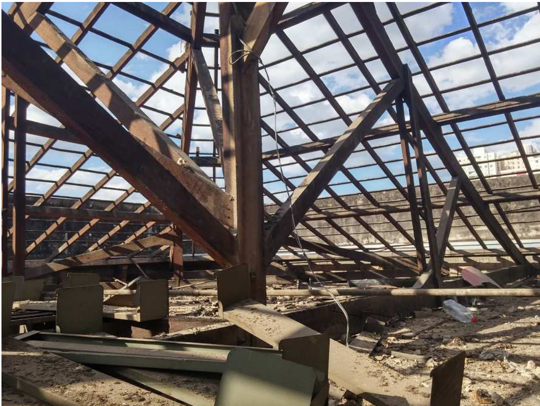
19 - Edifício Mário Werneck - Substituição das telhas cerâmicas