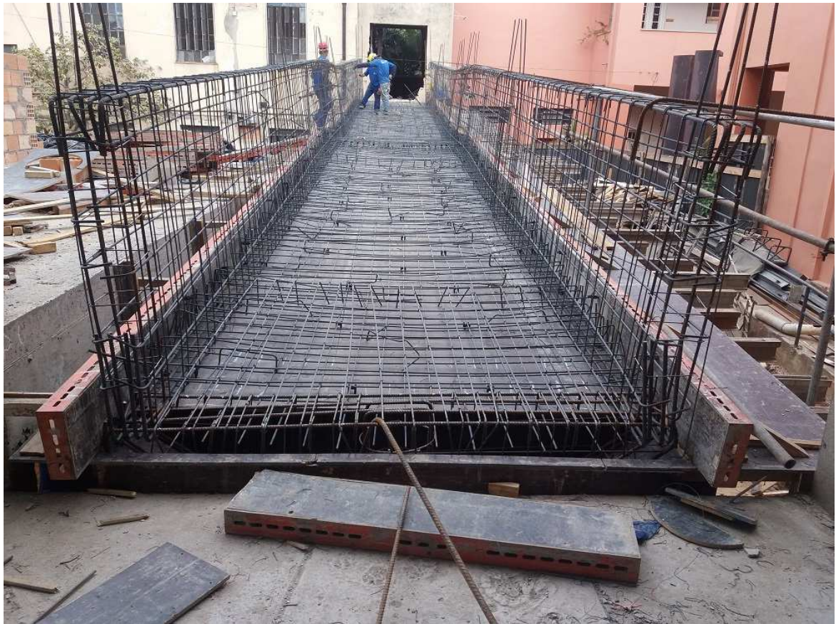
3. Estrutura - Passarela de interligação