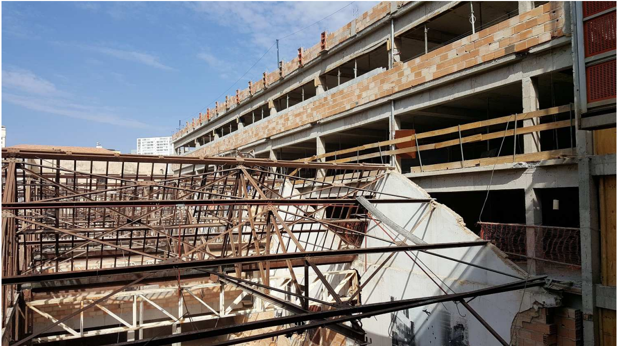
4 . Alvenaria - Estacionamento - Blocos 2 e 3 - 5º pvto e cobertura