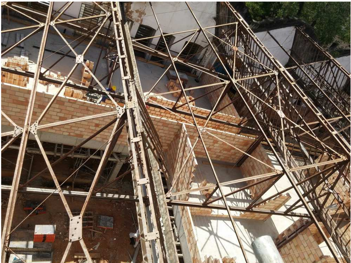
4. Alvenaria - Bloco 4 - Ed. Christiano Ottoni