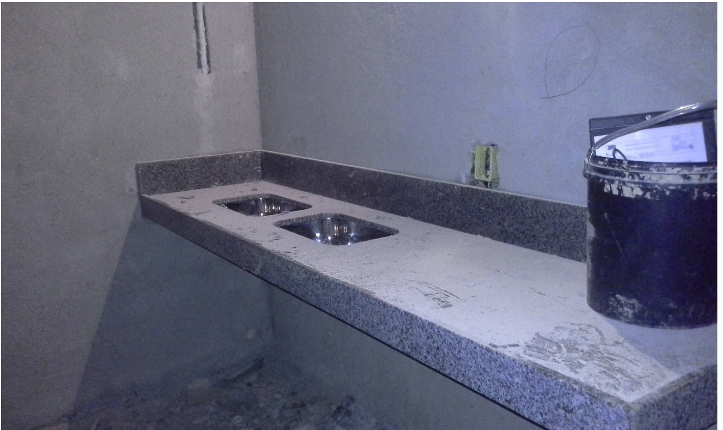
12. Bancada da cozinha - Bloco 4 - Piso 1 - Ed. Christiano Ottoni