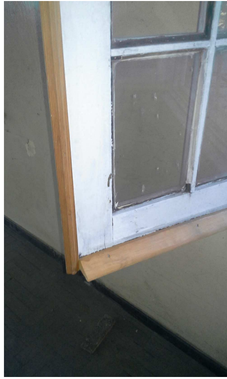
6. Recuperação das esquadrias de madeira - Ed. Mário Werneck