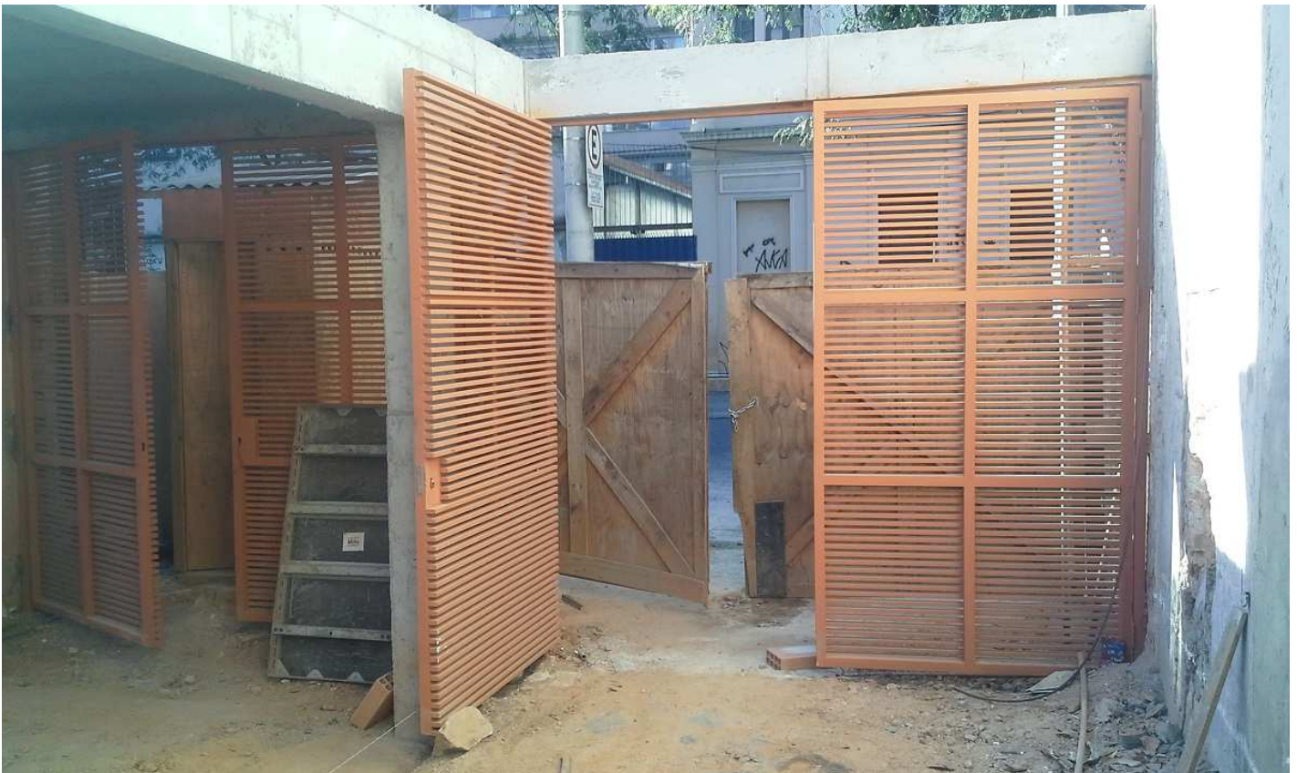
7. Portão acesso Centro Cultural - Rua Guaicurus