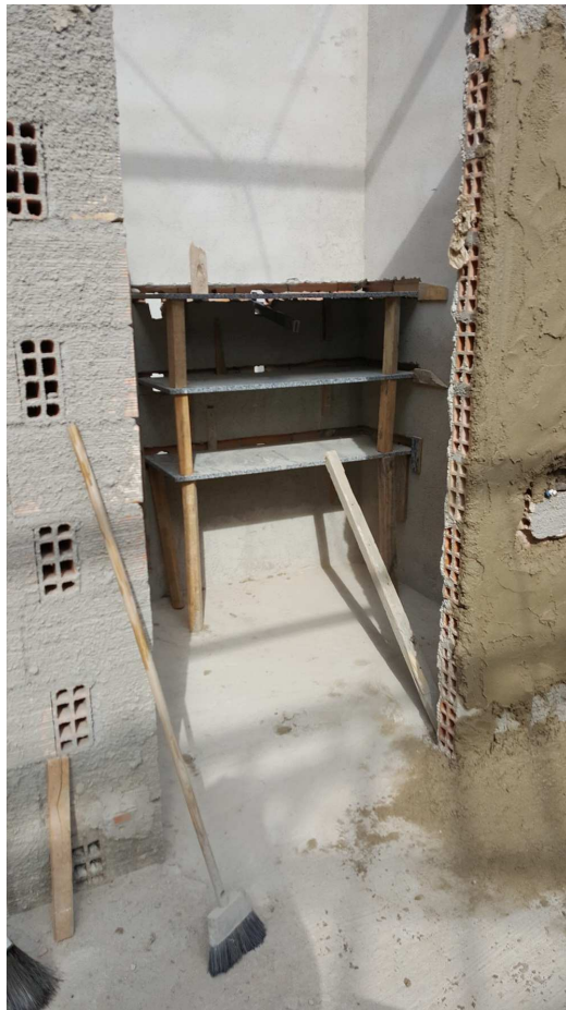
14. Prateleiras em granito - D.M.L - Bloco 4 - Piso 3 - Ed. Christiano Ottoni