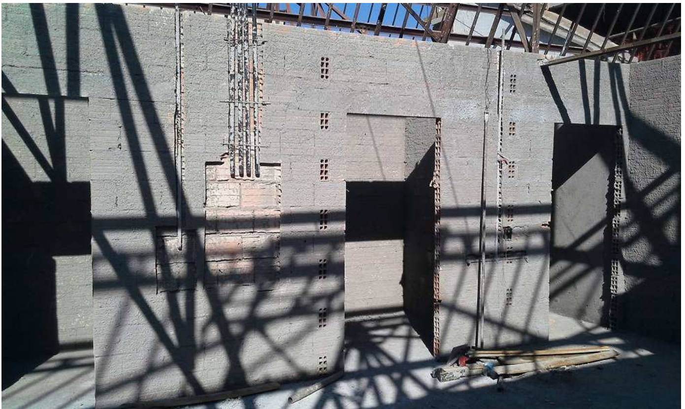
15. Instalações - Bloco 4 - Piso 3 - Ed. Christiano Ottoni