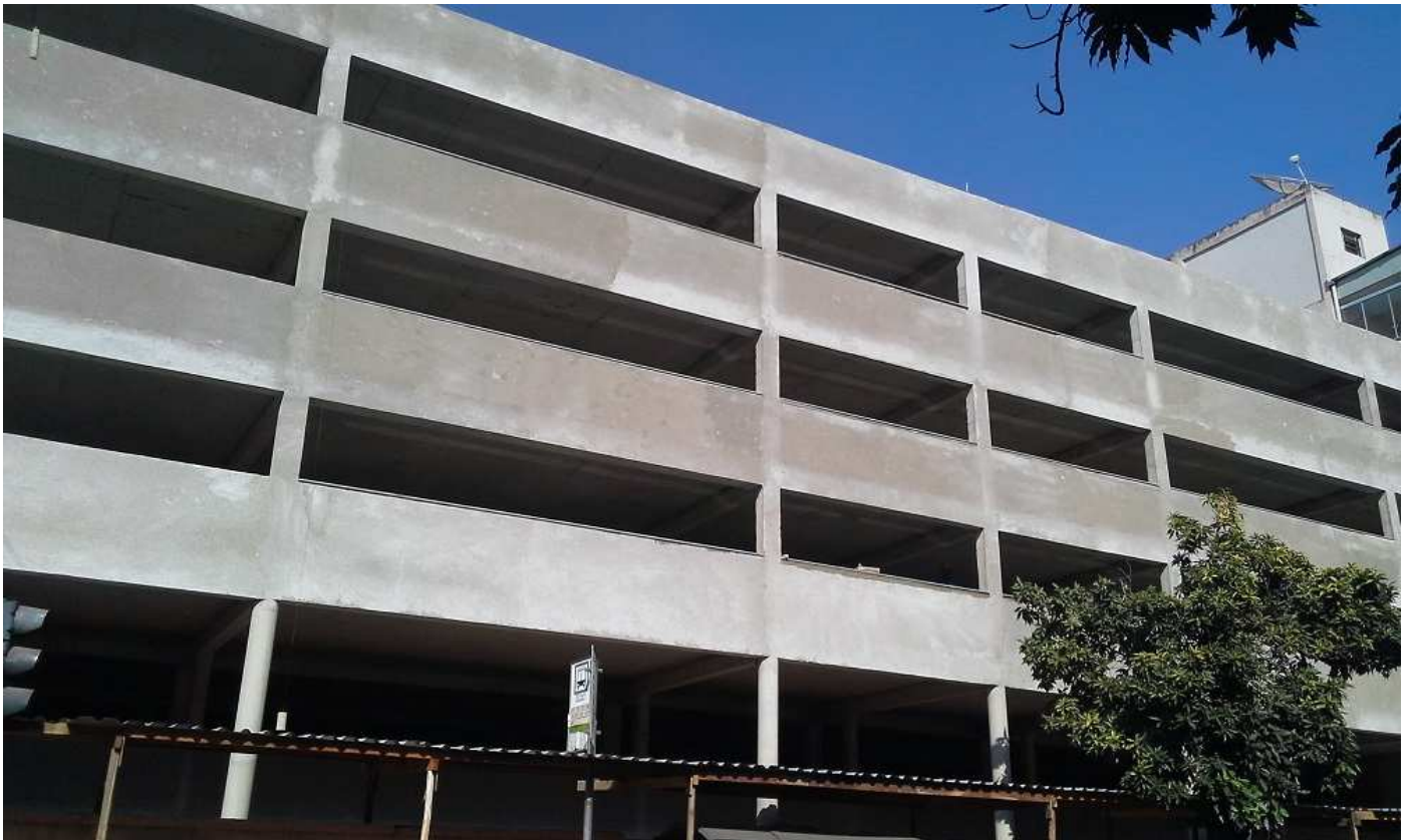
8. Revestimento - Bloco 1 - Fachada Rua Espírito Santo