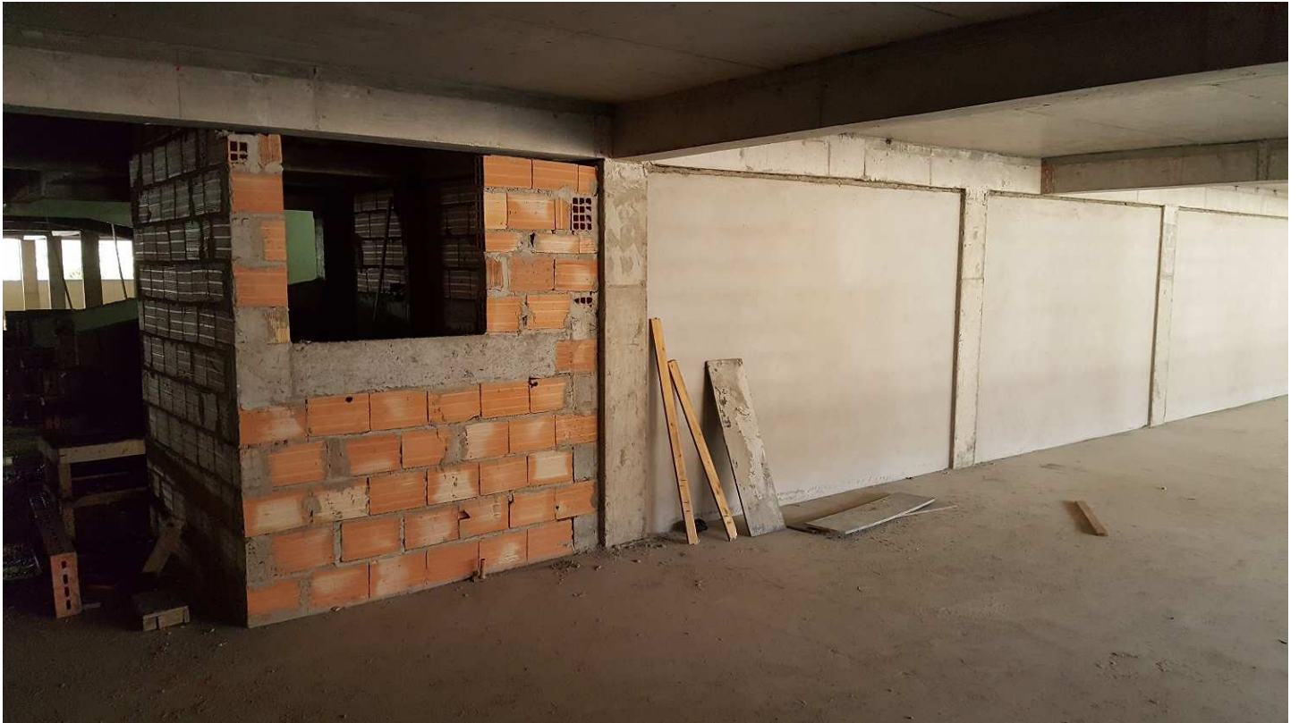
10. Revestimento - Bloco 2 - Piso 2