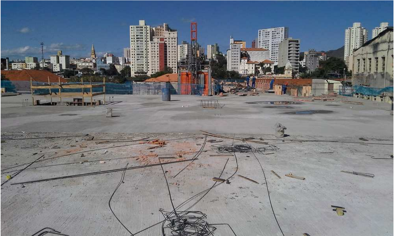
1. Estrutura - Bloco 2 - Piso 6