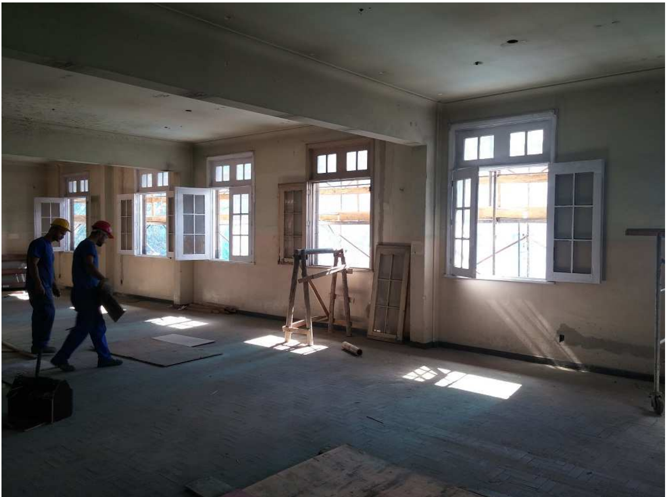
5 . Recuperação das esquadrias de madeira - Ed. Mário Werneck