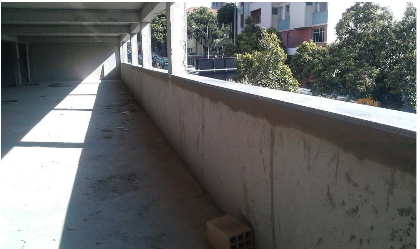
11. Peitoril em granito - Bloco 1 - Fachada Rua Espírito Santo