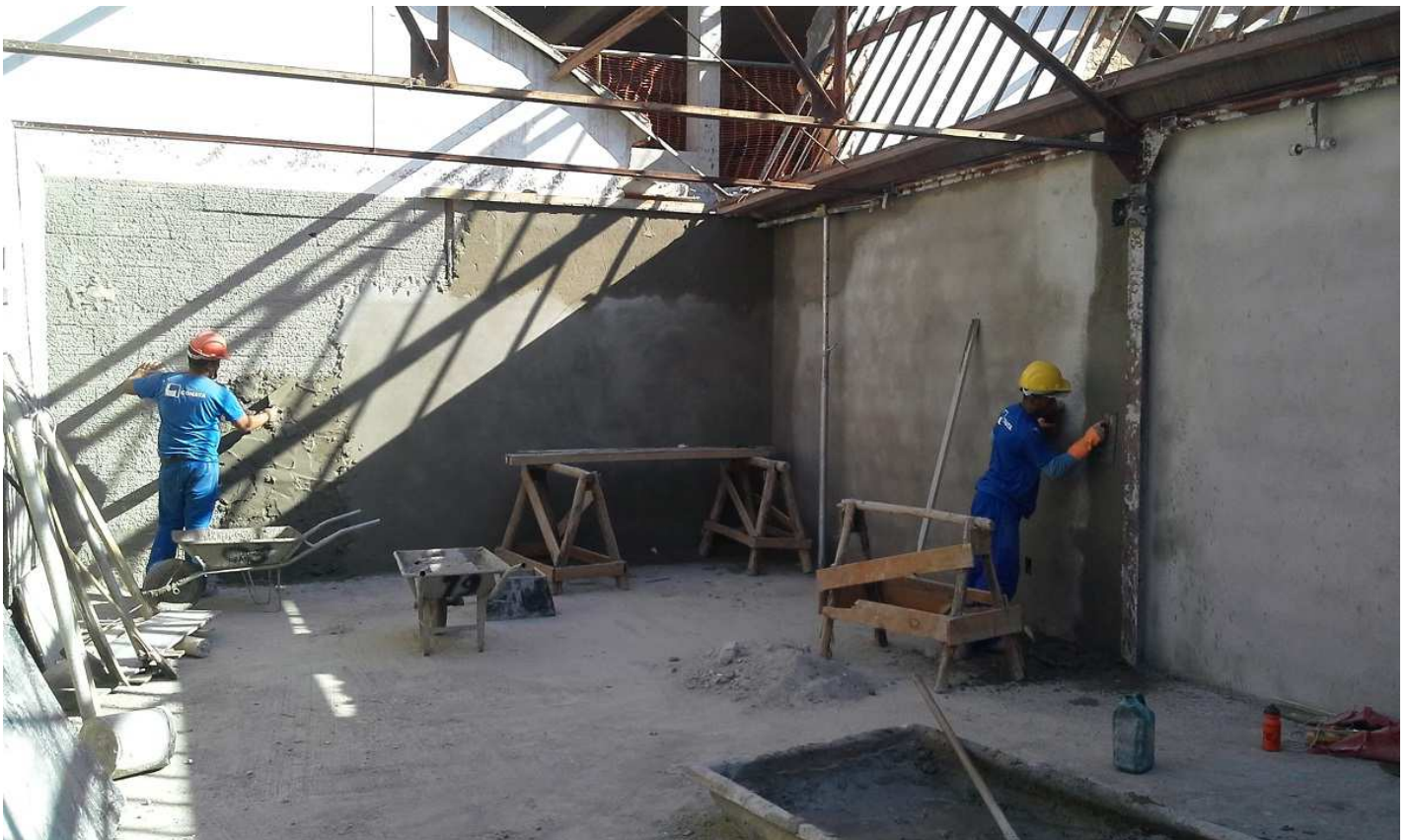
9. Revestimento - Bloco 4 - Piso 3 - Ed. Christiano Ottoni