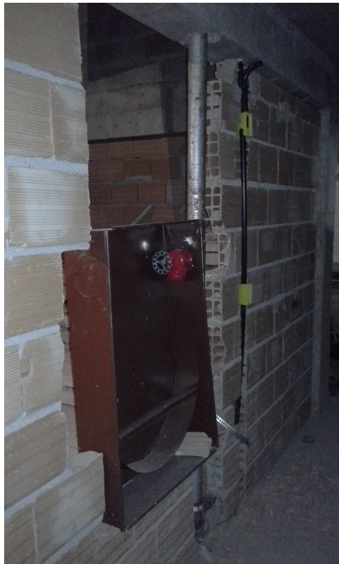
17. Instalações Incêndio - Bloco 2 - Piso 2 - Ed. Christiano Ottoni