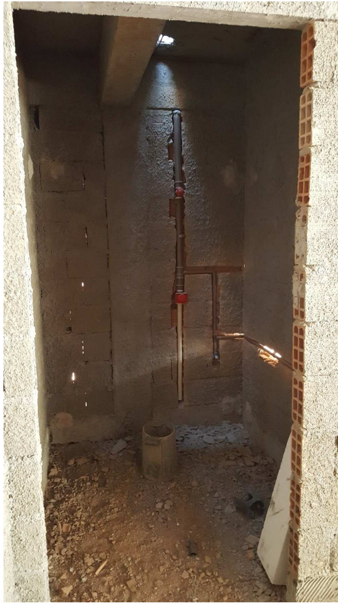
16. Instalações I.S.A - Bloco 4 - Piso 1 - Ed. Christiano Ottoni