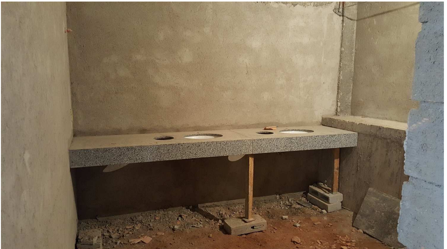
13. Bancada I.S - Bloco 4 - Piso 1 - Ed. Christiano Ottoni