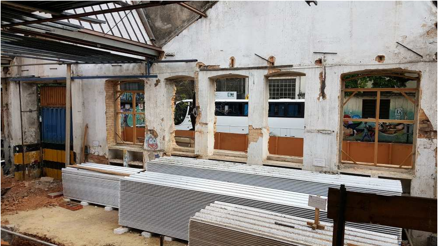
9. Esquadria - Bloco 4 - Piso 2 - Fachada principal Ed. Christiano Ottoni