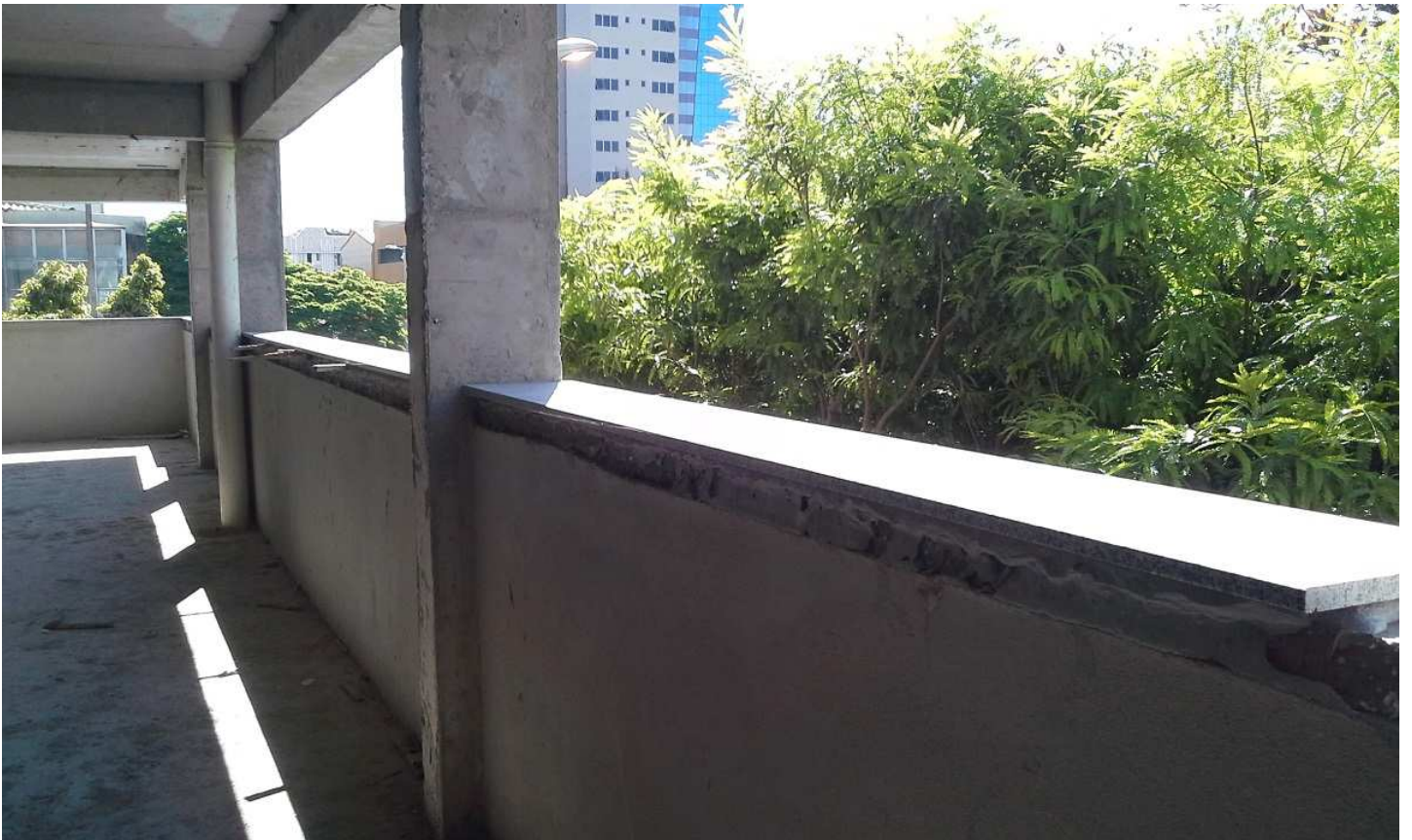
13. Peitoril em granito - Blocos 1 e 2 - Rua Guaicurus