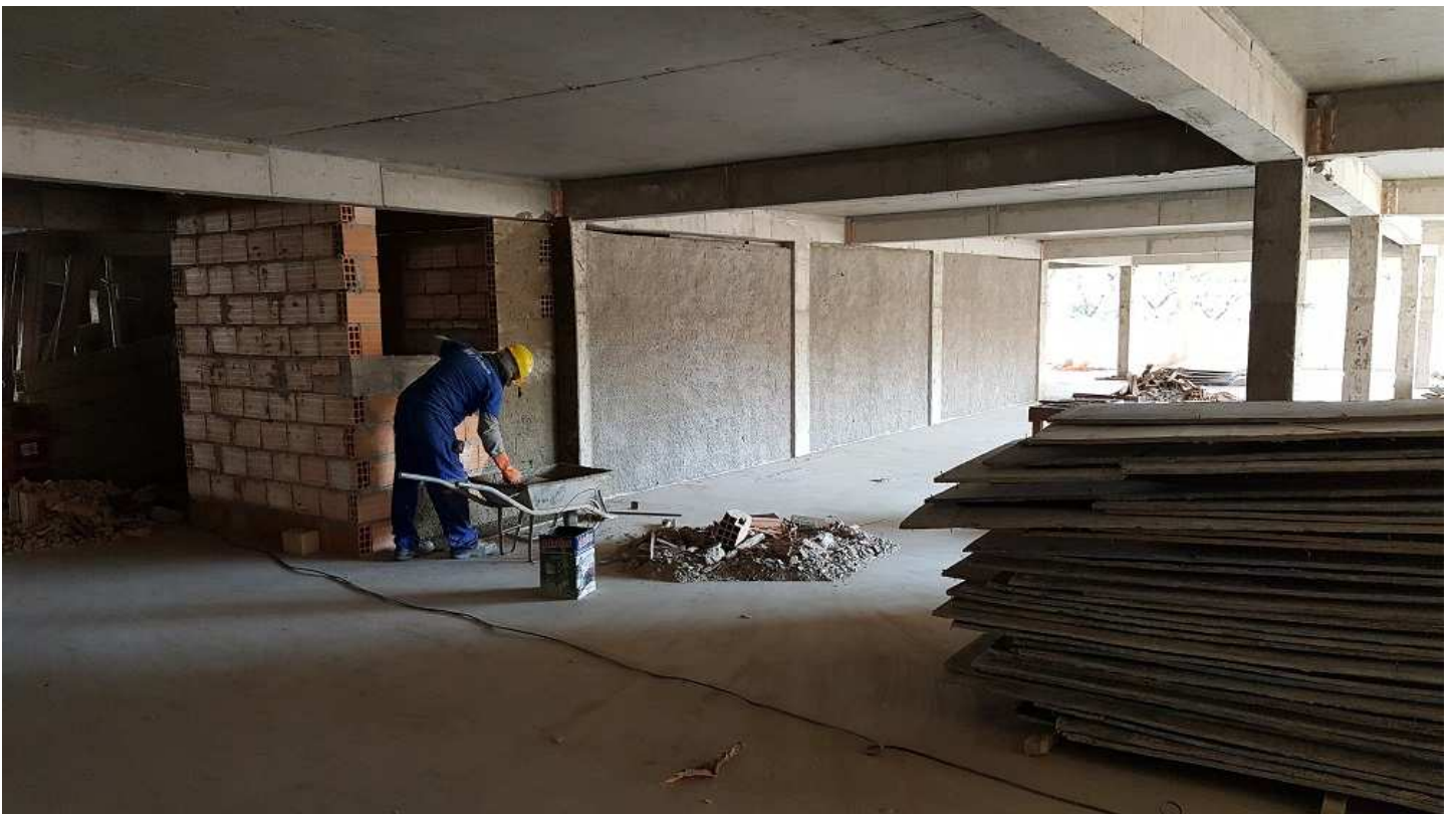
12. Revestimento - Bloco 2 - Piso 4