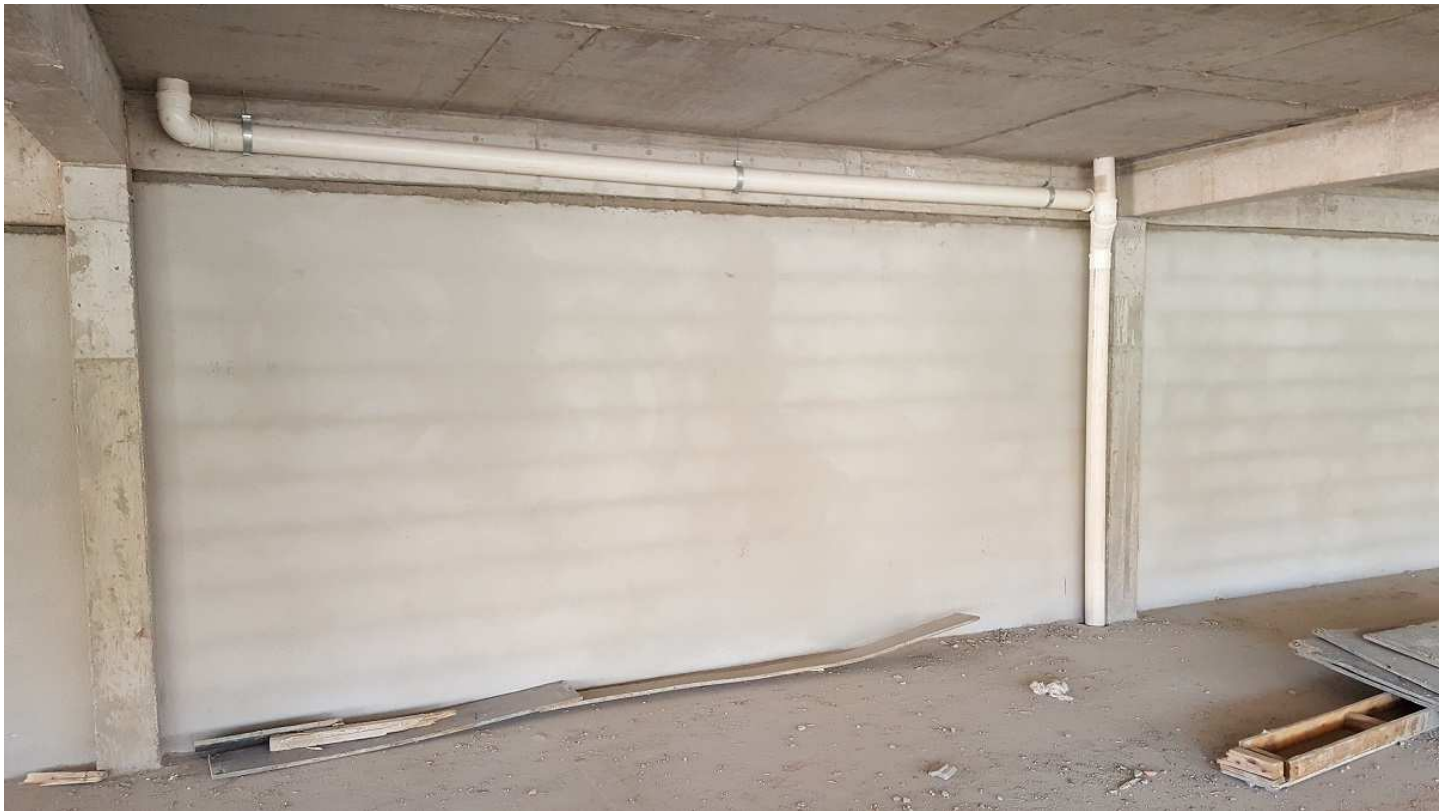
15. Instalações pluviais - Bloco 3 - Piso 4