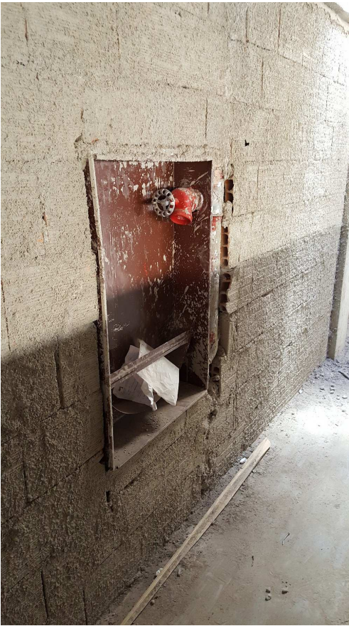
19. Hidrante - Bloco 2 - piso 5