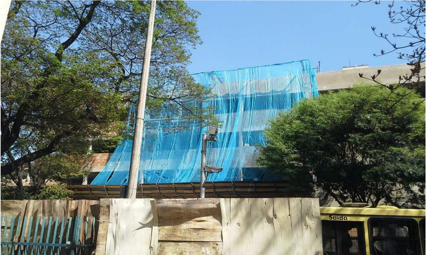
1. Tela de proteção de fachada - Bloco 2 - R. Guaicurus