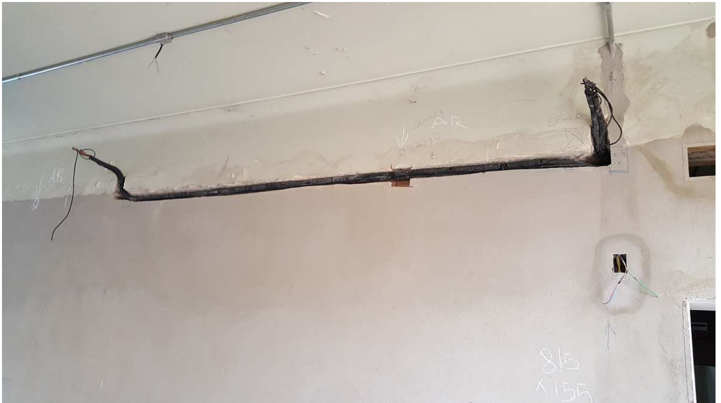
17. Instalações ar condicionado - Ed. Mário Werneck - 2º pvto