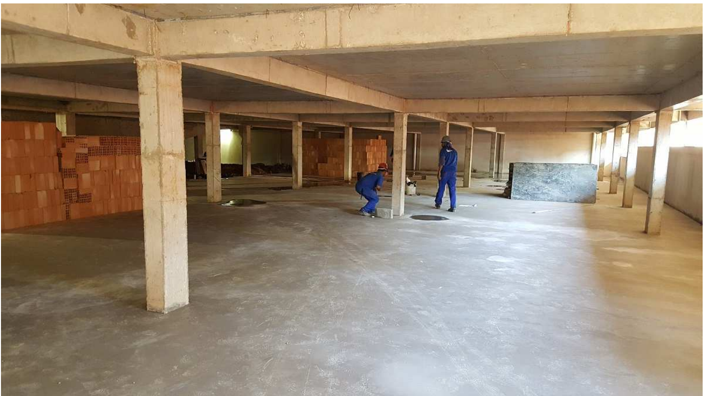
4. Estrutura - Bloco 1 - Piso 1