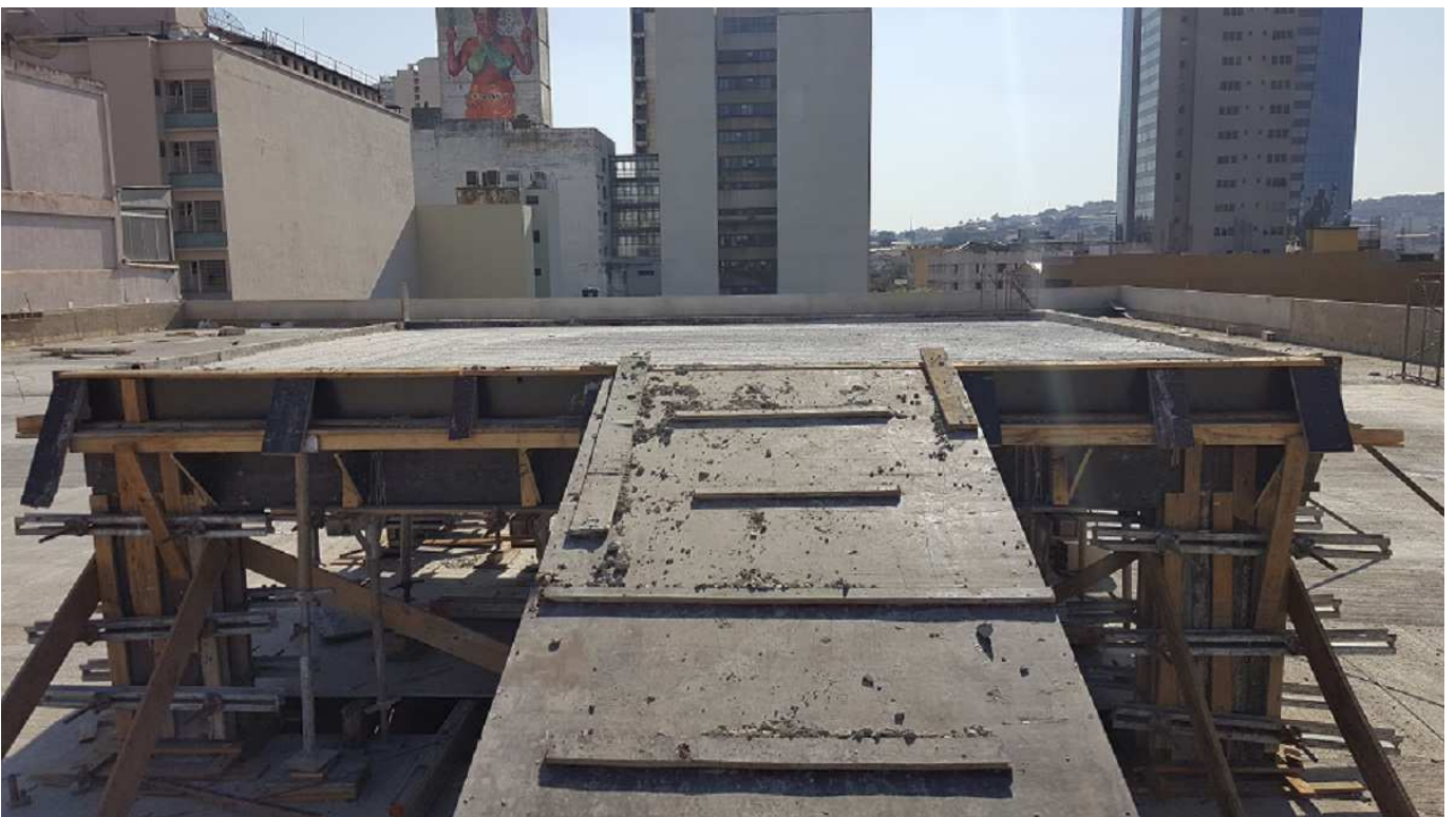
2. Estrutura - Bloco 2 - Piso 7