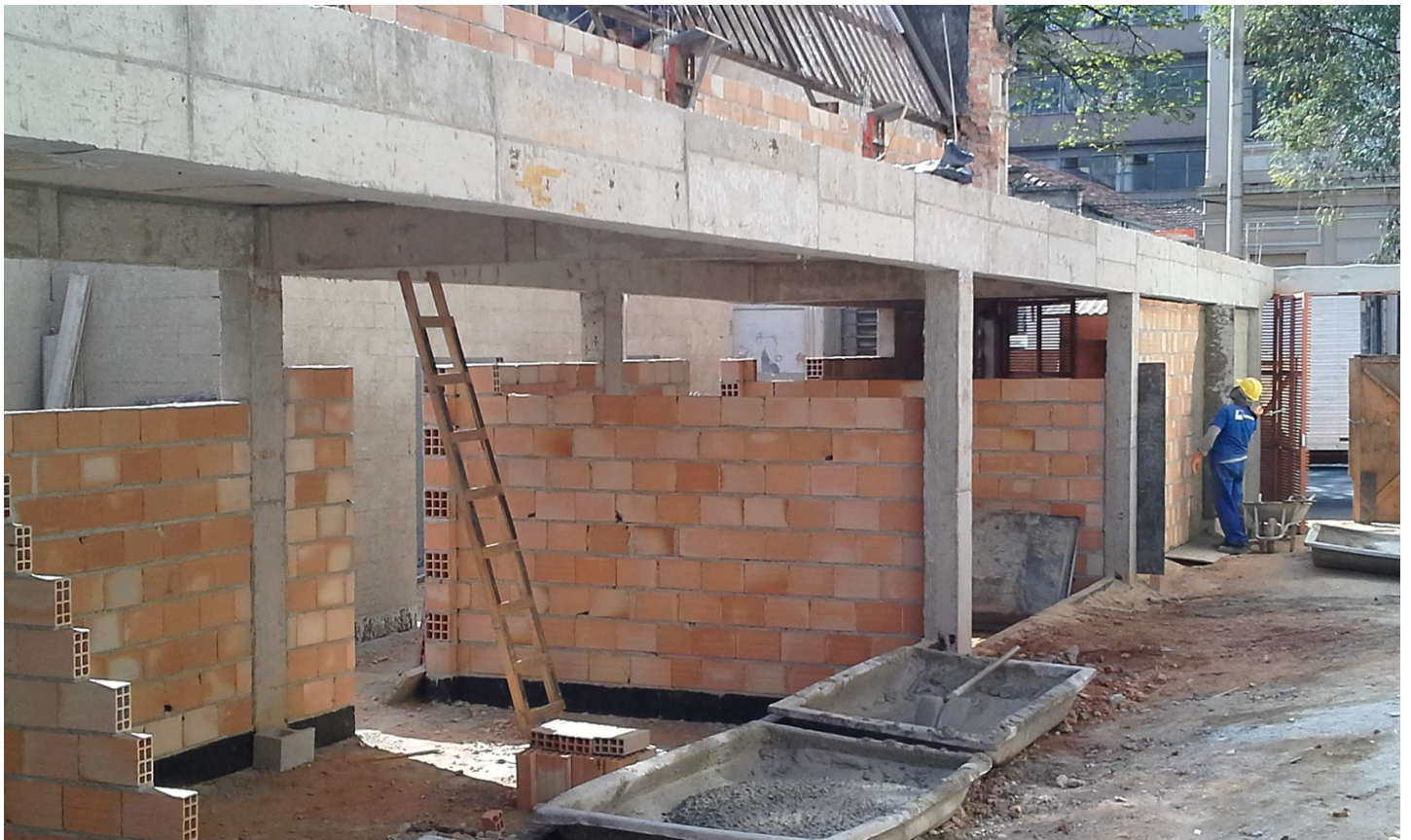
6. Alvenaria - Bloco 4 - Consultórios