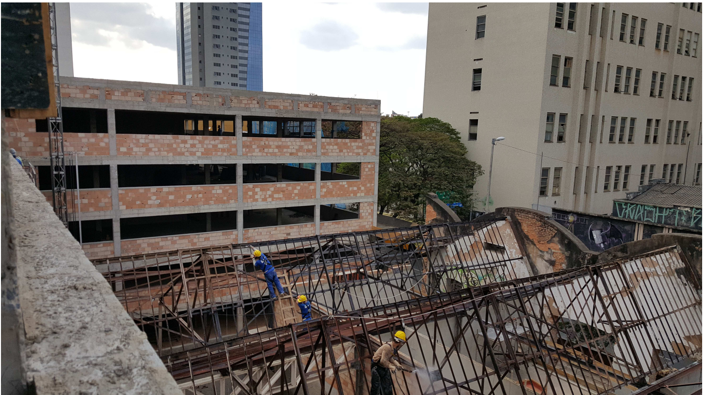
8. Alvenaria - Estacionamento - Bloco 2