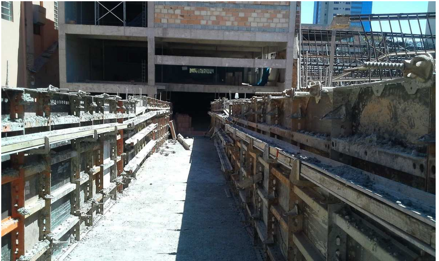
5. Estrutura - Laje passarela