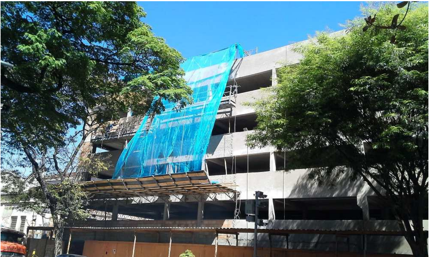
10. Revestimento - Bloco 2 - Emboço fachada R. Guaicurus