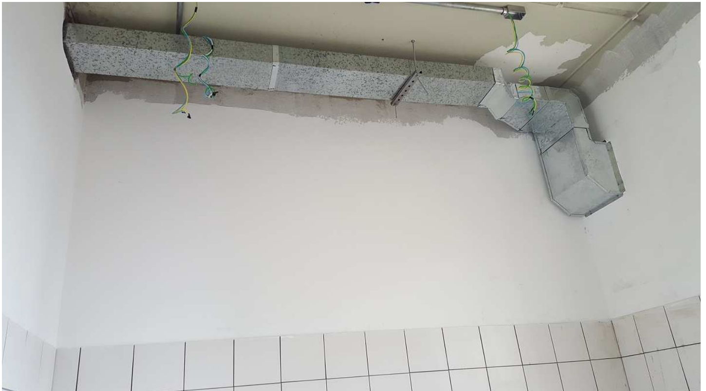
18. Instalações ar condicionado - exaustão I.S - Ed. Mário Werneck - 3º pvto