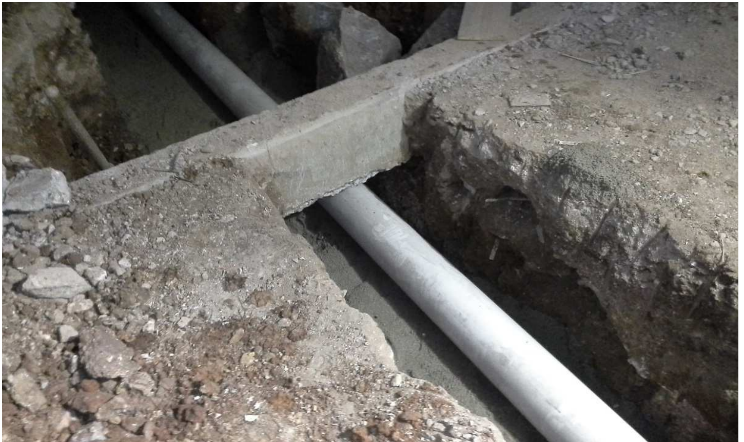
16. Instalações pluviais - Bloco 1 - Piso 1