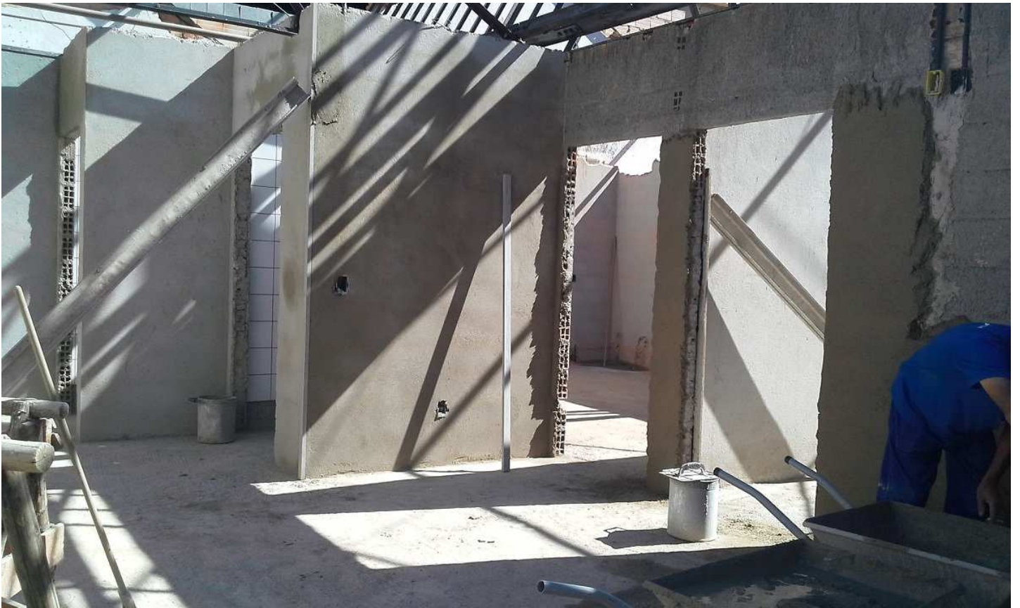
11. Revestimento - Bloco 4 - Piso 3