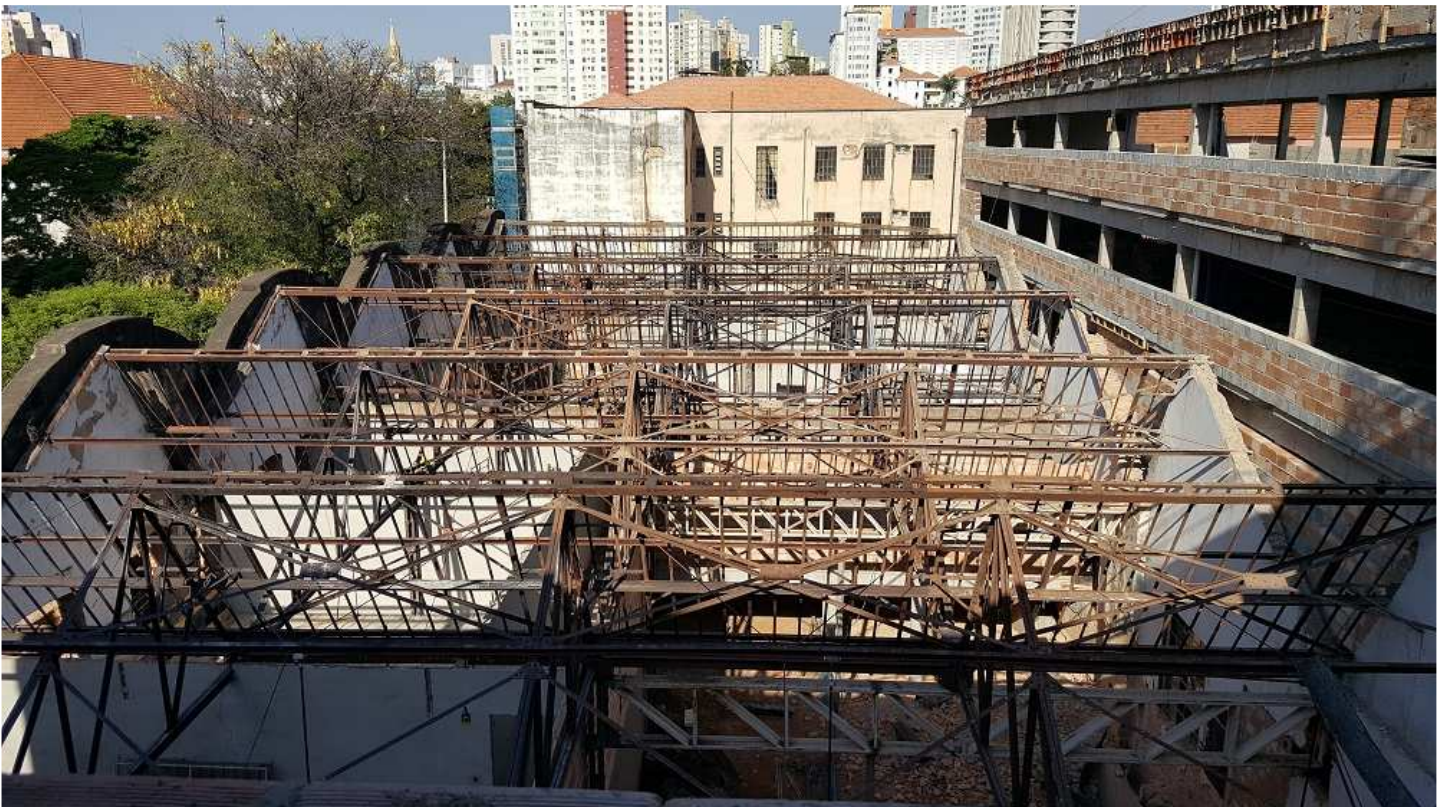
21. Vista a partir do Bloco 2 - Piso 6