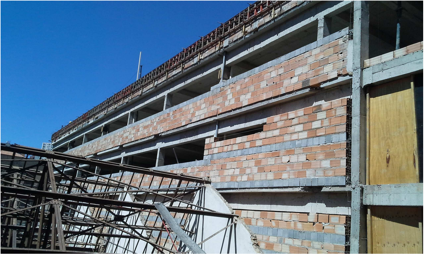
7. Alvenaria - Estacionamento - Bloco 3