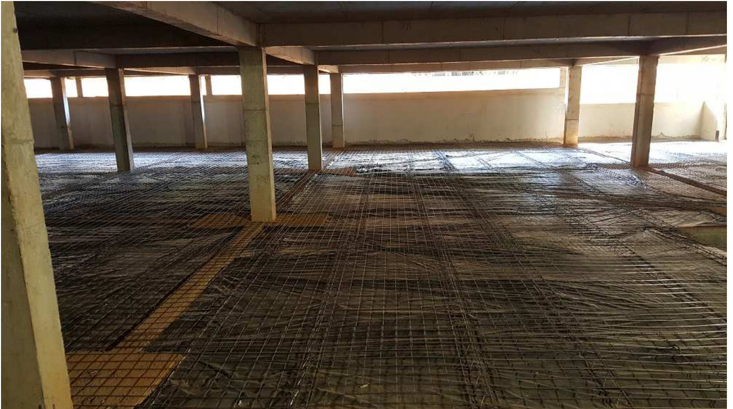
3. Estrutura - Bloco 1 - Piso 1