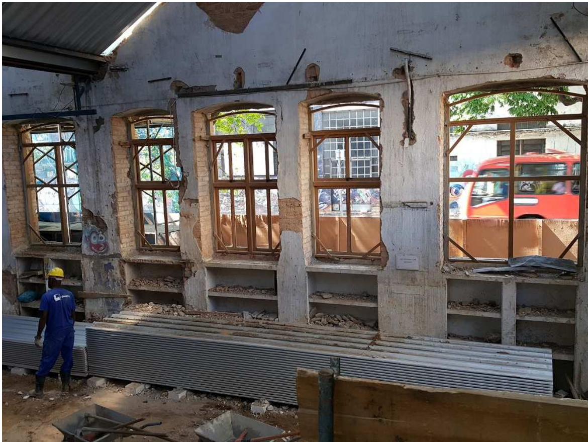
7 . Esquadria - Bloco 4 - Piso 2 - Fachada principal Ed. Christiano Ottoni