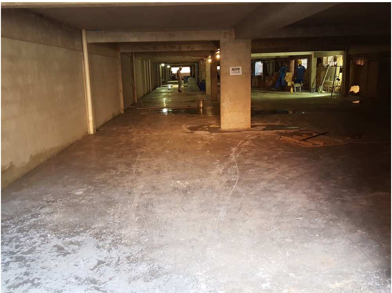
4. Estrutura - Bloco 3 - Piso 1