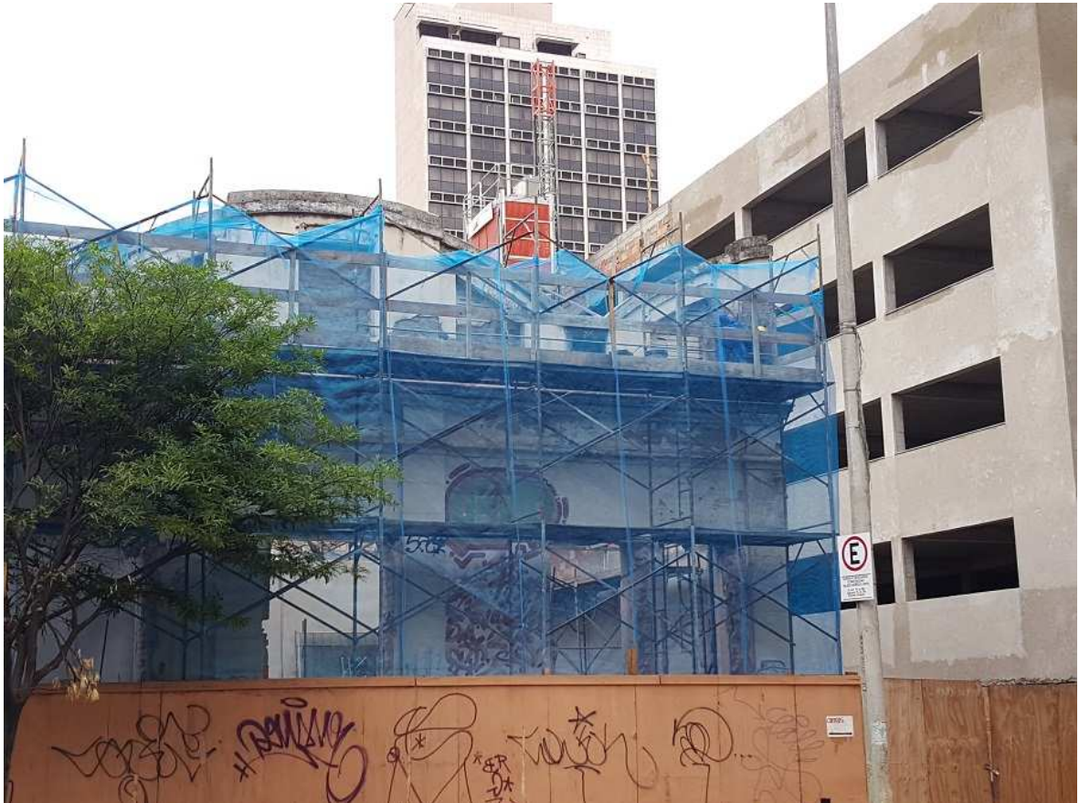
1. Tela de proteção de fachada - Ed. Christiano Ottoni