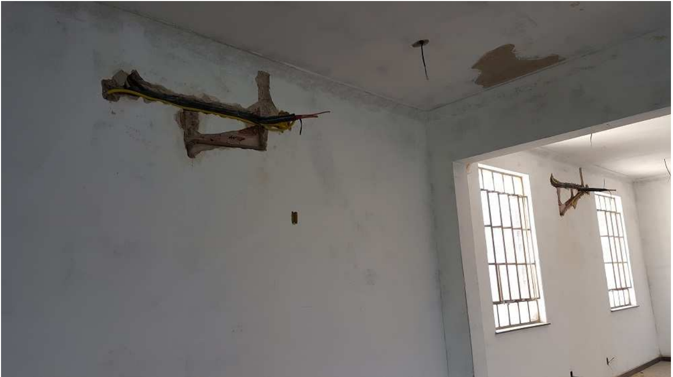
17. Instalações ar condicionado - Ed. Mário Werneck - 3º pvto