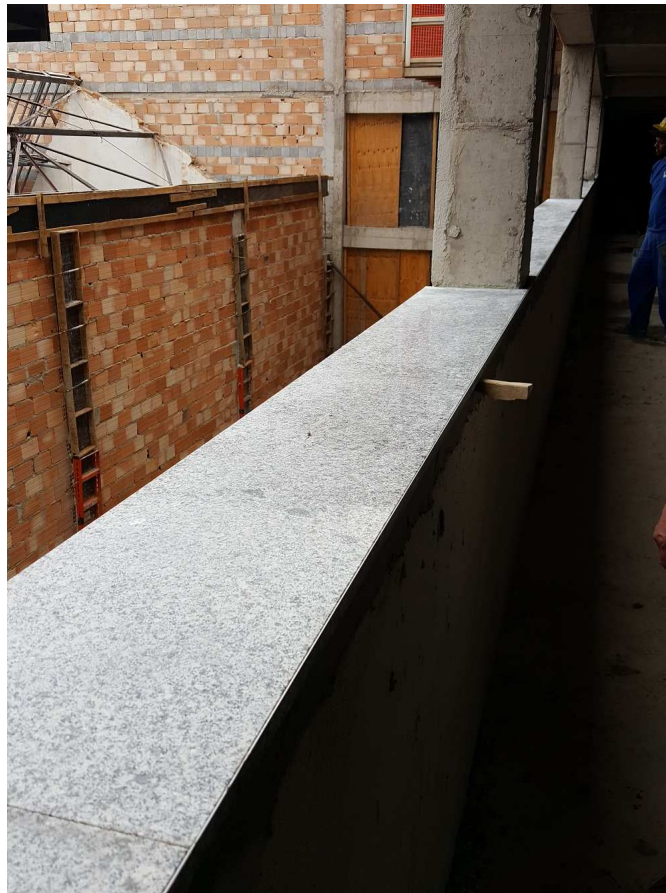
15. Peitoril em granito - Bloco 2 - fachada lateral esquerda