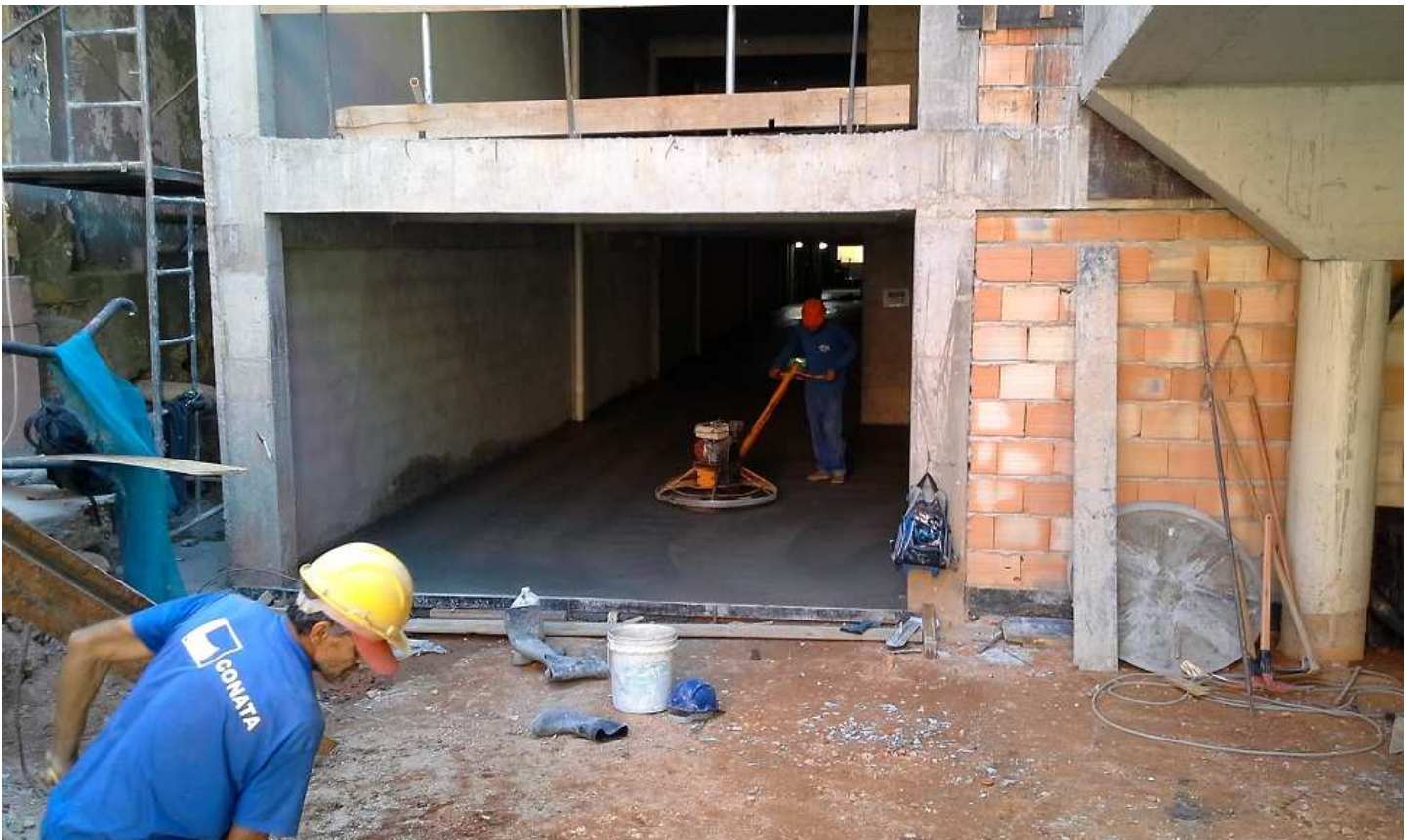
16. Pavimentação - Concreto nivelado - Bloco 3 - Piso 1