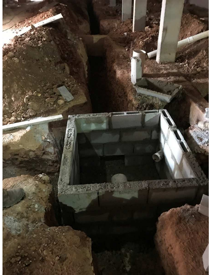
19. Instalações pluviais - Blocos 2 e 3 - Piso 1