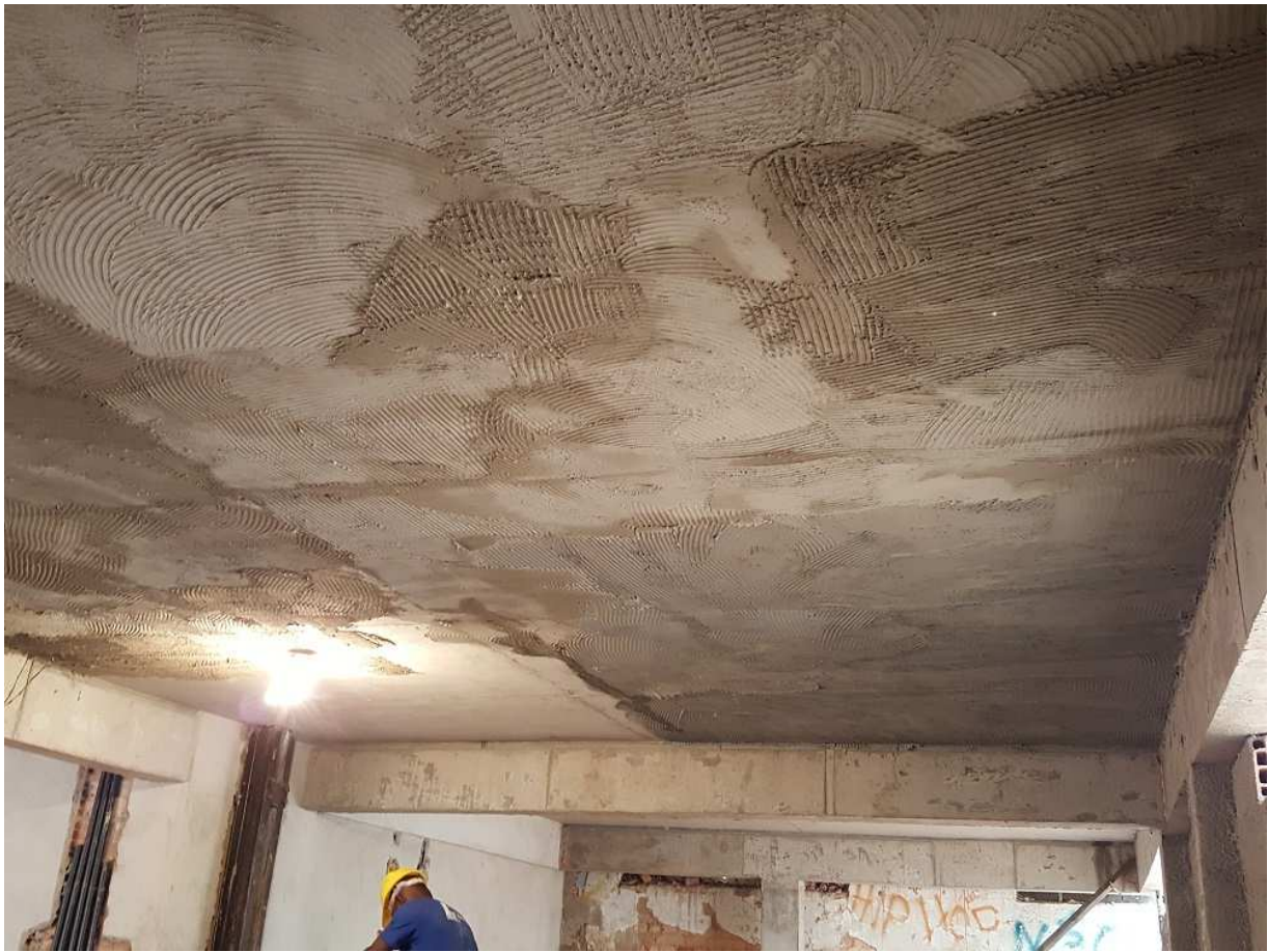
13. Revestimento de teto - Bloco 4 - Piso 1