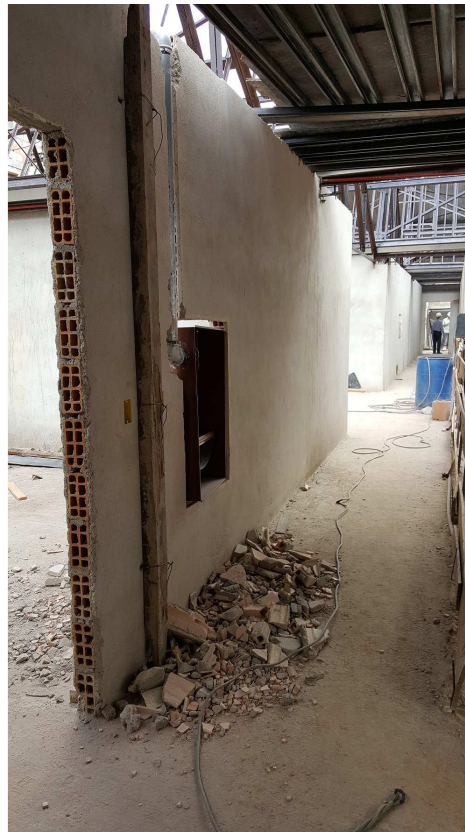
20. Instalações de combate a incêndio - abrigo para hidrantes - Bloco 4 - Piso 2 e 3