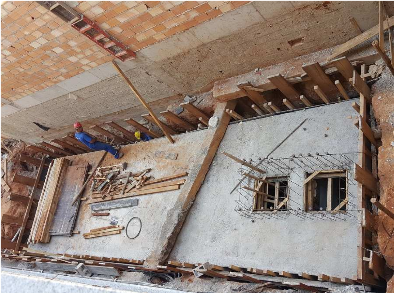
5. Estrutura - Caixa de captação de água pluvial