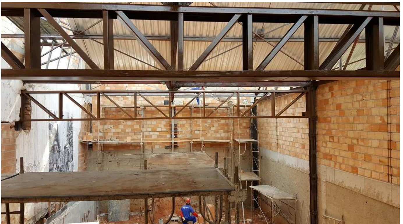
6. Alvenaria - Bloco 4 - Piso 1