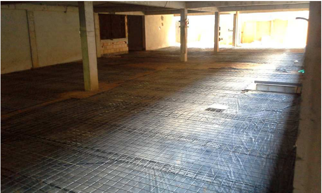
3. Estrutura - Bloco 2 - Piso 1