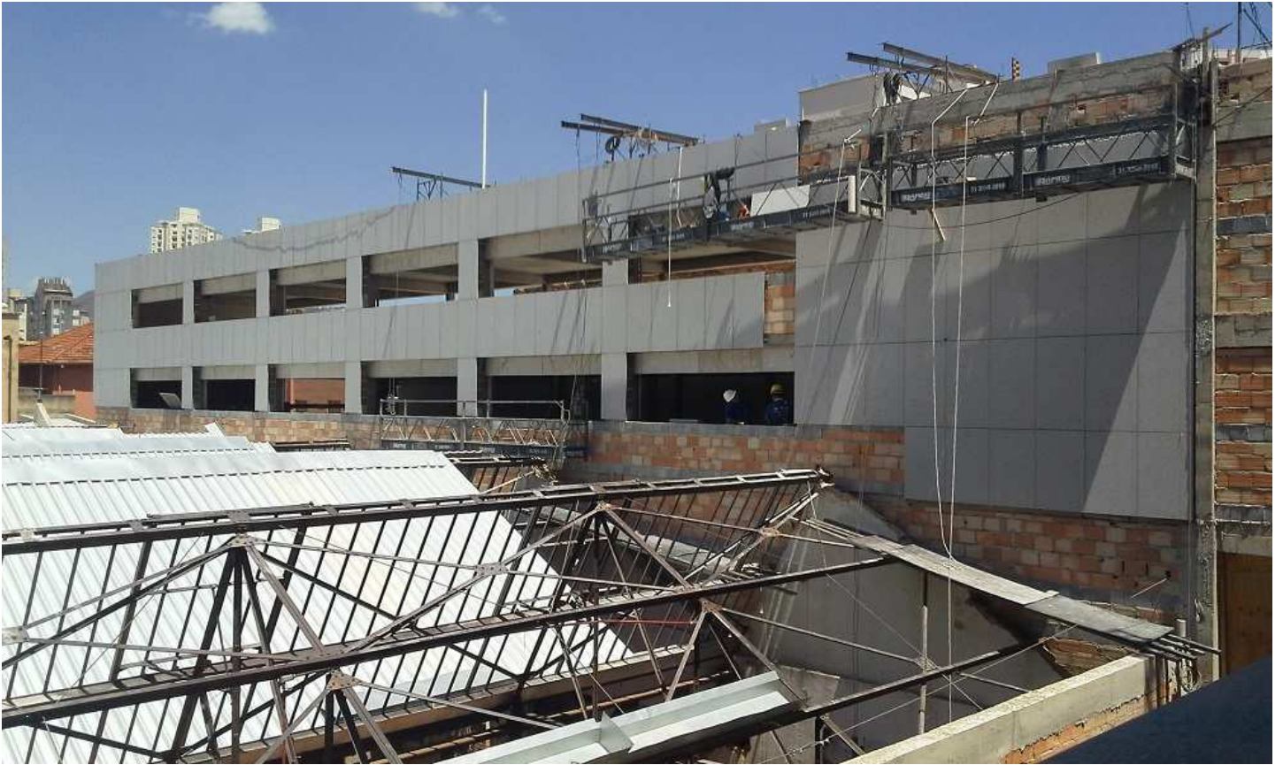
11. Revestimento - Bloco 3 - granito da fachada aerada