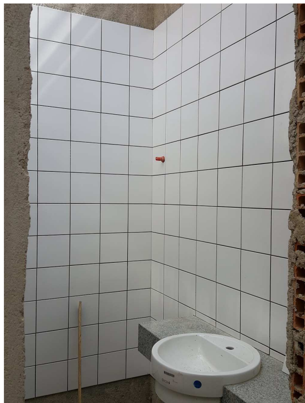
14. Revestimento cerâmico - Vestiário do bloco 2 e I.S do piso 2 no bloco 4