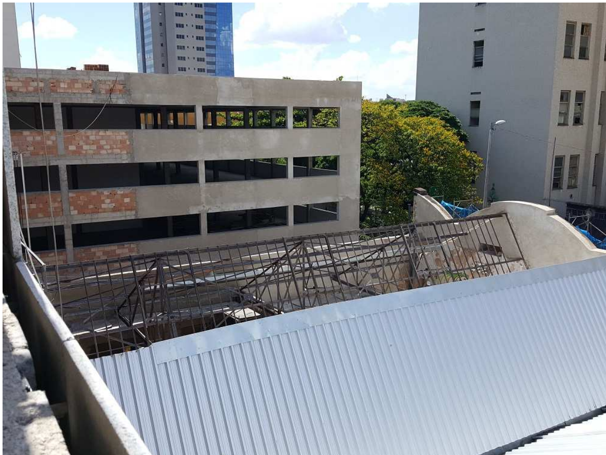
10. Revestimento - Bloco 2 - Emboço fachada lateral esquerda