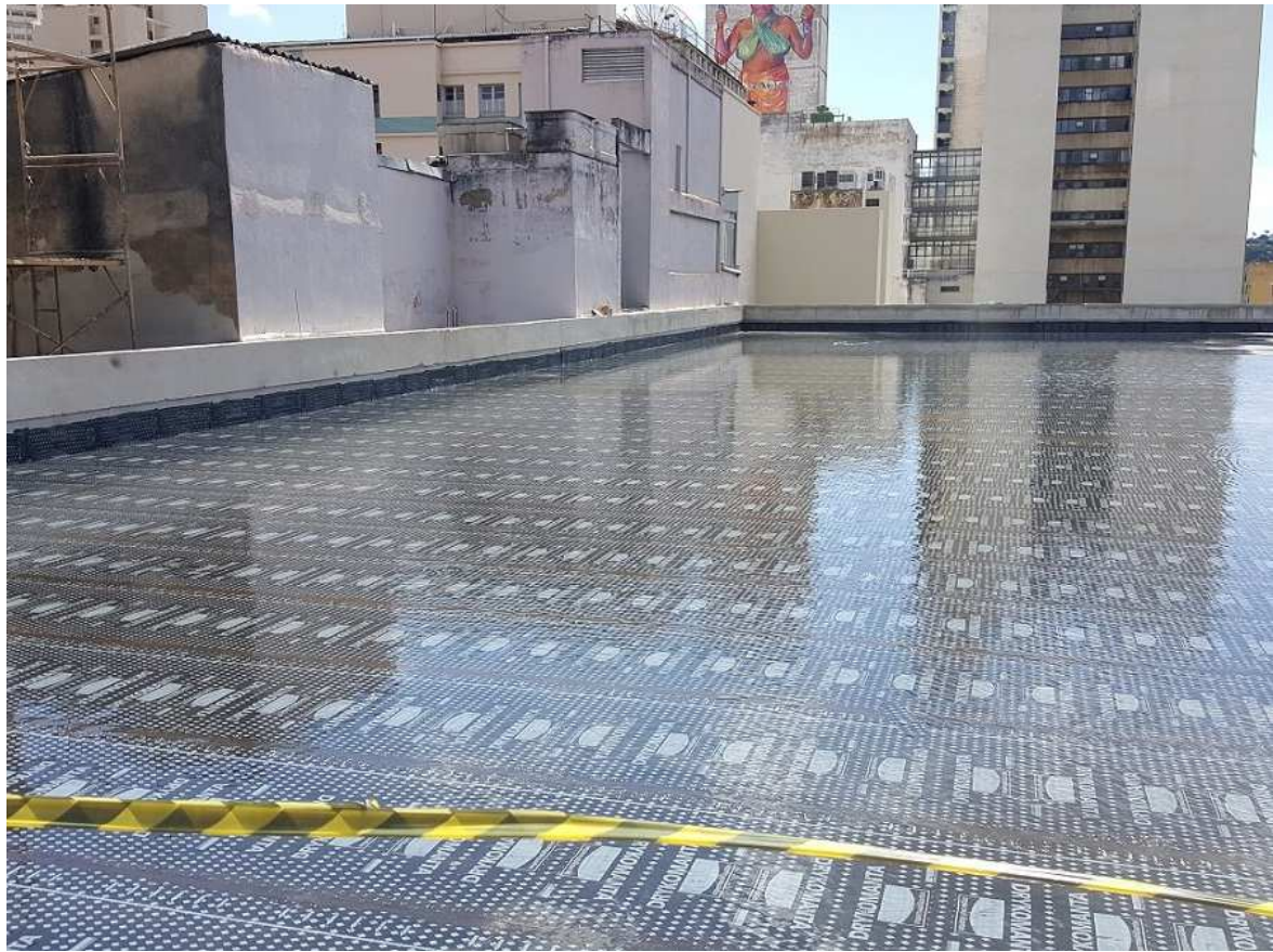
9. Impermeabilização - Blocos 1 e 2 - Piso 6