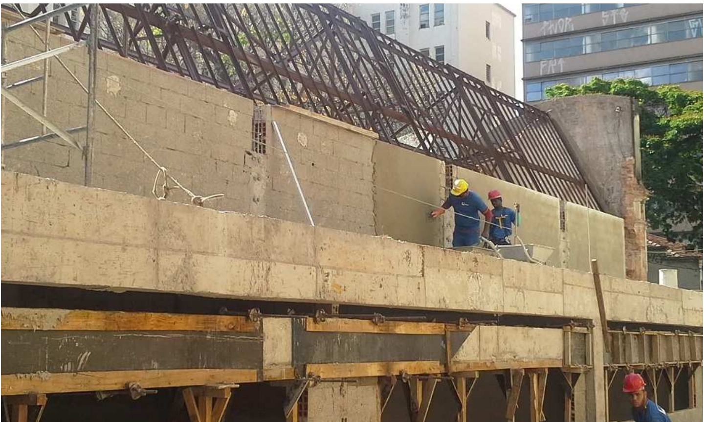
12. Revestimento - Bloco 4