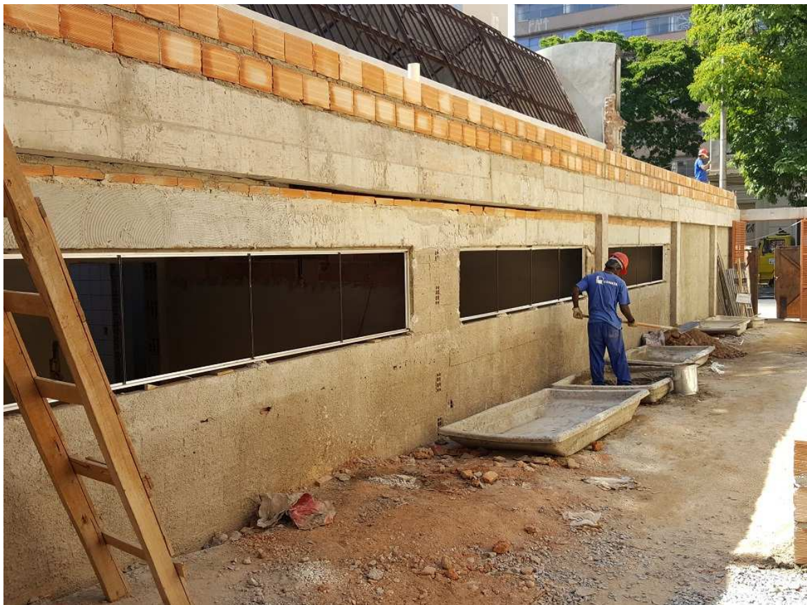
8 . Esquadria - Bloco 4 - Piso 2 - Consultórios