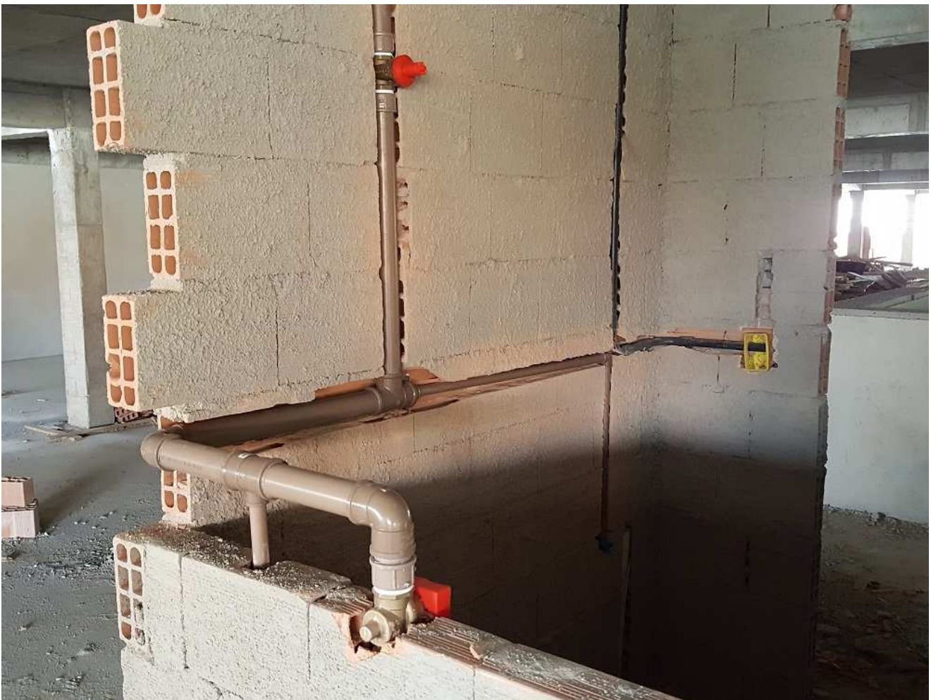
18. Instalações elétricas e hidráulicas - I.S do Bloco 2 - Piso 5