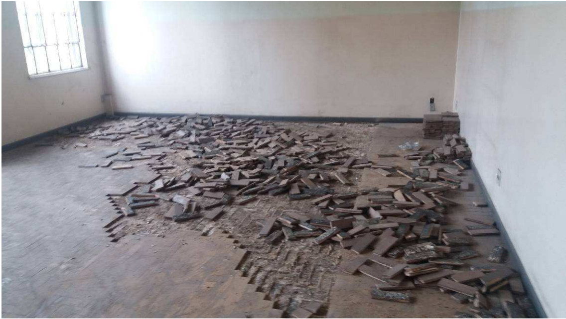
DEMOLIÇÕES E RETIRADAS DATA: NOVEMBRO/2016