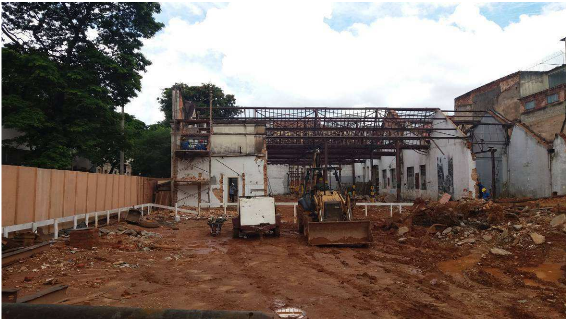
DEMOLIÇÕES E RETIRADAS DATA: NOVEMBRO/2016