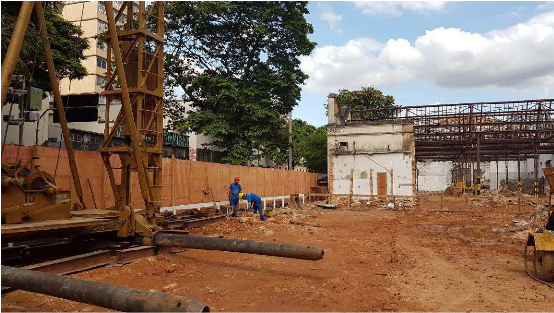
TAPUME DATA: NOVEMBRO/2016