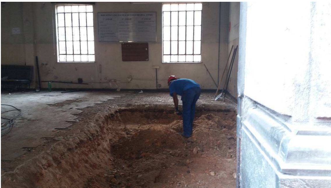
DEMOLIÇÕES E RETIRADAS DATA: NOVEMBRO/2016