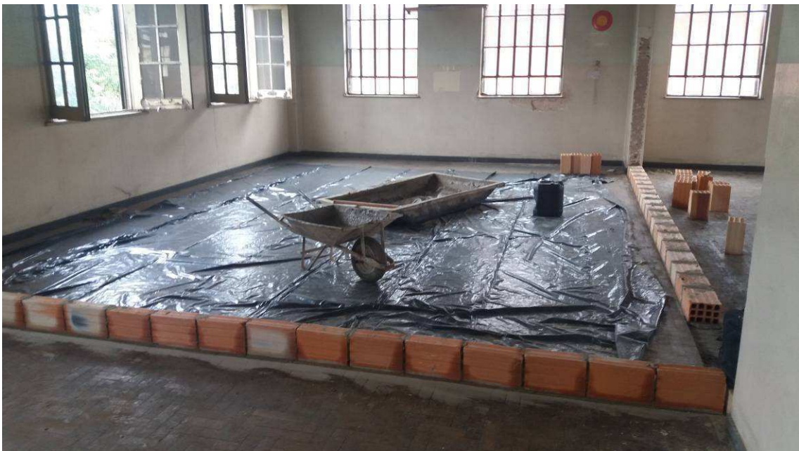
EXECUÇÃO DE ALVENARIA DATA: NOVEMBRO/2016