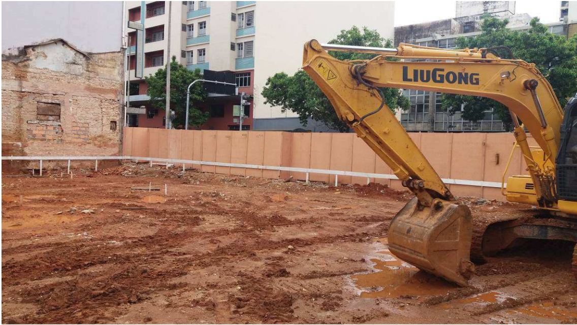
LOCAÇÃO DA OBRA DATA: NOVEMBRO/2016