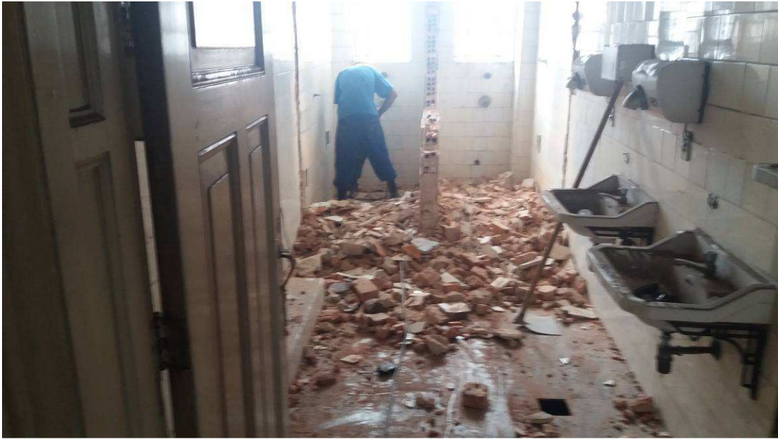
DEMOLIÇÕES E RETIRADAS DATA: NOVEMBRO/2016