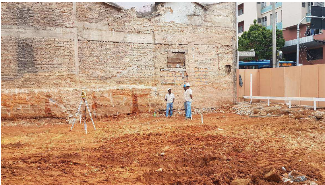
LOCAÇÃO DA OBRA DATA: NOVEMBRO/2016