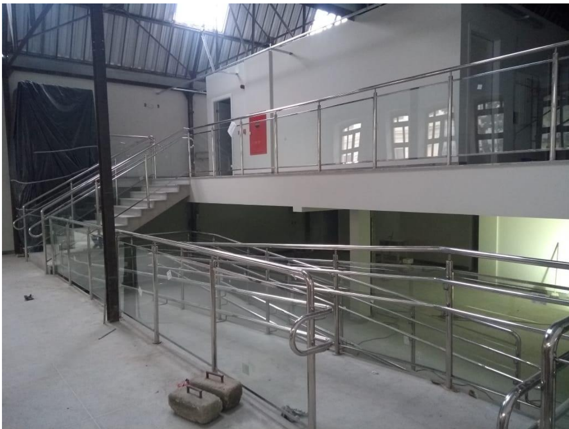
3. Serralheria - Corrimão e guarda corpo - rampa Christiano Ottoni