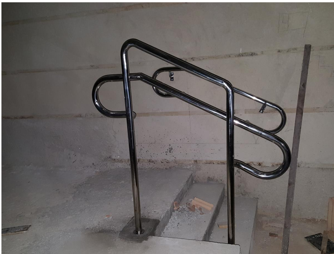
4. Serralheria - Corrimão escada auditório Christiano Ottoni