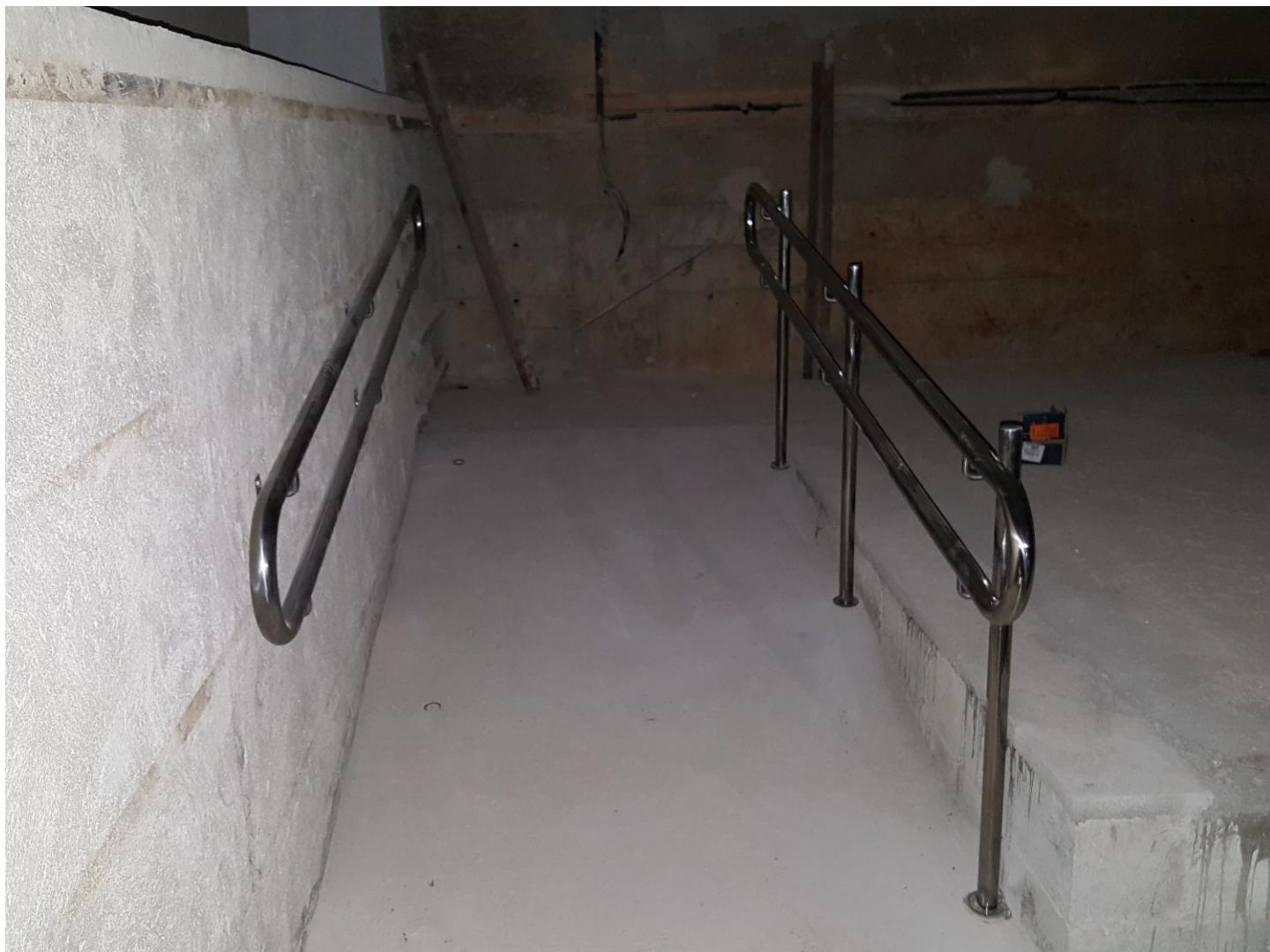
5. Serralheria - Corrimão rampa auditório Christiano Ottoni