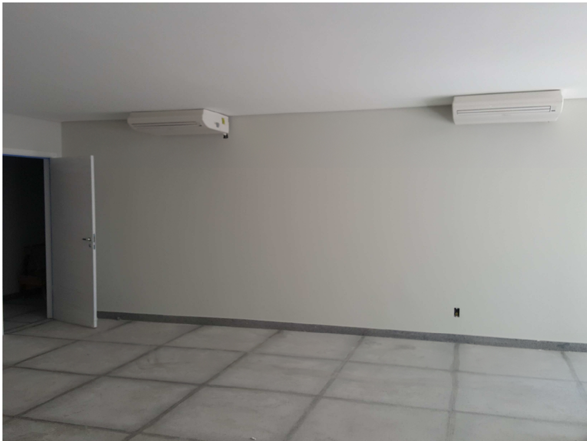
5. Ar condicionado – Edifício C. Ottoni