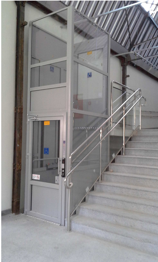
3. Plataforma – Edifício C. Ottoni