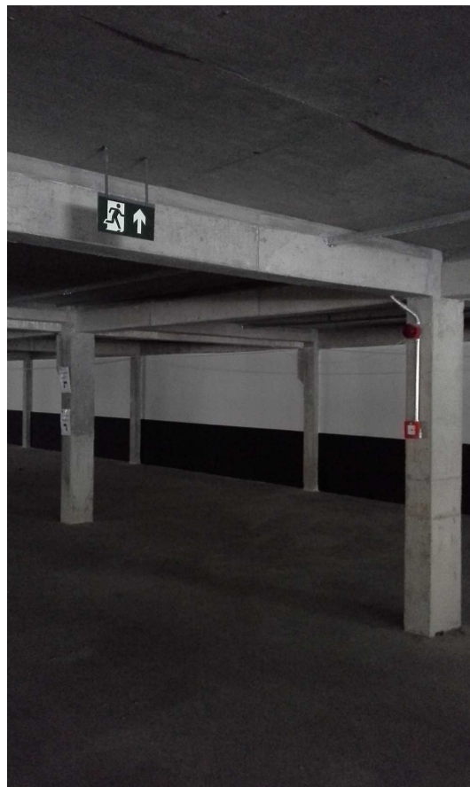
7. Placas de sinalização - Estacionamento