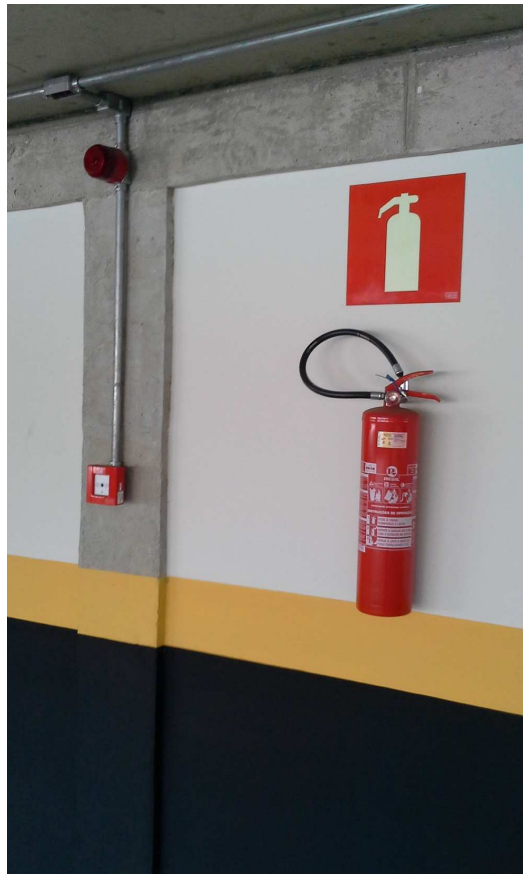
6. Placas de sinalização - Estacionamento