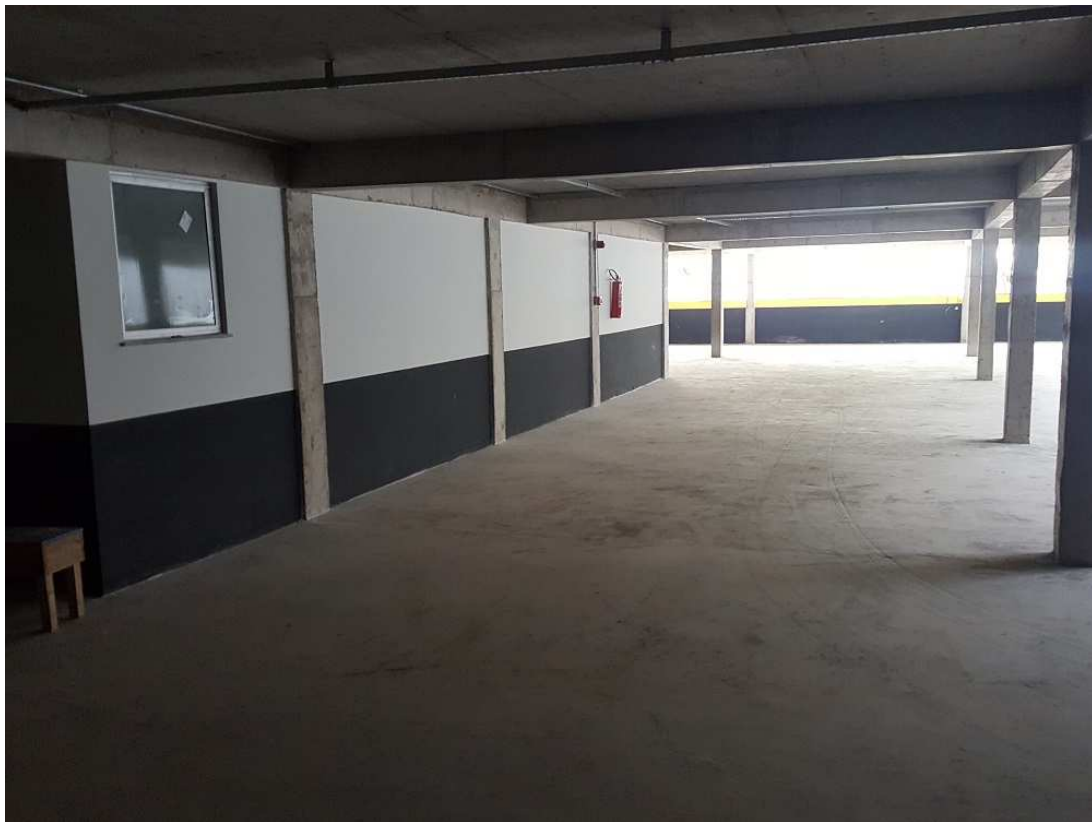
1. Pintura – Estacionamento