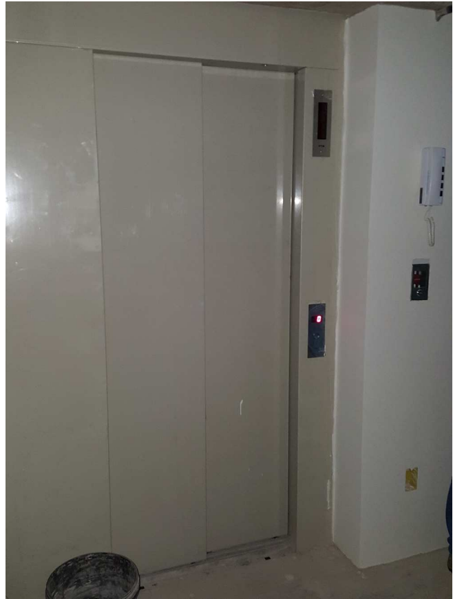
4. Elevador – Estacionamento